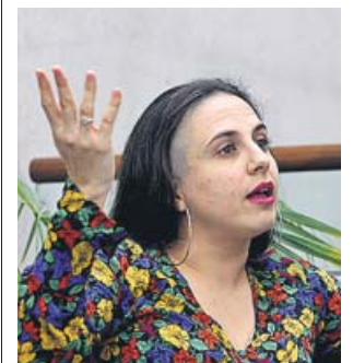
La escritora Cristina Morales.

Licenciada en Derecho y Ciencias Políticas, Morales es también autora, entre otros volúmenes, de Malas palabras (2015) y de Terroristas modernos (2017). El premio está dotado con 20.000 euros. ● R.C.