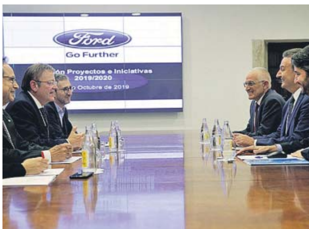
Ximo Puig mantuvo ayer una reunión de seguimiento con directivos de Ford España.

EXPEDIENTE La planta valenciana lo aplicará cinco días de noviembre a diciembre