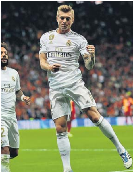
Kroos y Morata, los goleadores ayer.

Un gol de Kroos dio la victoria a los blancos ante el Galatasaray en Estambul. El tanto de Morata hizo que los rojiblancos ganaran en el Wanda al Bayer Leverkusen