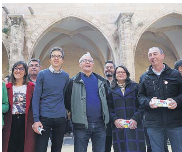
El alcalde, en campaña con Errejón, Oltra y Baldoví.