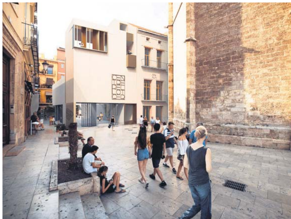
Figuración virtual con el nuevo edificio y el antiguo restaurado, junto al Micalet.

El Ayuntamiento va a construir un recinto infantil inclusivo en el Parque de Marxalenes. Con una inversión de 170.500 euros, ocupará 1.695 metros cuadrados junto a la calle San Pancracio. Los trabajos comenzarán en enero y durarán 12 semanas.