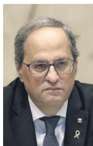
El president de la Generalitat, Quim Torra.

Hoy por hoy, insistió Torra, queda descartado «completamente cualquier adelanto electoral». No obstante, el dirigente también señaló que «las cosas no dependen solo del president », pese a que es únicamente él quien puede convocar a las urnas. Y es que Torra se enfrenta a una posible inhabilitación judicial para ejercer cargos públicos si se