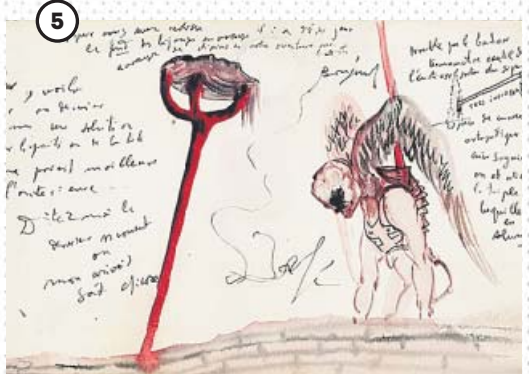
← Geniales aportaciones La muestra incluye pinturas, grabados y dibujos de Degas, Manet, Kirchner, Casas, Versace... Aquí, diseño de vestuario de Salvador Dalí para El Verdugo (tinta sobre papel, 1949). Royal Opera House Collections, Londres. © SALVADOR DALÍ, FUNDACIÓ GALA-SALVADOR DALÍ, VEGAP, BARCELONA, 2019