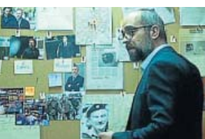
'Plan de fuga' LA SEXTA. 22.30 H