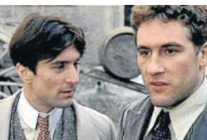
'Novecento' LA 2. 22.00 H