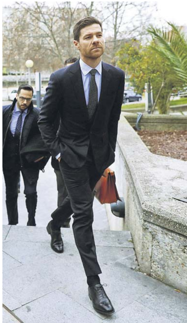
Xabi Alonso, durante su juicio por presunto fraude.

Para el tribunal no tiene relevancia «la clase de sociedad a la que se ceden los derechos, ni