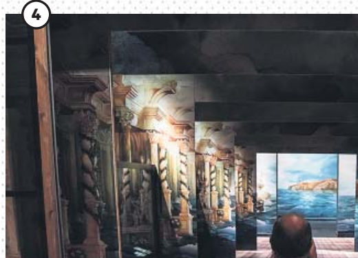
← Historia de Europa Viajamos por 400 años de ópera, de Venecia a Londres, Viena, Barcelona o Milán, a través de 300 objetos relacionados con el género. El recorrido es también un repaso a cuatro décadas de historia europea. La muestra se puede ver hasta el 26 de enero. CAIXAFORUM BARCELONA