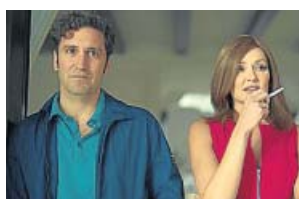
Toy Boy ANTENA 3. 22.40 H

Los propietarios de Mirador de Montepinar entran en pánico tras recibir una multa de la Seguridad Social. Indignados, deciden demandar a Menchu, la presidenta del complejo.