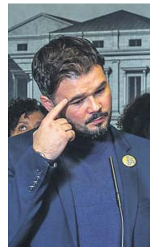
Gabriel Rufián, portavoz de ERC.

Rufián dejó sus condiciones en dos fases, antes y después de la investidura, pero optó por no concretar si bastaría con que el diálogo en una comisión bilateral como la que prevé el Esta-