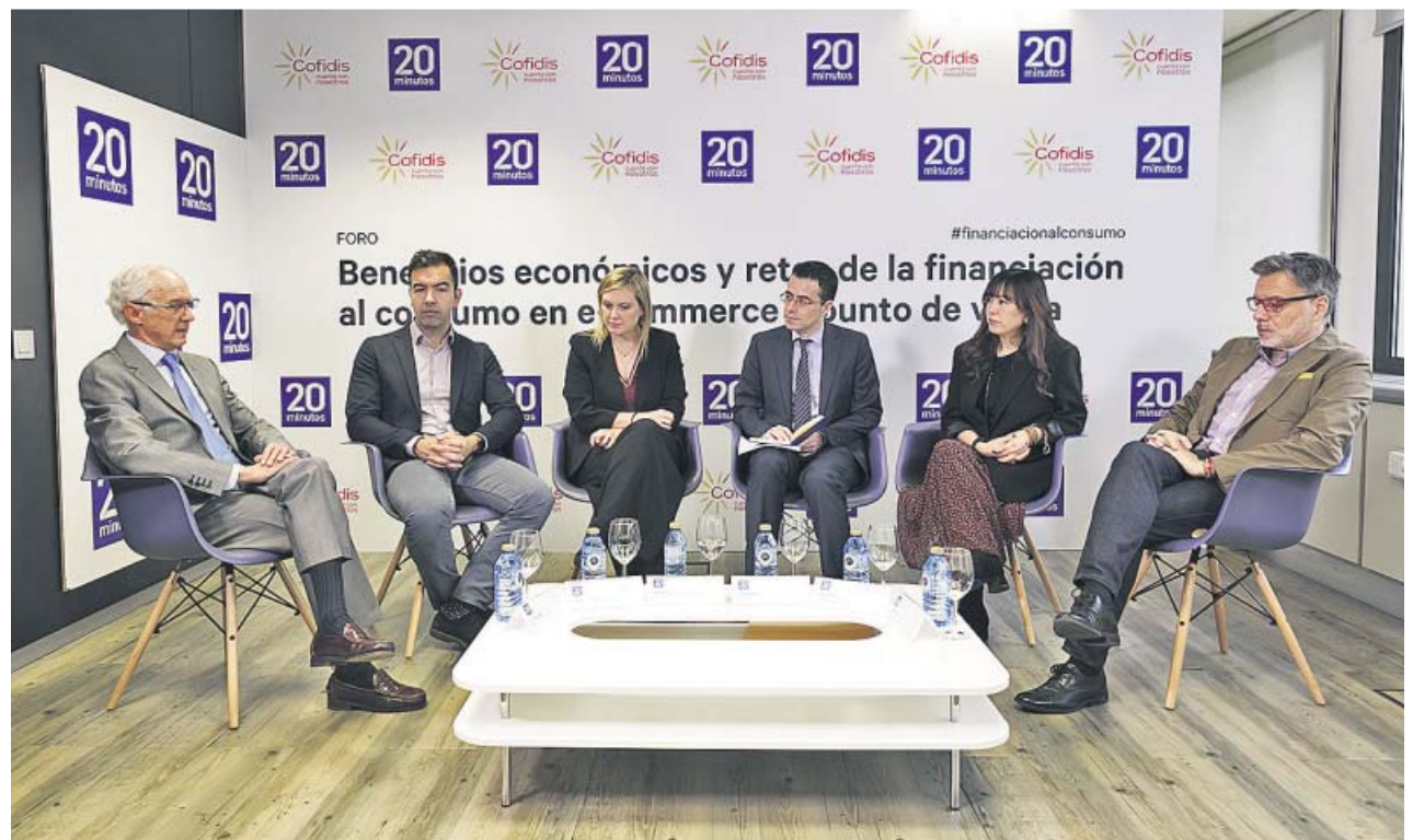
El panel de expertos que participaron ayer en el foro sobre beneficios y retos de la financiación al consumo. ENRIQUE CIDONCHA

Esta transformación, por la cual la mayor parte de procesos de compra se realiza online , ya es mayoritaria en algunos sectores como el de los viajes o incluso el de la telefonía móvil, pe-