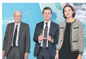
MARIO ARMERO Premio Fundación Ibercaja-Mobility City 2019 al Liderazgo Directivo

Vicepresidente ejecutivo de la Asociación Española de Fabricantes de Vehículos y Camiones, Armero es una figura clave en la renovación y modernización de esa institución, que en la actualidad es una de organizaciones empresariales con mayor actividad y prestigio. El Plan Tres Millones, que él mismo dirigió, luchó contra la deslocalización durante la crisis, intensificó las inversiones y protegió el empleo con la producción nacional de vehículos. Ha trabajado también con el Ministerio de Industria.