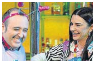
La que se avecina TELECINCO. 22.40 H

Los propietarios de Mirador de Montepinar entran en pánico tras recibir una multa de la Seguridad Social. Indignados, deciden demandar a Menchu, la presidenta del complejo.