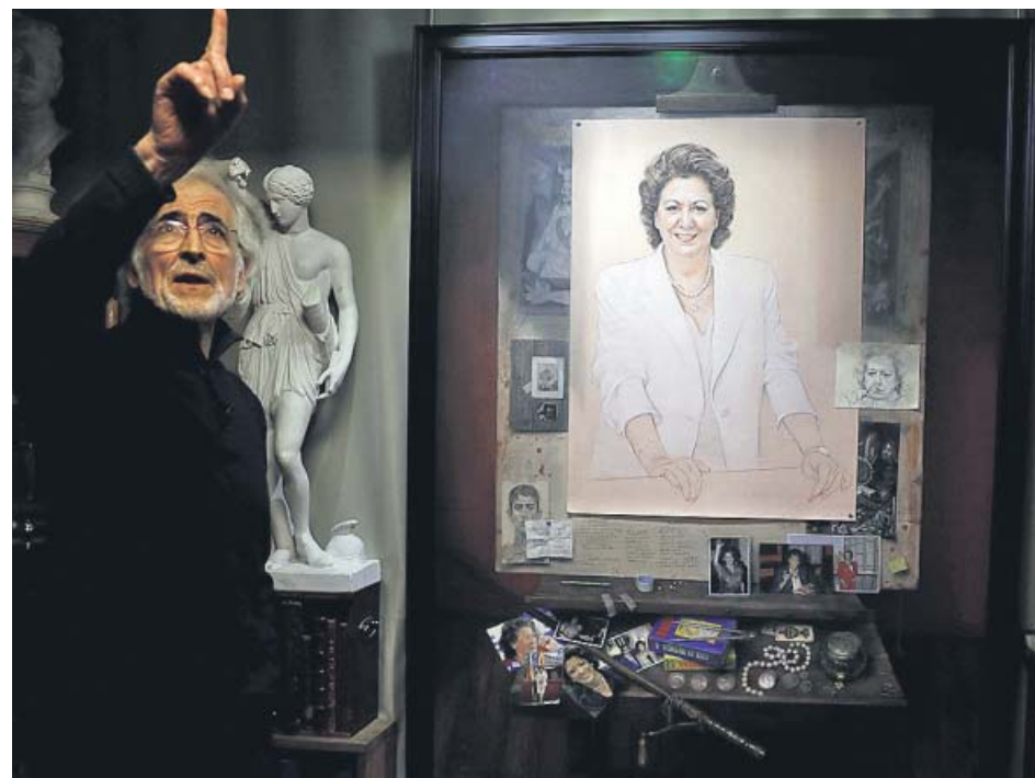
El autor, ayer, en su estudio, junto al lienzo de la exalcaldesa Rita Barberá.