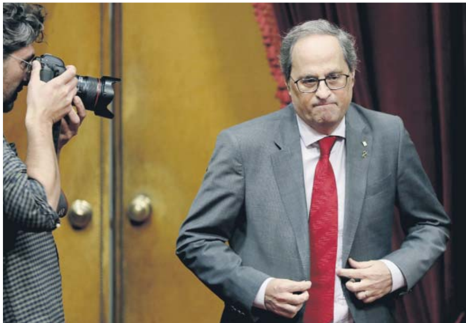
El presidente de la Generalitat, Quim Torra, durante el pleno de ayer en el Parlament.

Ante la imposibilidad de ponerse de acuerdo en un texto conjunto, las tres formaciones soberanistas decidieron presentar cada una su propia enmienda a la resolución, con cita literal incluida al punto suspendido, y con una resolución —en este caso sí que conjunta y