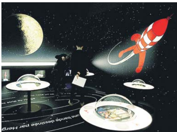
Ciencia y arte se aúnan en esta exposición.

La aparición de estas novelas y de las películas que están en producción muestran algo que le gusta «resaltar» a Saavedra: «Las grandes historias gustan, y si son verdaderas o tienen base de verdad, todavía más». ●