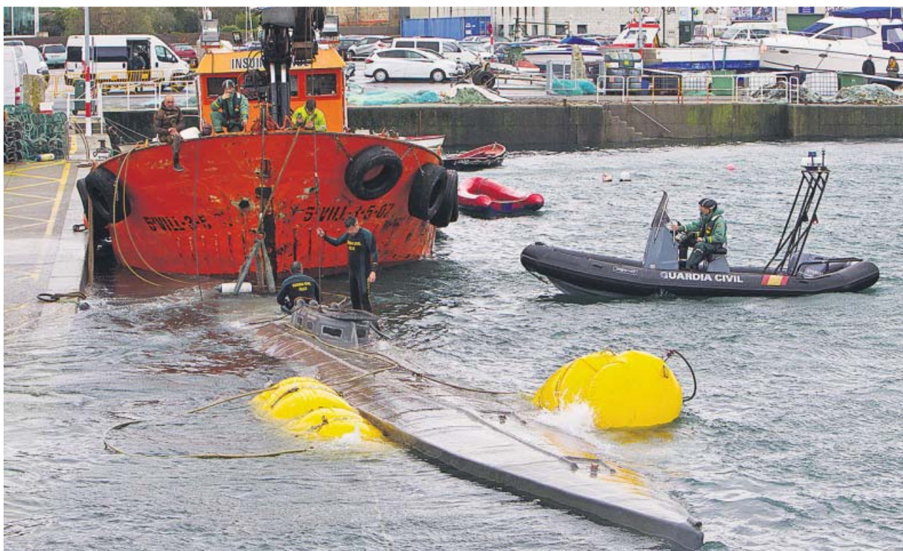
Imagen de las labores de los equipos marítimos para reflotar el narcosubmarino en las costas gallegas.

EMILIO ORDIZ emilio.ordiz@20minutos.es / @EmilioOrdiz