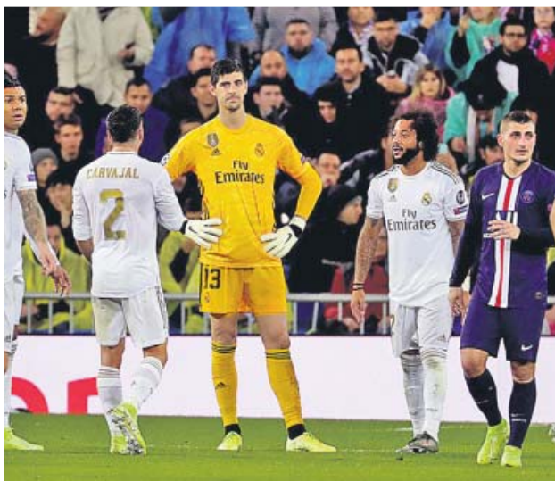
Courtois y varios jugadores del Madrid se lamentan tras un gol del PSG (i). Oblak no puede evitar el tanto de Dybala (d).

La Fundación de la UEFA para la Infancia destinará 4,76 millones para financiar 42 proyectos en la presente temporada, dedicados a apoyar a las víctimas de conflictos y a promover el empleo a través del deporte.