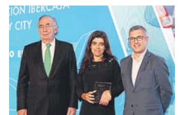
CIUDAD DE LISBOA Premio Fundación Ibercaja-Mobility City 2019 al Proyecto Europeo

Navilens ofrece una tecnología disruptiva de señalética orientada a personas con visión reducida que permite la orientación en cualquier lugar de la ciudad mediante un smartphone y un sistema de señales colocadas en distintos puntos. Funciona mediante un algoritmo basado en inteligencia artificial y visión computerizada capaz de detectar múltiples marcadores a grandes distancias en milisegundos, incluso con el dispositivo en movimiento y sin necesidad de enfocar.