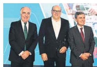
NAVILENS Premio Fundación Ibercaja-Mobility City 2019 en Influencia Social

La start-up barcelonesa Shotl se dibuja como una nueva plataforma de transporte de pasajeros a demanda capaz de agrupar en tiempo real a los usuarios de autobús a partir de sus orígenes y destinos. El servicio facilita autobuses flexibles sin rutas ni horarios, que se acercan al usuario cuando y donde lo necesita. Además, el servicio dispone de un algoritmo que define la ruta más adecuada según la petición de cada pasajero. Más información en: shotl.com