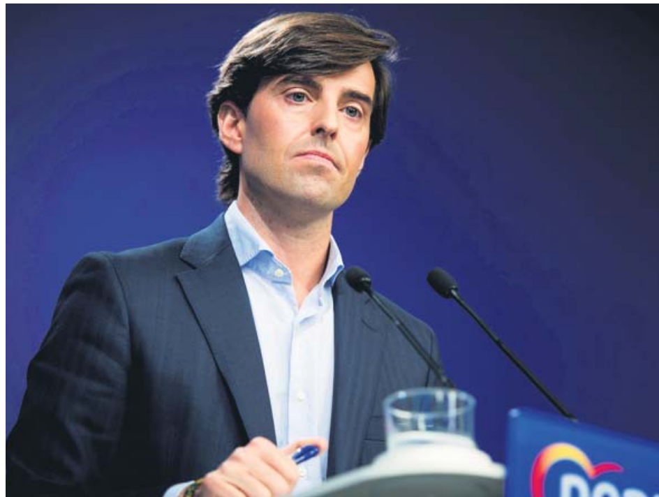
El vicepresidente de Comunicación del PP, Pablo Montesinos.

PSOE Y UNIDAS PODEMOS despliegan una estrategia conjunta para excluir a Vox del gobierno del Congreso PLANTEABAN para ello dejar cuatro de los nueve puestos en la Mesa a PP y Cs, como tras el 28-A