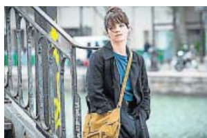
Profilage A3S. 22.40 H

Con Borja detenido, el caso parece cerrado. Solo hay que conseguir las pruebas para presentárselas al juez. Sin embargo, el almacén donde se custodian sufre un misterioso incendio.