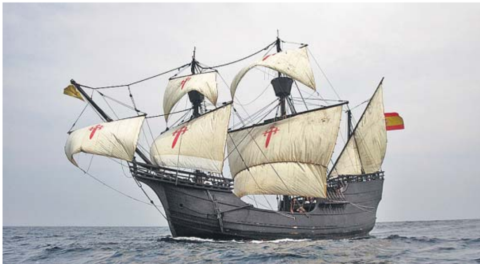
Réplica de la Nao Victoria, una de las naves de la expedición de Magallanes.