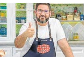
RECETAS Hacer de comer LA 1. 13.25 H

Desaparecidos , giro en la investigación. En España hay más de 12.300 casos sin resolver de personas desaparecidas. El programa se adentra en tres casos.