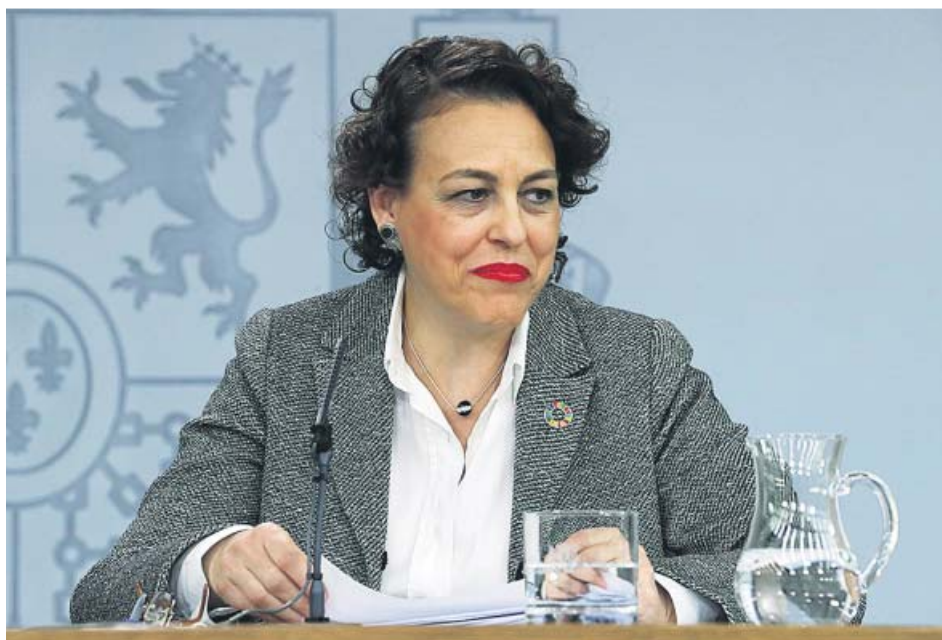
La ministra de Trabajo, Migraciones y Seguridad Social en funciones, Magdalena Valerio.

En su primer diciembre en la Moncloa, en 2018, Sánchez decretó una subida del 22%, cuando pasó de 735 a 900 euros el SMI. Precisamente, esta subida récord es la que ha llevado a pensar a los empresarios que en 2020 quizá no debería haber un nuevo incremento, una idea con la que discrepan totalmente los sindicatos, que exigen que el salario mínimo aumente otros 100 euros más al mes y se sitúe en los 1.000 euros.