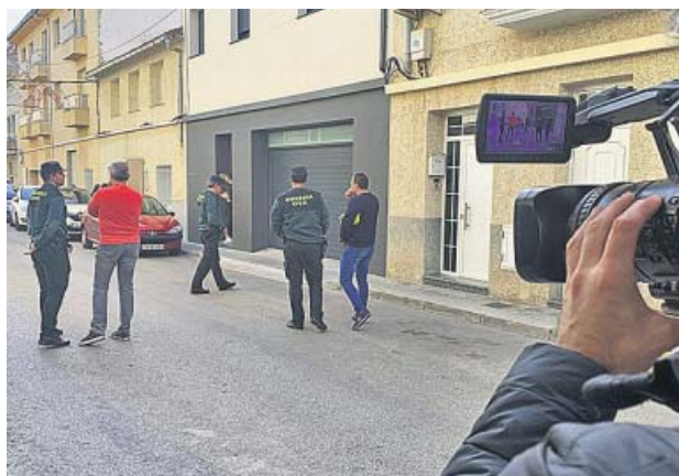
Los agentes, ayer, en el registro de la vivienda de L'Ollería.

Estas circunstancias han permitido a los vecinos del pueblo grande relatar sus observaciones. Aseguran haber visto al sospechoso recientemente en la casa. Y no solo eso. Según re-