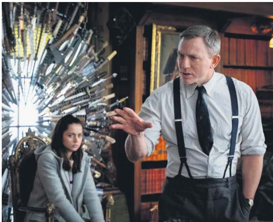
Ana de Armas y Daniel Craig, sospechosa y detective en busca del asesino.

Puñales por la espalda es una pieza whodunit ortodoxa —reparto coral en un entorno cerrado, actores famosos interpretando personajes de brocha gorda, detective excéntrico y cadáver a los postres— que toma la plantilla clásica para plegarla, voltearla e incluso rasgarla con habilidad papirofléxica: aquí, la identidad de quién está detrás de la muerte del adinerado patriarca de turno (Christopher Plummer) es lo de menos.