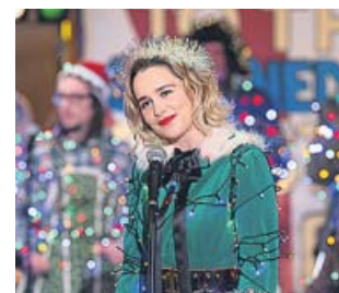
Emilia Clarke como elfa de Santa Claus.

La pasada Navidad entregó su corazón, pero al día siguiente lo dejaron marchar. Este año, Emilia Clarke quiere ahorrarse lágrimas y busca alguien especial en una come-