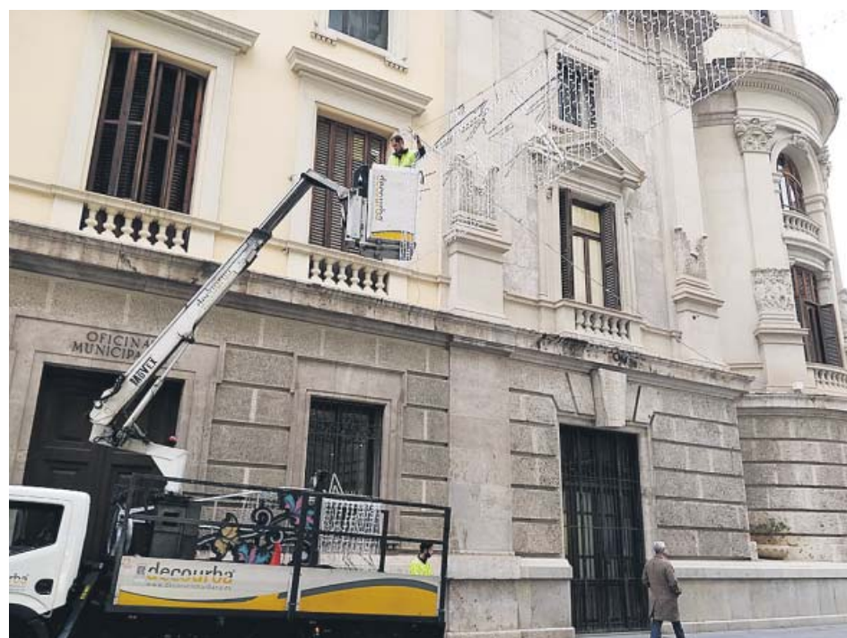
Últimos trabajos de colocación de las luces, ayer, en el entorno de la plaza del Ayuntamiento.