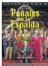
2019. Director Rian Johnson Reparto Daniel Craig, Chris Evans, Ana de Armas

Johnson es consciente de que, más allá de la diversión proporcionada por la búsqueda de pistas para resolver el crimen antes de la revelación final, los misterios de Christie funcionan gracias a dos elementos combinados: las peculiaridades de sus investigadores y una chispa de ironía que no se apaga aunque se acumulen los fiambres. Para salir victorioso de la réplica cuenta con la colaboración de Daniel Craig en el papel del detective privado Benoit