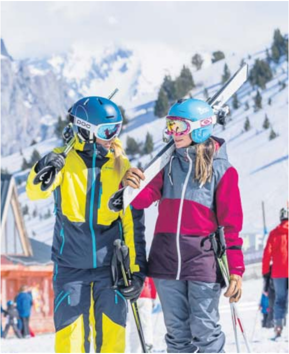
Esquiadores, en la estación de Panticosa. ARAMÓN