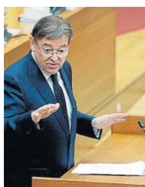
Ximo Puig, ayer, en el pleno de Les Corts.

Gracias a este préstamo se podrán impulsar iniciativas cofinanciadas, como 93,5 millones en transferencia tecnológica y cooperación universidad-empresa orientada ha-