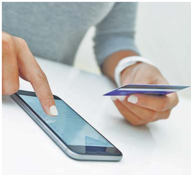
En estos días se disparan las compras online.

Por si no te habías dado cuenta, para triunfar en el