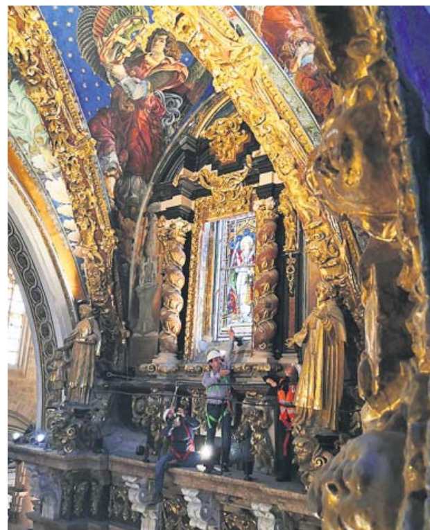
Inspección de los frescos de la catedral. GENERALITAT

Un hombre ha fallecido y otro ha resultado herido al volcar este miércoles un camión frigorífico de frutas en la incorporación de la A-7 a la A-35, según informó ayer el Centro de Coordinación de Urgencias.