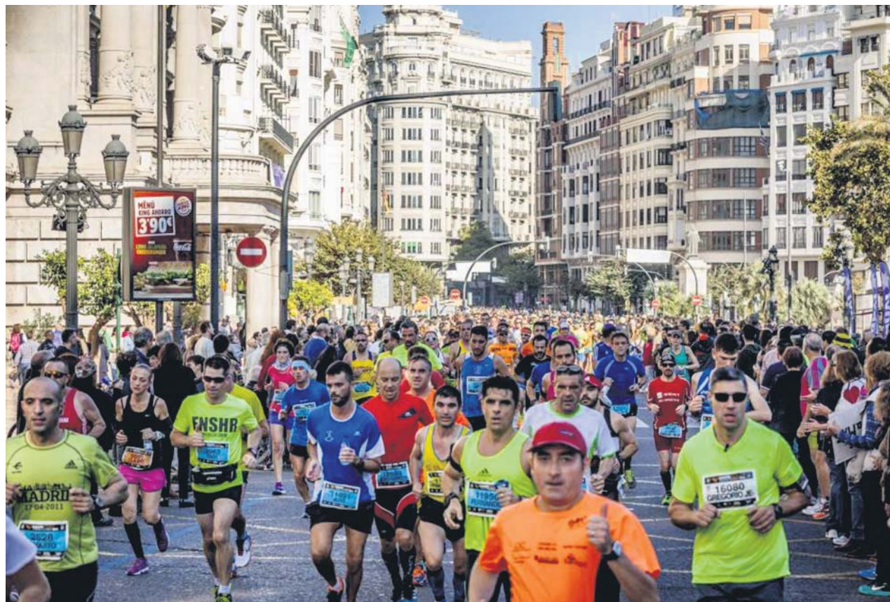
Miles de participantes recorren el centro de Valencia durante la Maratón de 2018.

El mismo día de la carrera, de 5.00 a 11.00 horas, se cerrará al tráfico la avenida del Instituto Obrero hasta la rotonda de Hermanos Maristas con Amado Granell y la avenida Profesor López Piñero. Las calles colindantes a la Ciudad de las Artes serán las más afectadas puesto que se trata de la zona de inicio y fin. ●