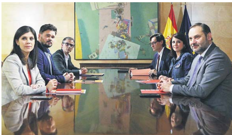
Los equipos negociadores de PSOE y ERC, al inicio de la reunión. PSOE

EL PSOE aparca el término «convivencia», asume la tesis de ERC y explora un pacto más allá de la investidura