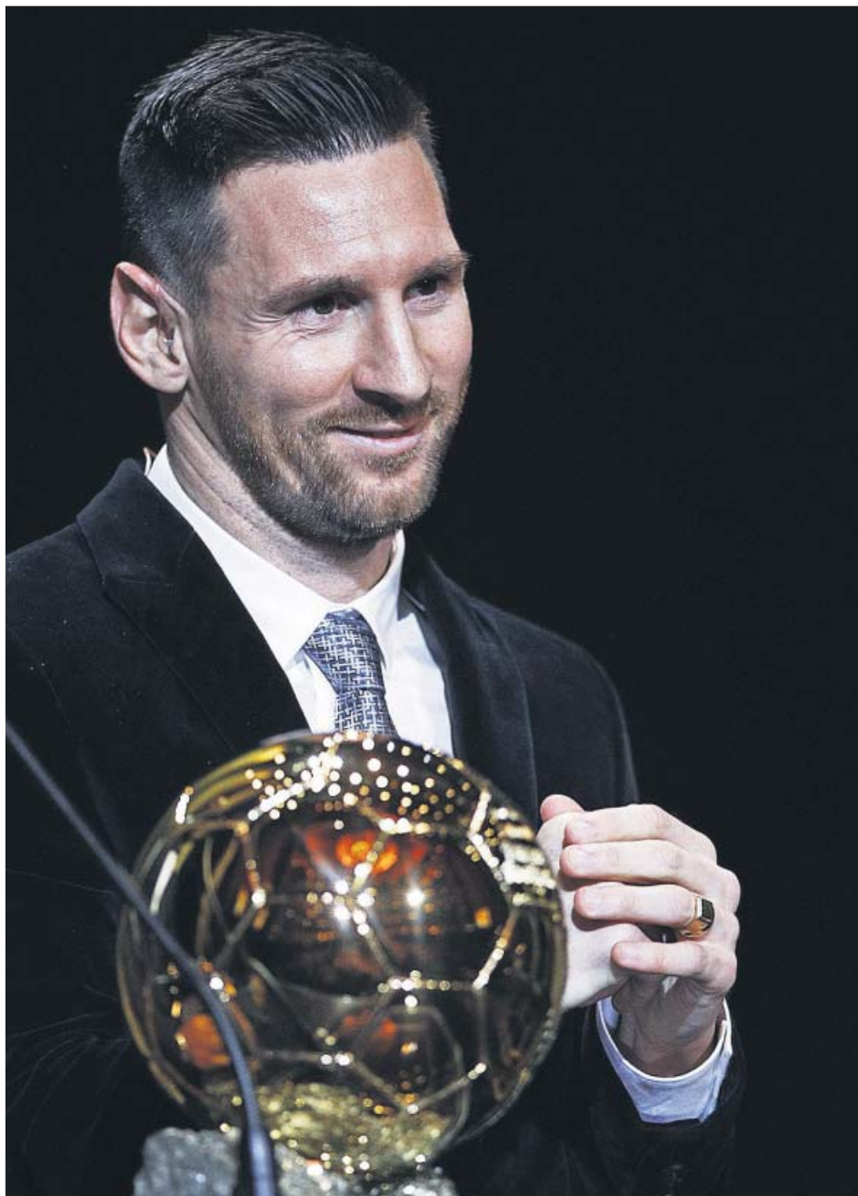
Leo Messi, con el sexto Balón de Oro.

El brillo individual de Messi ha podido con el Liverpool, que coló dos miembros entre los cuatro primeros (Virgil Van Dijk y Sadio Mané) y tres entre los diez (también Mo Salah y Alisson Becker). Su gran bandera era Van Dijk, un central imponente de los que ganan títulos pero carente del glamour de jugadores como Messi o Cristiano. Fabio Cannavaro sigue siendo así el último defensa que ganó el título en el ya lejano 2006.