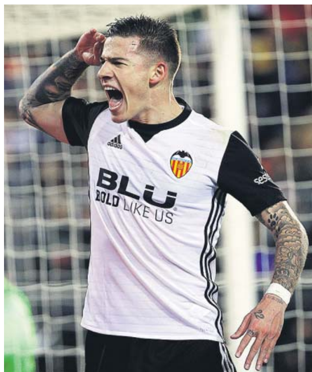
El exdelantero del Valencia CF, Santi Mina.

La denuncia se produjo después de que la presunta