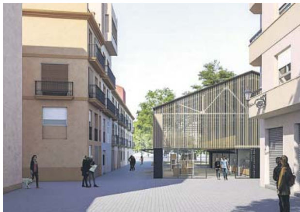
Proyección del exterior del mercado en el barrio de Morvedre.