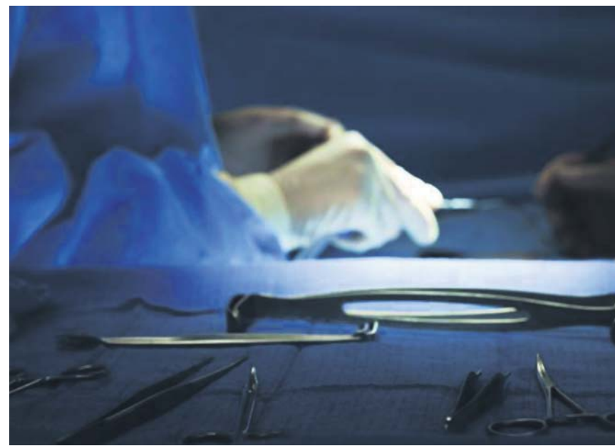
Suele ser necesario en torno a un mes para ganar un centímetro de altura.

Lee este y otros reportajes, así como entrevistas y noticias de última hora de cultura, en nuestra web.