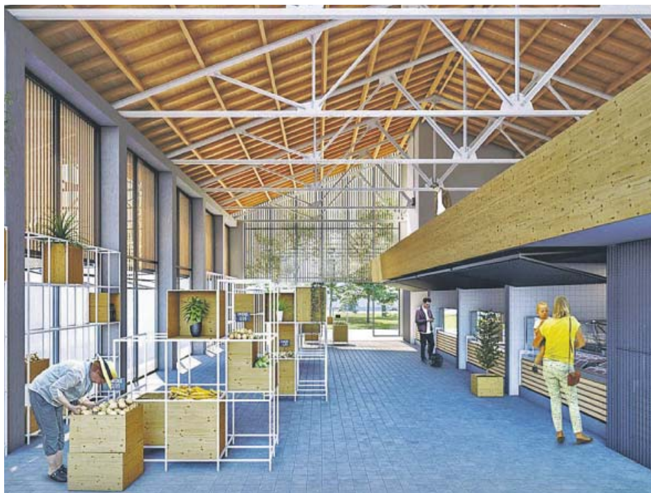
Figuración virtual del interior del recinto tras la rehabilitación.

«Con este proyecto damos el pistoletazo de salida para recuperar y revitalizar este mercado, tal como hemos hecho en el Mercado del Grau, donde ya están en marcha las obras», explicó Galiana, que concretó que el siguiente paso será, «a cargo del presupuesto de 2020, la aprobación del proyecto