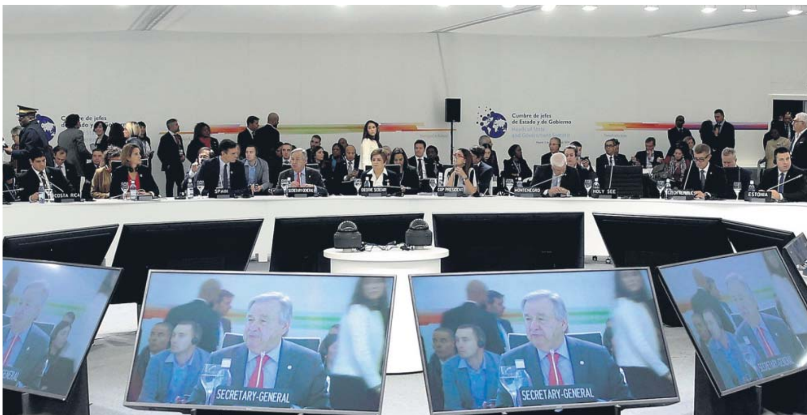
El secretario general de la ONU, António Guterres, durante su intervención de ayer en la Cumbre del Clima.

por ciento de reducción de emisiones en la UE en 2030, propuesta de la Comisión que España ve bien.