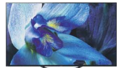
Imagen sin límites. Televisor OLED 55" Sony KD-55AG8 Ultra HD 4K con sistema operativo Android 8.0 Oreo y Acoustic Surface Audio

Elegancia y resolución. Smartphone Samsung Galaxy A70 con pantalla Full HD+ de 6,7", 6 GB de RAM y 128 GB de memoria interna