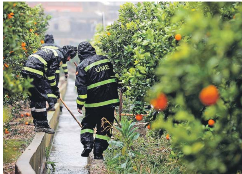
La Unidad Militar de Emergencias (UME), ayer, durante las batidas bajo la lluvia.

año en que Jorge ingresó en prisión en Italia por un asunto de tráfico de drogas.