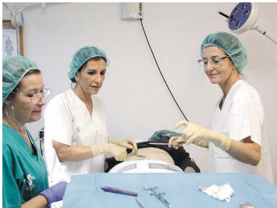
Intervención de cirugía menor en un centro de salud de La Fe. GENERALITAT

La Feria del Automóvil de València ha resistido «con creces» al superar las 3.800 unidades vendidas en cuatro días durante su 22.ª edición y se ha erigido como la «mejor plataforma comercial en el negocio de venta de coches», según ha informado la entidad.