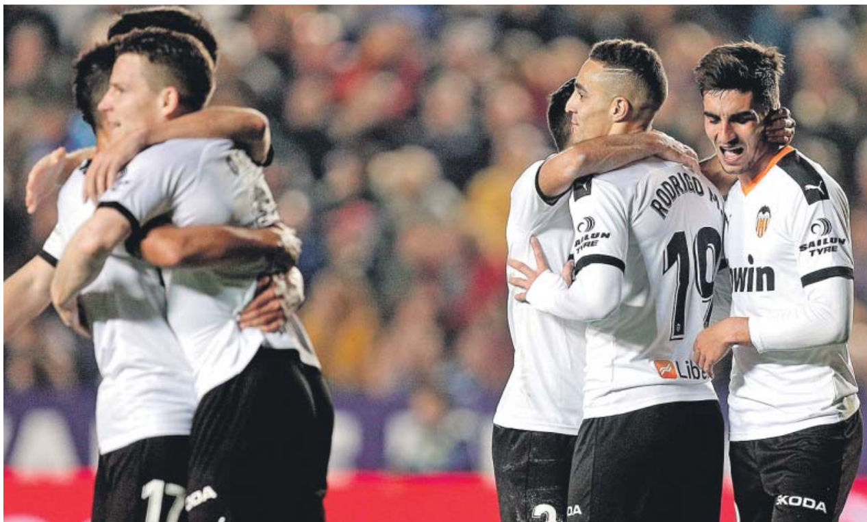
Los jugadores del Valencia se abrazan tras el tercer gol ante el Levante el sábado.