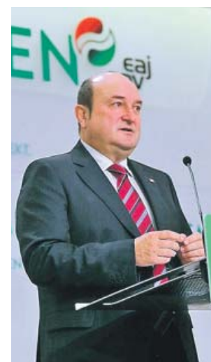
Ortuzar, en rueda de prensa. PNV

En otra entrevista publicada ayer, en este caso en La Razón , el primer secretario del PSC, Miquel Iceta, apostó por la ruptura de bloques como la solución al bloqueo y aseguró que España estaba conformada por hasta nueve naciones. «Para algunos, nación y Estado son lo mismo y la nación es homogénea. Para nosotros no. Por eso, España es una nación de naciones, y las naciones que viven en España son plurales», declaró Iceta, que aseguró que, si se suma «el preámbulo de Navarra»,