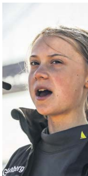
Greta, en Lisboa.

Como defensor de la ciencia por sí misma y de su valor para la sociedad, y por tanto como persona que apoya y difunde el consenso científico sobre la realidad del cambio climático antropogénico, se supone que aquí debería aclamar y elogiar a la joven Greta Thunberg. Se supone, porque si uno atiende a los medios, a la calle y a las redes sociales, parece que solo hay dos equipos a los que apuntarse: el de la preocupación por la crisis climática, pro-Greta, y el del negacionismo de la crisis climática, anti-Greta. Pues bien, aquí va una tercera opción. Vaya por delante que esto solo trata sobre la labor pública de Greta y lo que representa de cara a la lucha contra el cambio climático.