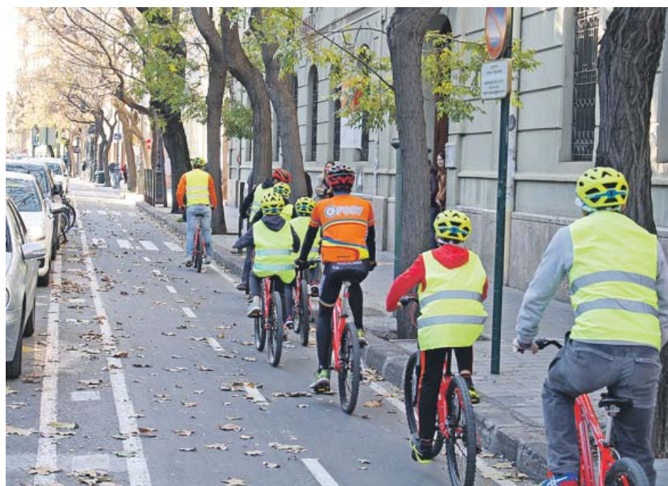
Alumnos del colegio público Cervantes de València, ayer, durante la iniciativa.

El Ayuntamiento de València ha vallado la plaza interior que forman las calles Luis Oliag, José Capuz y Reino de València, en Monteolivete, para evitar que siga sirviendo de espacio en el que los perros hagan sus necesidades.