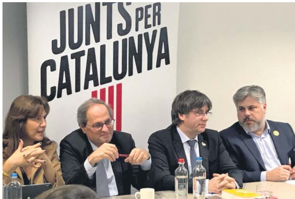
Puigdemont y Torra presidieron ayer una reunión de JxCat en Bruselas (Bélgica).