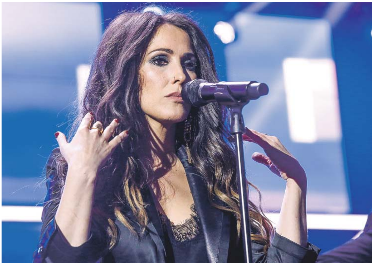
La cantante Malú, durante una actuación en Operación Triunfo 2018 en Barcelona.