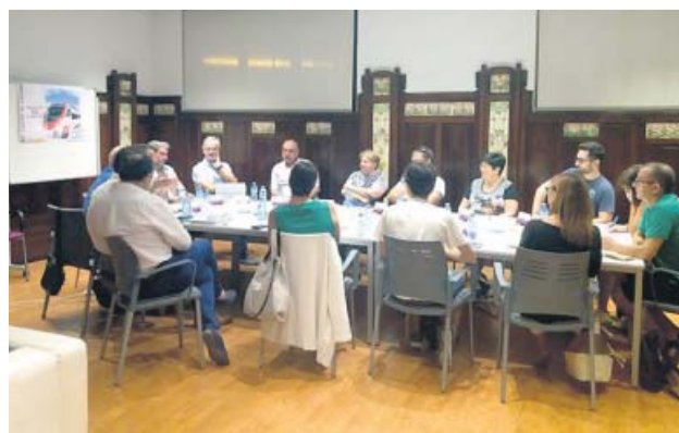
Reunión del comité de clientes de Cercanías el pasado octubre.

UNA PLATAFORMA llama a manifestarse ante los continuos retrasos y cancelaciones de los trenes en València