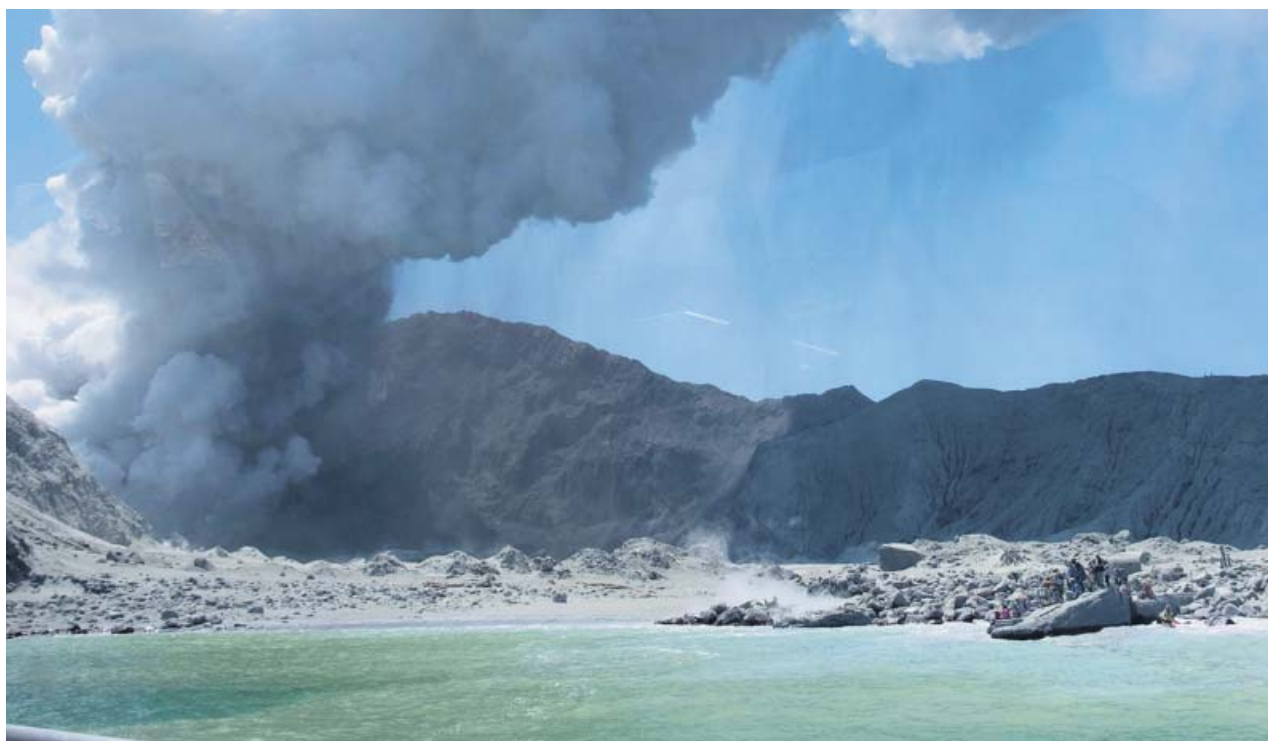
La imagen de un turista del Whakaari muestra el cráter del volcán en plena erupción.

Paralelamente al luto, las preguntas no han tardado en salir a la superficie. La primera es obvia: «¿Qué hacían medio centenar de turistas paseando por el cráter de un volcán activo? ¿Qué falló? Hacía solo una semana que el grupo de control de actividad geológica GeoNet advirtió