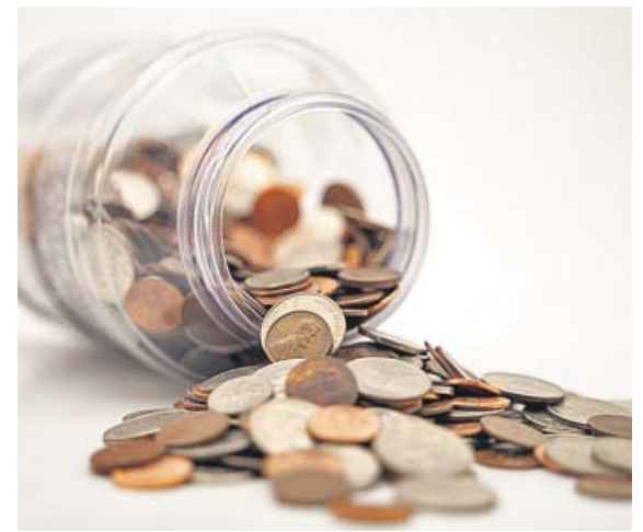
Más de siete millones de españoles tienen un plan de pensiones.

¿Qué opina de que el Gobierno vaya a financiar la vareniclina para dejar de fumar? Se ha cuestionado mucho que se financie un medicamento que no es la primera elección. Se sabe que en general para la población la primera elección para dejar de fumar es la terapia cognitivo-conductual, los parches y los chicles, que son efectivos y un poco más seguros. El medicamento que se ha financiado puede tener algunas contraindicaciones. Es una noticia positiva, pero no se ha justificado por qué no se han introducido otras terapias. ●