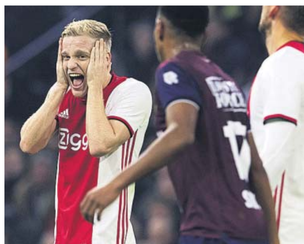
Van de Beek, una de las estrellas del Ajax, ya se midió con el Valencia en Champions esta campaña.

El cuadro napolitano tiene grandes jugadores (los españoles Fabián Ruiz, José Callejón y Fernando Llorente, y Dries Mertens, Insigne, Hirving Lozano, Milik, Koulibaly, Zielinsky...) que pueden complicar la vida al Barça el 25 de febrero (la ida) y el 18 de marzo (la vuelta). ●