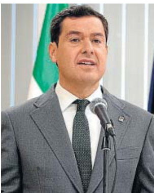
La ministra María Jesús Montero y Juanma Moreno.

de Liquidez Autónoma (FLA). Concretamente, insta a la Junta a presentar «medidas que garanticen el cumplimiento de los objetivos de estabilidad y de deuda pública y que sea consistente con su plan económico-financiero».