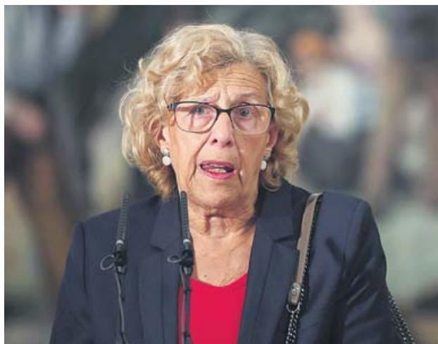
Manuela Carmena, en una fotografía de archivo.

La «manuelamania» se extendió por redes durante la campaña de las municipales de 2015. Manuela Carmena se presentaba a la alcaldía de la capital al frente de Ahora Madrid, un partido que recogía en su programa las reivindicaciones socioeconómicas surgidas al calor del 15-M. La 'guerrilla gráfica' en la que participaron miles de jóvenes hizo de Carmena una especie de icono pop y fue definitiva para la victoria. Ahora, la exalcaldesa les devuelve el gesto con la publicación de A los que vienen , un libro con el que se dirige a las nuevas generacio-