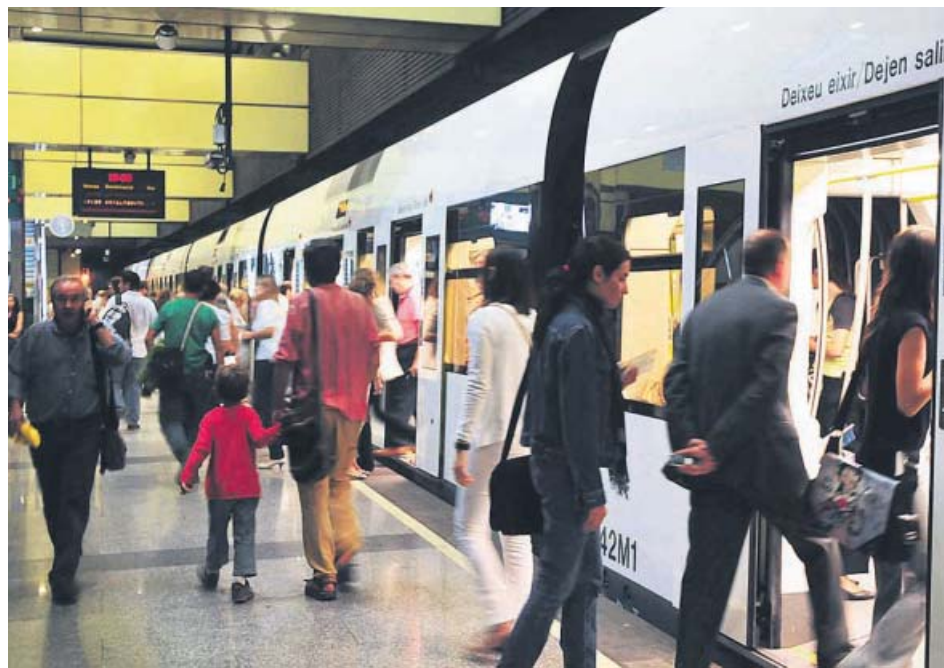
Usuarios del metro de València en la estación de Colón.

Esta modificación supone que las personas que se desplazan por tres o más zonas, que son las que soportan mayores precios del servicio