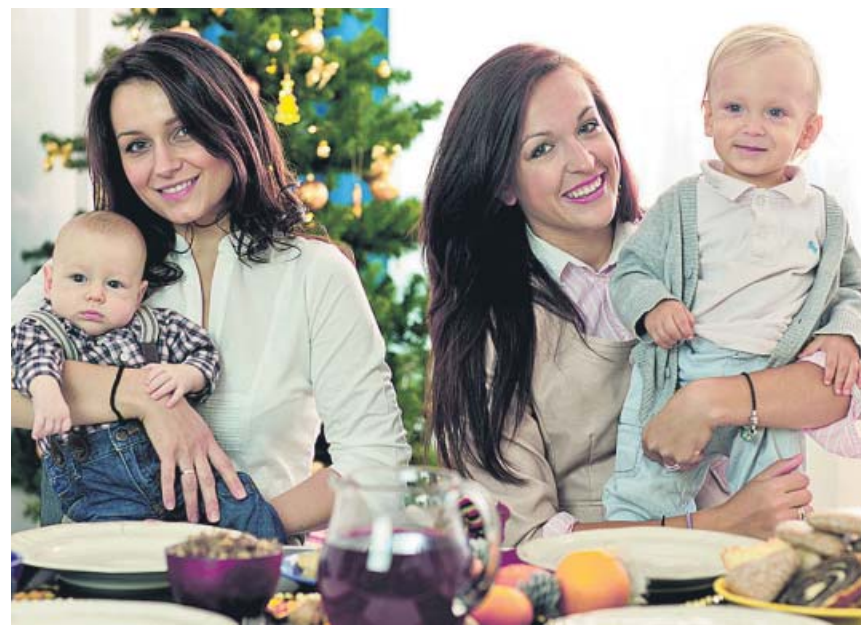
Las Navidades son unas fechas en las que aumentan las reacciones alérgicas.

Puedes leer muchas más noticias sobre famosos en nuestra edición digital.