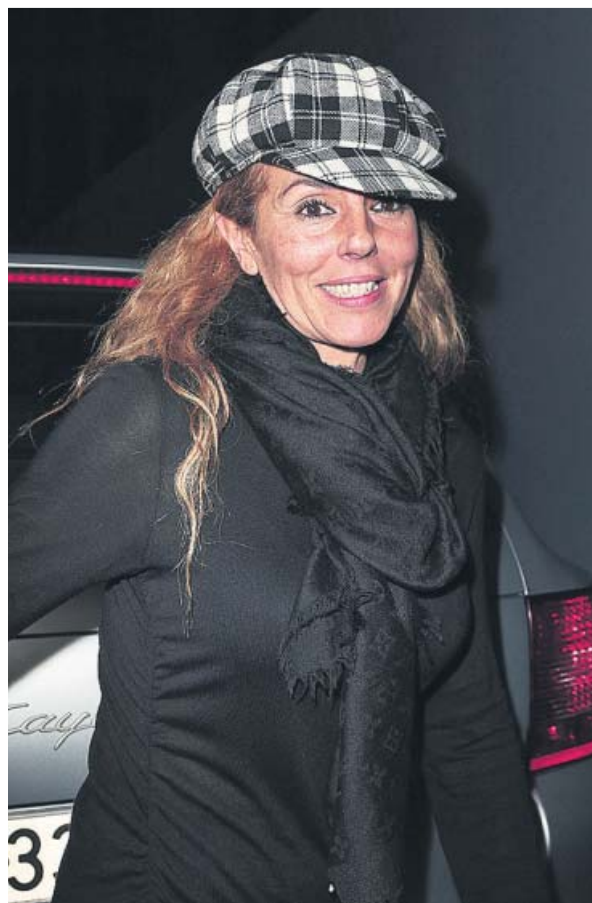
Rocío Carrasco, por las calles de Madrid.