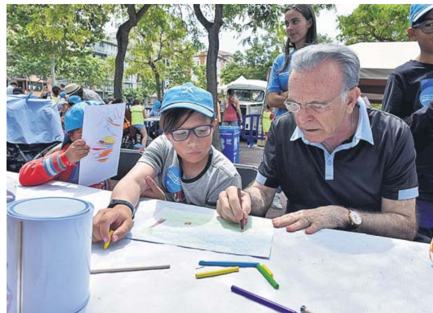
El presidente de Fundación La Caixa, Isidro Fainé, en uno de los eventos solidarios.

Esta combinación de desastres se conjugó con un récord de temperaturas en Valencia. Según la Agencia Estatal de Meteorología (Aemet), el sábado se registró el día más cálido en un mes de diciembre desde el 27 de diciembre de 1911, hace más de un siglo. Los termómetros alcanzaron los 25,4°C. ●