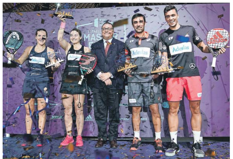
Ari Sánchez y Alejandra Salazar (izq.) y Pablo Lima y Alejandro Galán (dcha.).