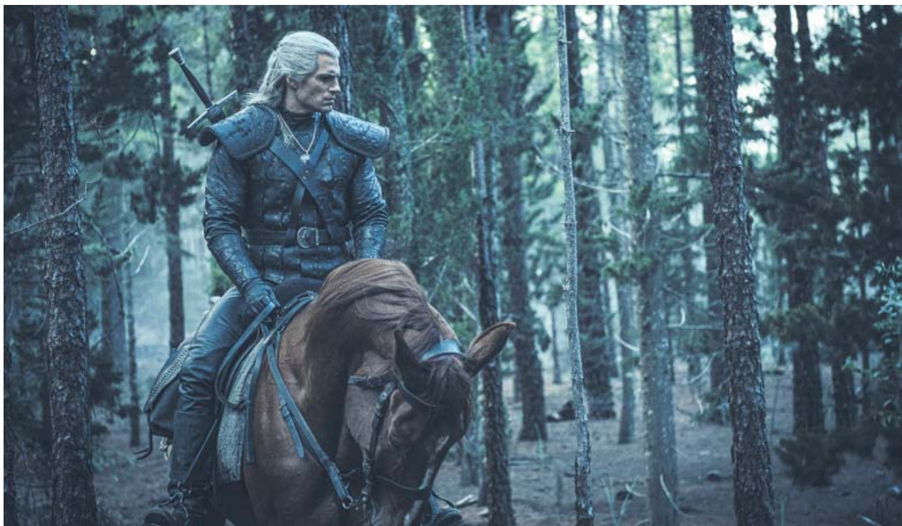
Henry Cavill da vida a Geralt de Rivia en la nueva apuesta de la plataforma.