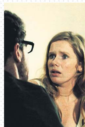
Los protagonistas de la ficción sueca.

Parece que apenas sucede nada, y lo que sucede —un embarazo no buscado y su interrupción, una infidelidad— se cuenta sin aspavientos. Hay algunas decisiones radicales, como