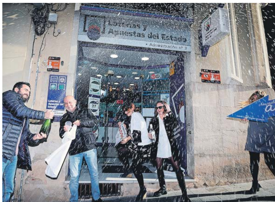
En la imagen superior, los exteriores del bar Pepe en Sant Vicent del Raspeig. En la inferior, la Administración de Lotería n.º 3 de Alcoi.

(60) y Moraira (20). La única provincia agraciada con más cantidad del primer premio ha sido Tarragona, donde se han despachado 360 millones solo en Salou.