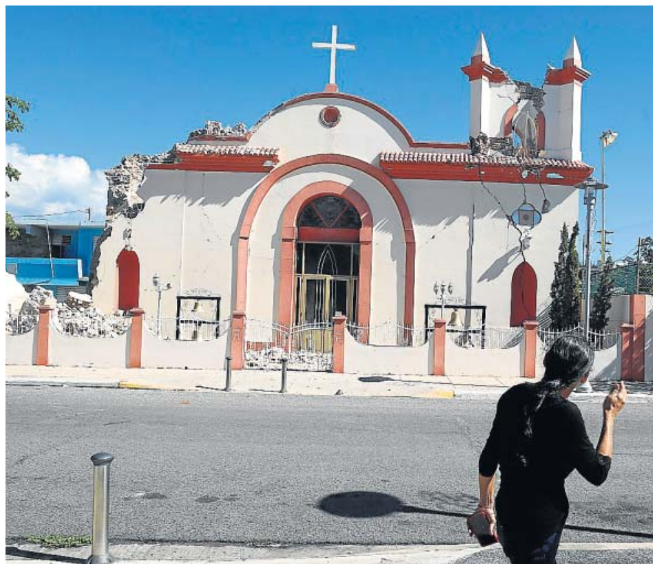
Un hombre camina frente a una parroquia afectada por el terremoto registrado ayer.

so se extiende al golfo Pérsico, el estrecho de Ormuz, el mar Arábigico, el mar Rojo y el golfo de Adén. «No estamos buscando comenzar una guerra con Irán, pero estamos preparados para acabar una», advirtió ayer el secretario norteamericano de Defensa, Mark Esper, que no piensa retirar las tropas de Irak. ●