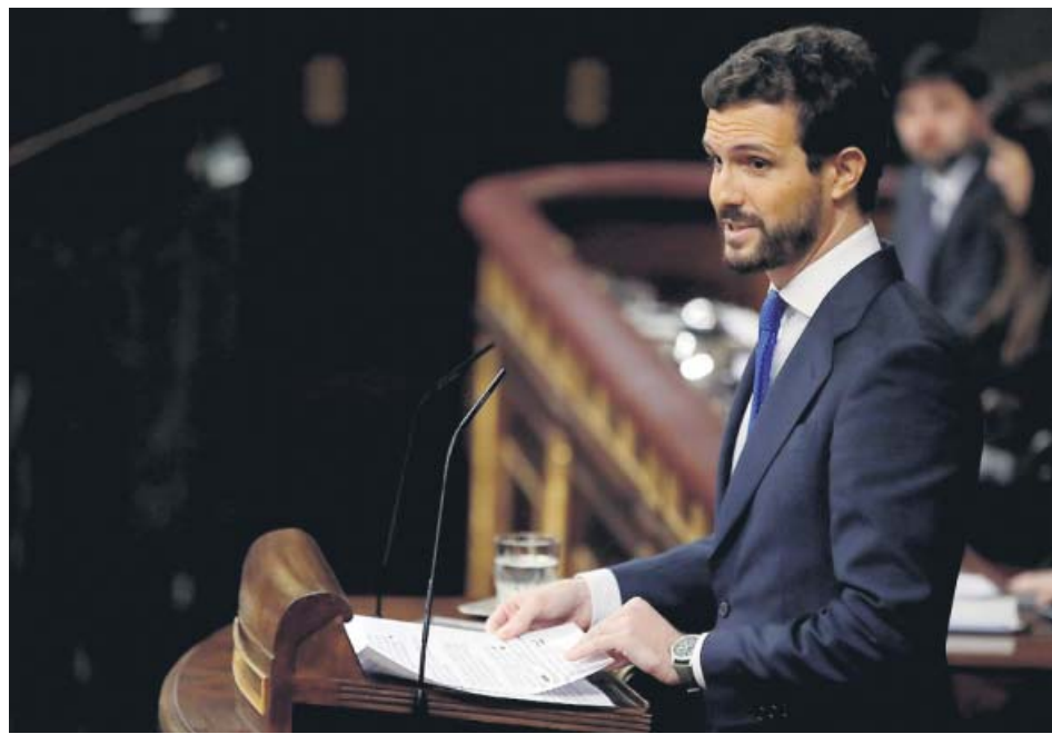
Pablo Casado, ayer durante su discurso desde la tribuna de oradores en el Congreso.

Con el retraso a la hora de formar Gobierno, la celebración del primer Consejo de Ministros de la coalición este viernes —la fecha inicialmente prevista— queda asimismo pospuesta. Y se deja en el aire la aprobación de las primeras medidas sociales del nuevo Ejecutivo, entre las cuales se cuenta en las primeras semanas con la subida de las pensiones o la derogación de algún punto concreto de la reforma laboral. Lo que sí tendrá que llevarse a cabo en un plazo máximo de 15 días es la conformación de la mesa de negociación entre el Gobierno central y el catalán que com prometió el PSOE con ERC. ●