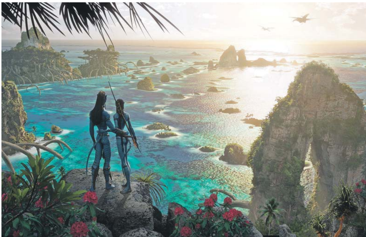
Una de las nuevas ilustraciones de las secuelas de Avatar , todas ellas inspiradas en paisajes playeros. DYLAN COLE / FOX

Lee este y otros reportajes, así como entrevistas y noticias sobre cultura en nuestra web 20minutos.es