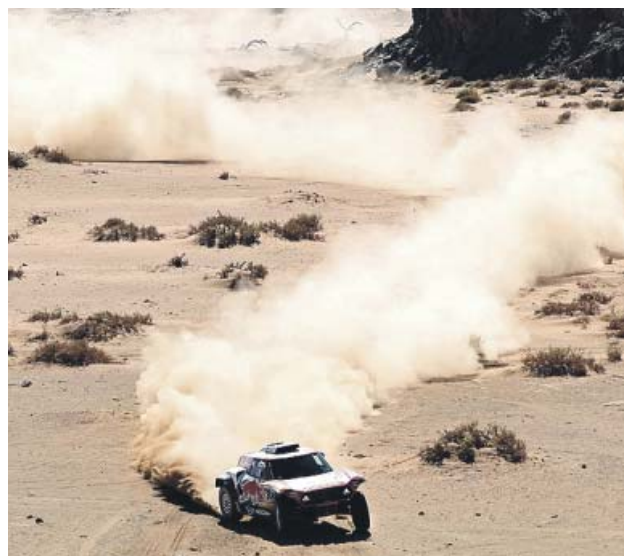
Sainz, en plena etapa.

El piloto madrileño ganó la etapa mientras Alonso acabó en la quinta plaza, pero una sanción le dejó cuarto