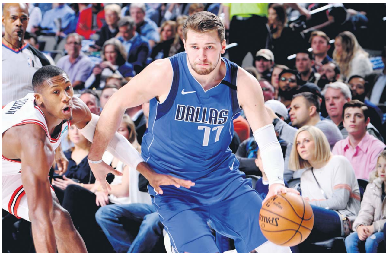
Doncic entra a canasta ante la oposición de un rival.

El equipo de Fórmula 1 Red Bull anunció ayer la renovación del contrato del piloto Max Verstappen hasta finales de 2023. El holandés amplía su contrato tres años más, pues el anterior finalizaba a finales de 2020, y acalla los rumores que lo colocaban en otras escuderías. «Red Bull creyó en mí y me dio la oportunidad de empezar en la Fórmula 1, algo por lo que siempre he estado muy agradecido».