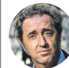
PAOLO SORRENTINO Director de The New Pope

«Es difícil creer en Dios, pero me gusta mucho cómo los católicos cuentan la historia, es un buen guion»