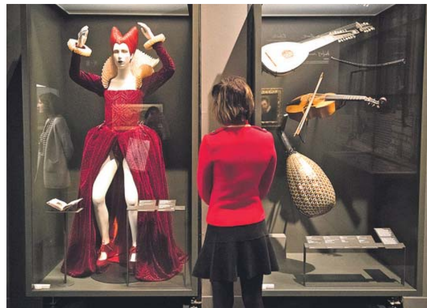
Una mujer en la exposición Ópera. Pasión, poder y política en CaixaForum Madrid.