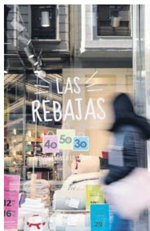
Un escarapate en València, ayer.

La patronal valenciana del comercio, Confecomerc CV, espera que las ventas en rebajas crezcan un 3,5% y reclama un cambio de la normativa de la campaña, que comenzó ayer, ya que está «condenada» tras su liberalización. Confecomerc hizo ayer esta previsión tras unas Navidades que se han cerrado con cifras positivas respecto al año pasado y una temporada marcada por una climatología excesivamente cálida, «que no ha favorecido el impulso de la campaña, y por la continua proliferación de descuentos y promociones como el Black Friday, basadas exclusi-