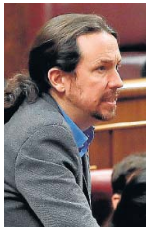
El líder de Unidas Podemos, Pablo Iglesias.

En su breve intervención antes de la votación de investidura, Iglesias fue muy crítico con las posiciones defendidas por PP y Vox durante el deba-