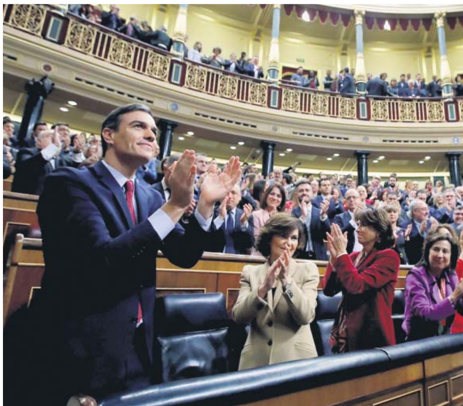
Pedro Sánchez, aplaudido por el grupo socialista tras ganar la votación de investidura.

La tercera y última jornada del debate de investidura fue algo menos bronca que las del sábado y el domingo pasados tan solo porque tanto el candidato como los portavoces de los grupos tuvieron apenas unos minutos (cinco estos últimos y diez Sánchez) para intervenir. Y aún así, desde la tribuna los partidos que votaron en contra —PP, Vox, Cs, JxCat, UPN, CUP, PRC, Foro y Coalición Canaria— volvieron a ser muy duros contra un Sánchez al que acusaron