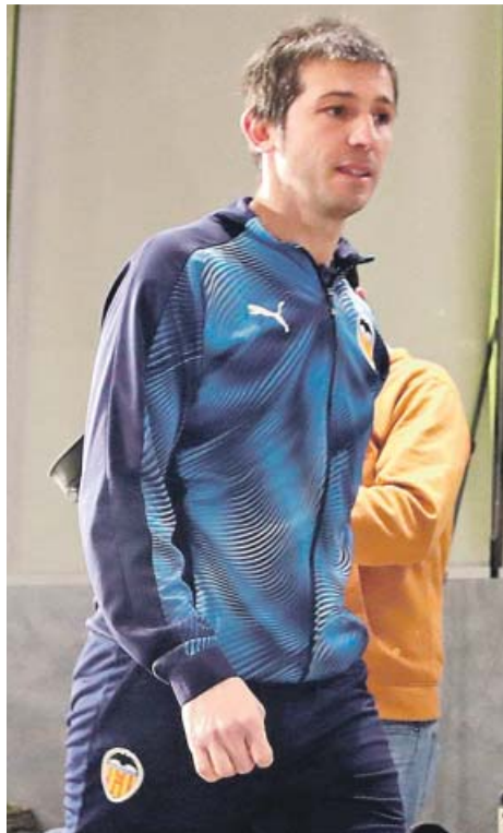
Albert Celades en rueda de prensa y Zinedine Zidane en el entrenamiento de ayer en Arabia.

No podrá ejercer el gallo de salvador en esta ocasión, pues