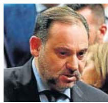
JOSÉ LUIS ÁBALOS

La ministra de Hacienda podría añadir el cargo de portavoz del Gobierno.