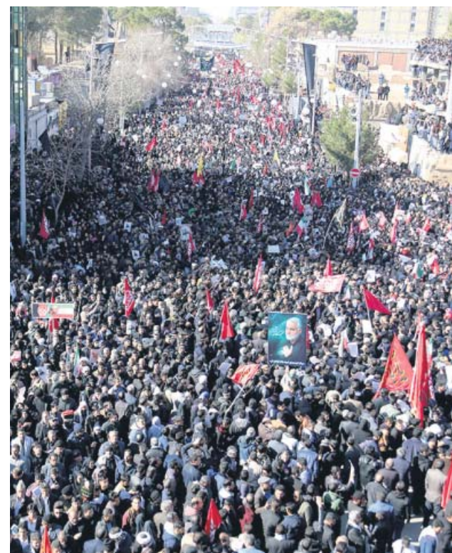
Funeral de Soleimani, ayer, en la ciudad de Kermán.

Las protestas contra EE UU se extendieron, incluso, a otros