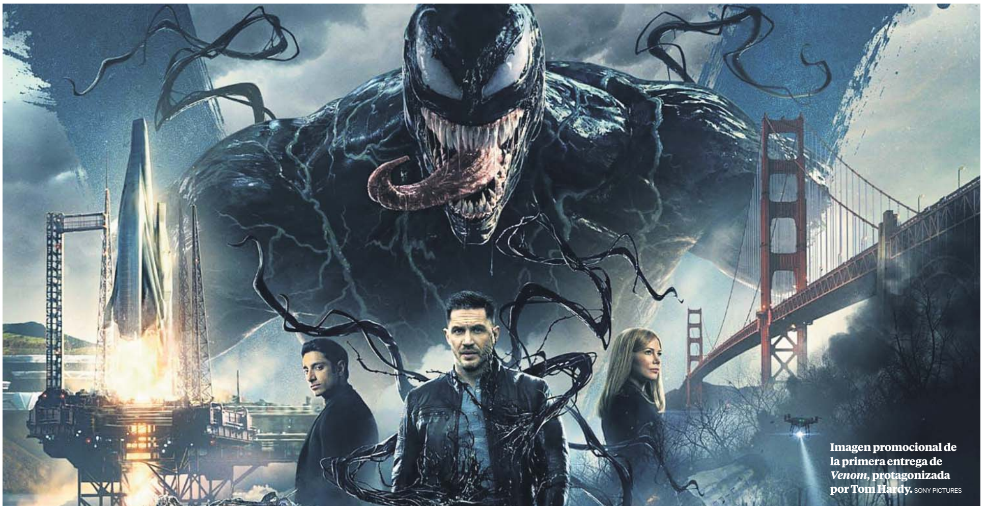
Imagen promocional de la primera entrega de Venom , protagonizada por Tom Hardy.