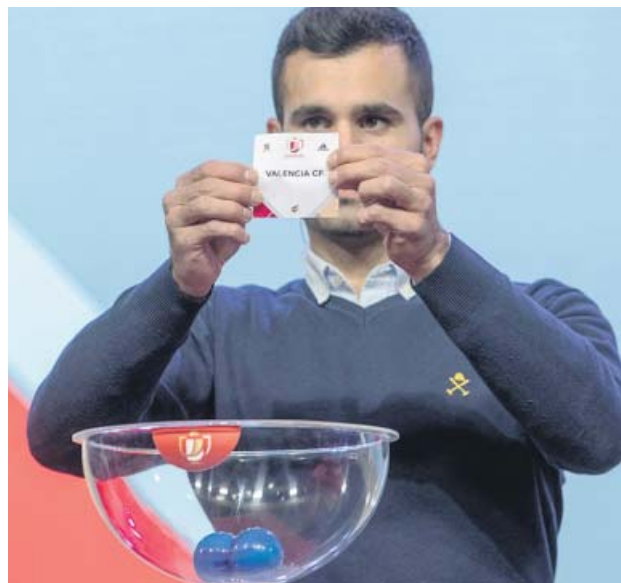
Momento en el que salió la bola del Valencia del bombo.

Muchísima peor suerte tuvo el Levante. Hay solamente dos emparejamientos entre equipos de la máxima categoría en estos dieciseisavos, y uno de ellos le ha tocado a los de Paco López, que no solo jugarán ante todo un Sevilla sino que, además, lo harán en el Sánchez Pizjuán. Sin duda, el peor escenario posible.