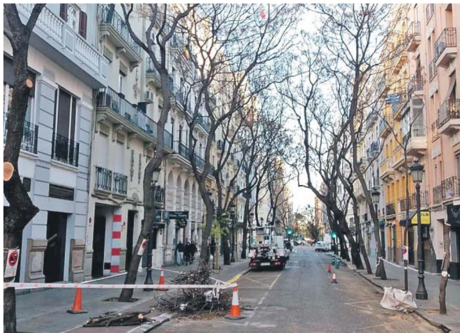
Algunos árboles están inclinados hacia el centro, lo que provoca roturas cuando hay viento.

La segunda fase de las obras de reurbanización de la calle Murta, en Benimaclet, ha comenzado esta semana. Con 246.143 euros de inversión, los trabajos permitirán ampliar el ancho de las aceras.