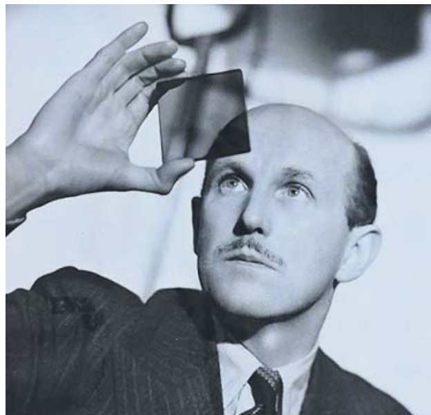
El director de cine Michael Powell.

Irlanda ha dado grandes escritores durante los últimos cinco siglos: Swift, Sterne, Yeats, Joyce, Heaney. Hay una frase que para describir la India, su enigma, su misterio ancestral nos dice que la India es como mil Irlandas. Algo de todo esto me ronda tras leer una fabulosa novela sobre Irlanda, o por ser más preciso, sobre una familia irlandesa. La novela no es muy antigua, casi de ayer mismo, A Waiting Game (1975), de Michael Powell, un director de cine inglés