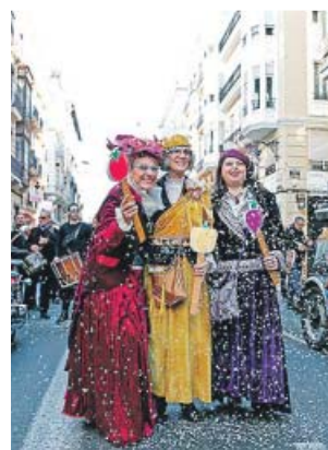
Las tres protagonistas, durante el desfile.

Estos hechos han generado diversas reacciones entre los partidos políticos valencianos: