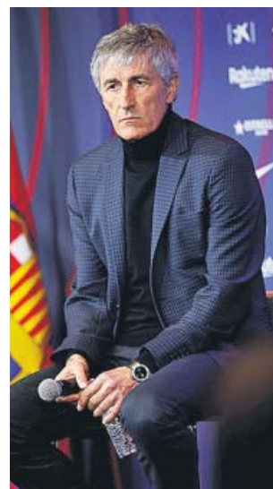
Setién, en su presentación como técnico del Barça.

«Ni en mis mejores sueños hubiera podido imaginar estar aquí», admitió un Setién visiblemente emocionado en su presentación. Después, sor-