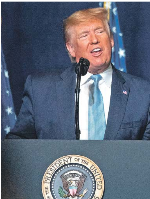
A la izquierda, el primer ministro británico, Boris Johnson. A la derecha, el presidente de Estados Unidos, Donald Trump.