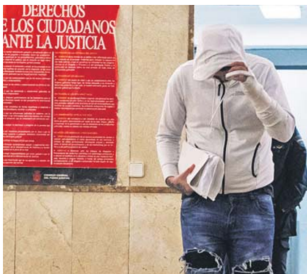
Uno de los jóvenes detenidos por la violación grupal.