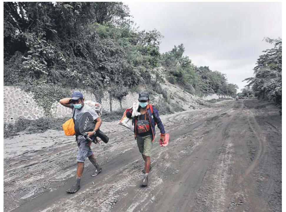
Dos ciudadanos filipinos caminan por las inmediaciones del volcán Taal.