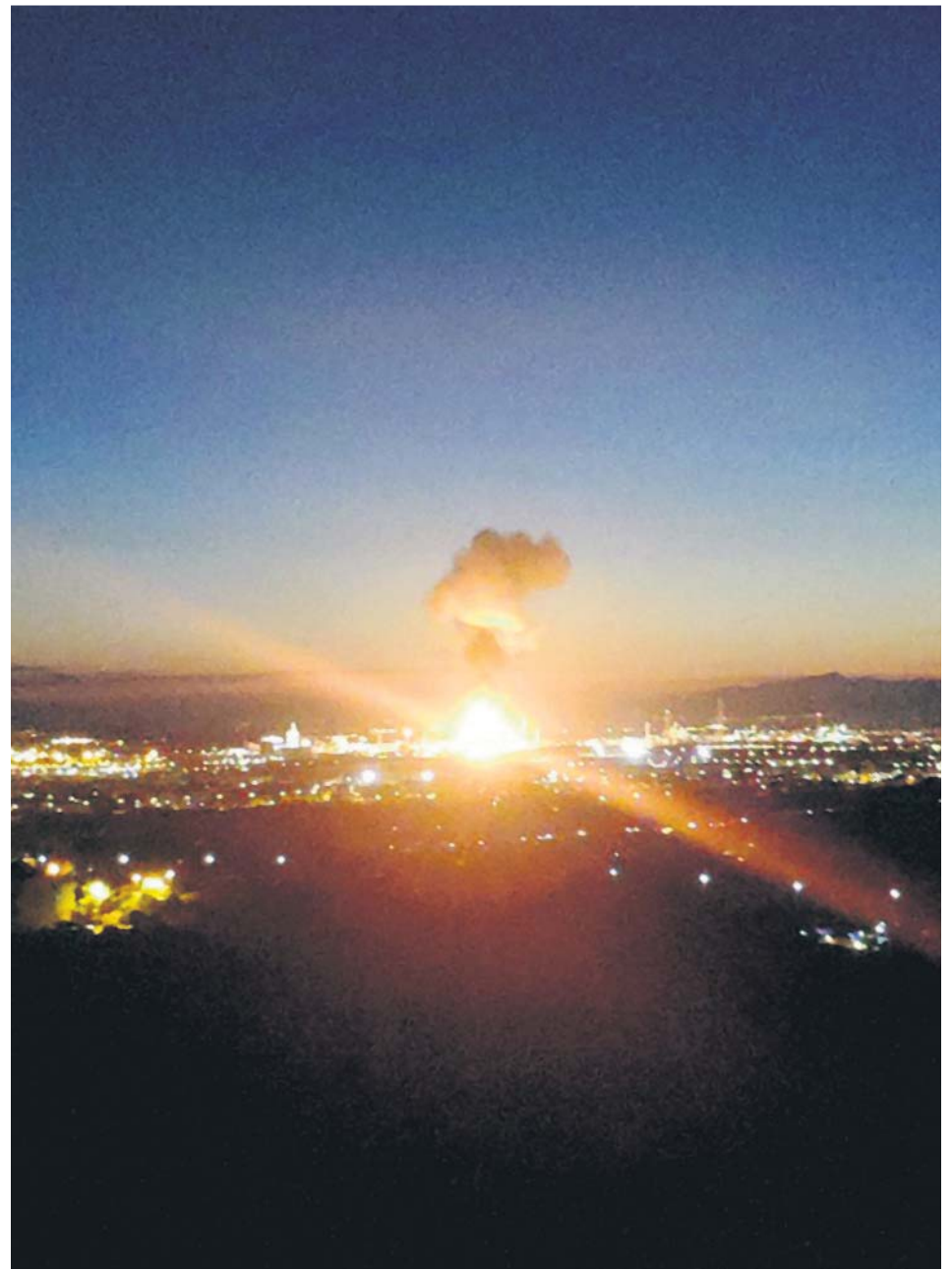
Explosión de la planta química, instantes después del accidente.

La Generalitat activó el Plan de Emergencia Exterior del Sector Químico de Cataluña (Pla-seqcat) y Protección Civil pidió a la población de los barrios más cercanos de Tarragona y de las localidades de Vila-seca y La Canonja que permaneciera confinada en sus casas, cerrando puertas y ventanas. En estos dos últimos municipios llegaron a sonar, con bastante retraso, las sirenas de emergencia para alertar a la población del accidente, pero no en Tarragona, algo que denunciaron muchos vecinos, asustados al ver desde sus casas el fuego y la gran columna de humo.