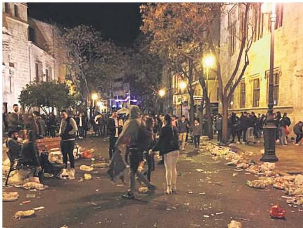
El entorno de la Lonja, tras una verbenas en las Fallas de 2019.

El Ayuntamiento lanza una campaña contra las agresiones al patrimonio, que cuestan 100.000 euros al año