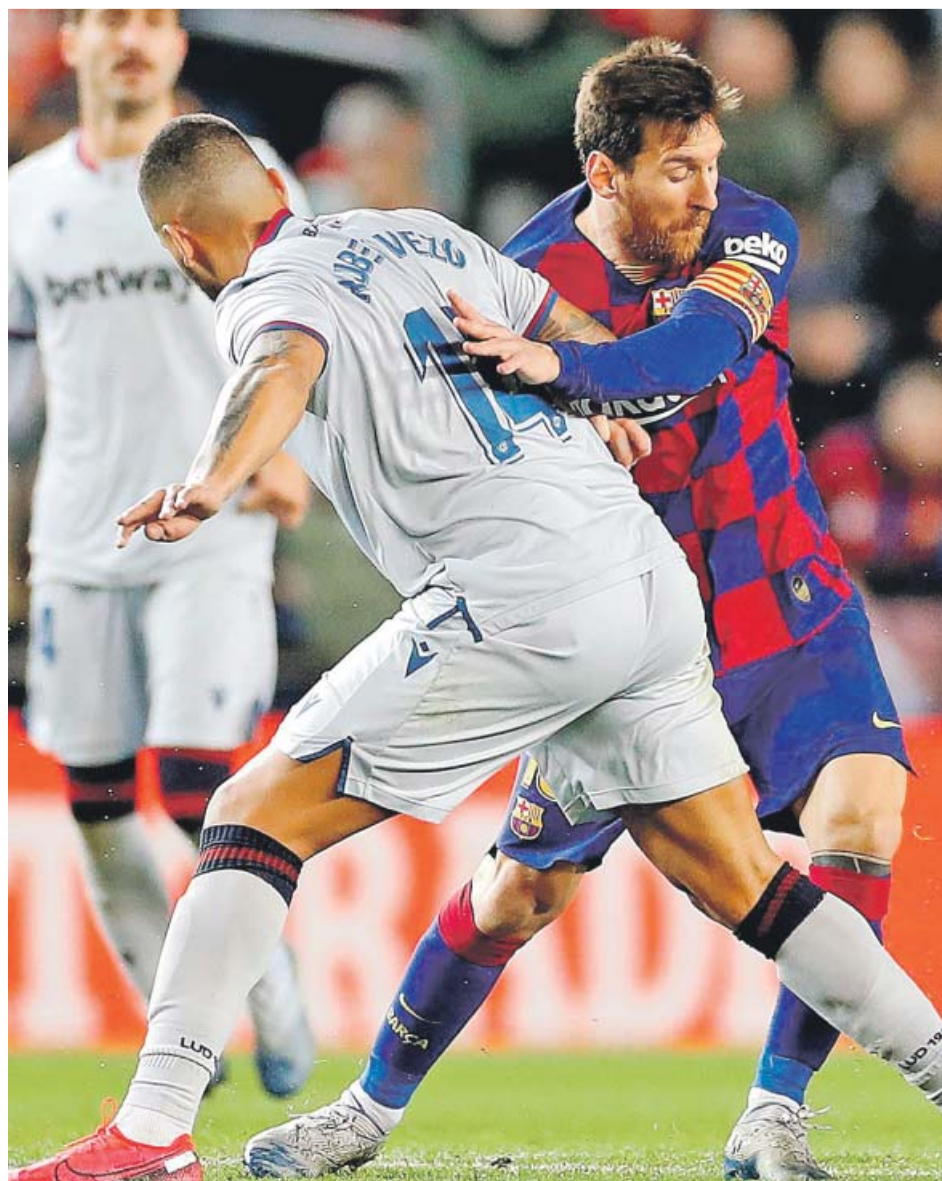
Rubén Vejo frena a Leo Messi en el Camp Nou.

Messi y Ansu, y viceversa, era la mejor opción local. El joven de 17 años dio al argentino las primeras ocasiones, topando en lo que sería una noche frustrada por Aitor Fer-