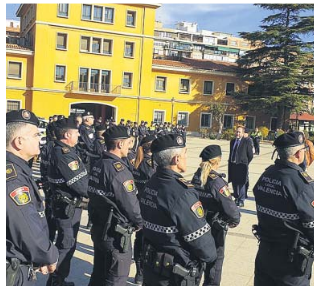
La Policía Local, entre las más mermadas por las jubilaciones.

No obstante, de ese total, apenas se han incorporado hasta este momento 217, es decir, el 20,9%, por lo que todavía existe un amplio margen de crecimiento de la actual plantilla. Un ejemplo lo constituyen los 30 policías locales de 2016, que se acaban de incorporar, pero no así los 40 que aprobaron la oposición en 2017 y que actualmen-