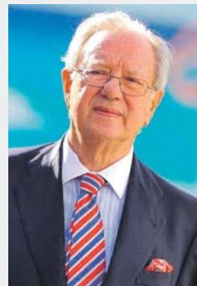
Raúl Morodo Embajador de España en Venezuela

Aterrizó en España teniendo prohibida la entrada en todo el territorio de la Unión Europea. En Madrid estuvo reunida con Ábalos como vicepresidenta del Gobierno chavista de Nicolás Maduro.