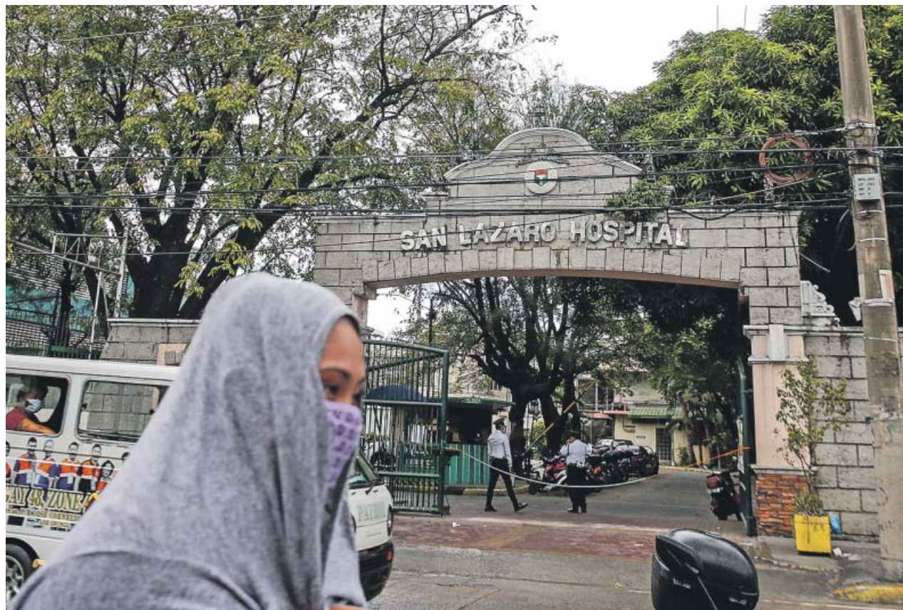
Una mujer pasa por delante del Hospital San Lázaro, en Filipinas, donde ha muerto una persona por el coronavirus.

«Hay una cierta preocupación en la población y se están llegando a tener ciertas actitudes un tanto discriminatorias contra personas provenientes de China», declaró ayer el director del Centro de Coordinación de Alertas y Emergencias Sanitarias del Ministerio de Sanidad, Fernando Simón. «No se tiene que considerar a cualquier persona de origen asiático un caso sospechoso».