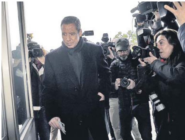
Eduardo Zaplana, llegando al juzgado en 2019.

El expresidente recibió 2,3 millones de su testaferro, según la UCO, tras los amaños en las ITV y en el Plan Eólico valenciano