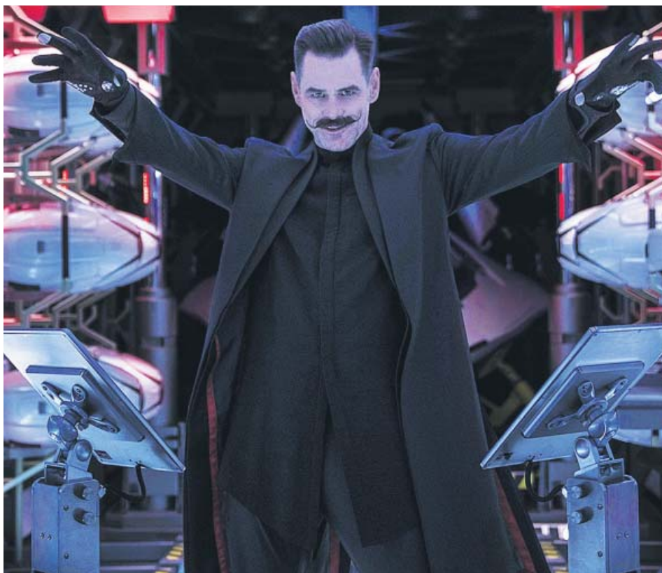
El actor Jim Carrey caracterizado como el malvado Dr. Robotnik en Sonic: La película .

¿Qué ha sido de los grandes cómicos del cine y la televisión en los 80 y 90? Pues la mayoría de ellos sigue en activo y con próximos estrenos a la vista