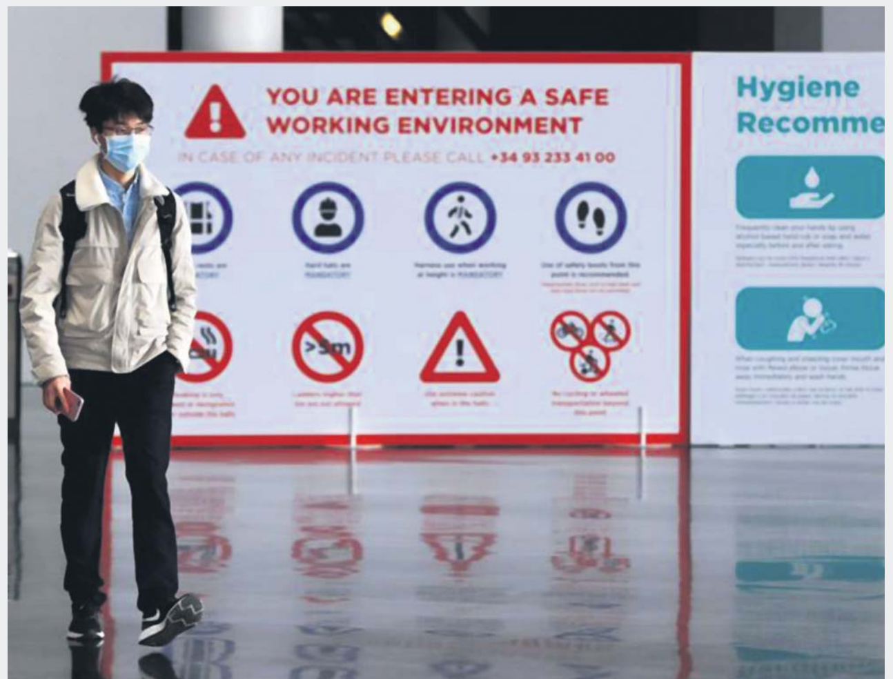
Un operario, protegido por la mascarilla, abandona las instalaciones del Mobile World Congress.

LOS NUEVOS LIBROS CON NOMBRE DE MUJER / PÁG. 12