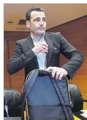
Costa compareció ayer en la comisión de Les Corts.

En el ámbito de la producción, pretende que «la propia siga encabezando el proyecto», pero reforzando la colabora-