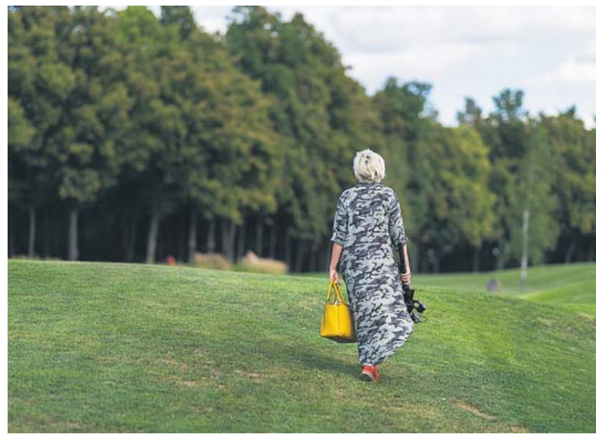
Una mujer mayor pasea por una zona verde próxima a su hogar.

Mientras que Marc Masip, psicólogo y experto en adicción a las nuevas tecnologías, opina lo contrario y asegura que la normativa «es acertada y mejoraría el rendimiento académico de los alumnos». Y añade: «Ojalá se replique en el resto de comunidades autónomas». Masip apuesta incluso por una ley a nivel estatal, que cree que «está al caer». Asimismo, destaca que es necesaria «una formación y con-