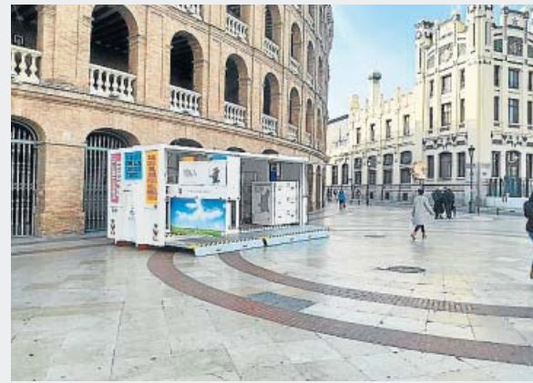
Ecoparque móvil instalado en la calle Xàtiva de València.

visitas recibieron las instalaciones móviles de reciclaje de la Emtre durante el pasado mes de enero.