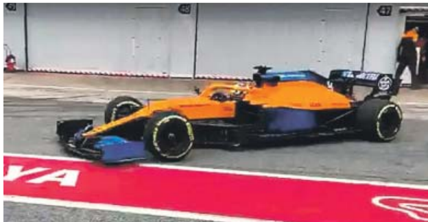
El McLaren MCL35 sale de boxes en Montmeló.

El nuevo monopla MCL35 de la escudería británica completó ayer sus primeros kilómetros en el circuito de Montmeló para preparar los test de pretemporada