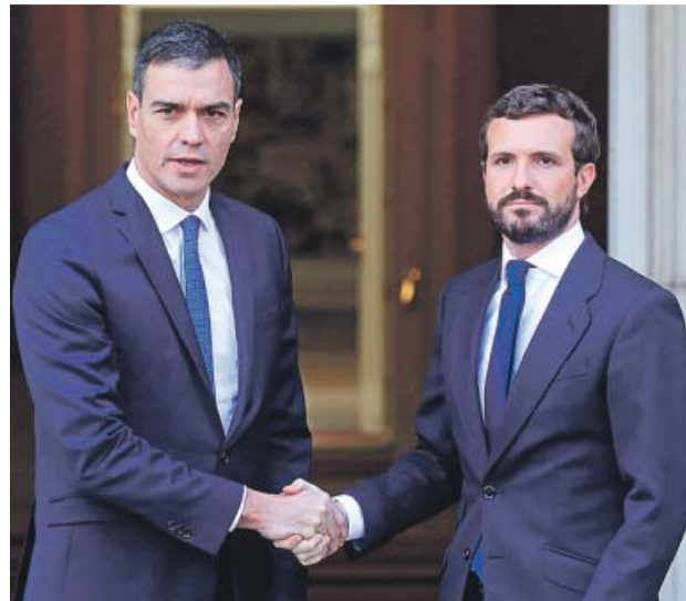
Sánchez y Casado, en Moncloa el pasado octubre.

El vicesecretario de Comunicación del PP, Pablo Montesinos, recriminó ayer a Sánchez que dijese que quiere «tender puentes y a renglón seguido se dedique a insultar al PP». Al PP le queda claro que la intención de que Sánchez vuelva a la «centralidad» y a la «moderación» no va a ser posible. El jueves pasado, el PP dijo que Casado así se lo pediría hoy. Ayer, Montesinos señaló que «los españoles pudieron comprobar que Sánchez no tiene ninguna intención de volver a la moderación porque está encantado de que sus aliados sean el señor Torra, el señor Junqueras y el señor Rufián». El PP mantiene que Sánchez basa «en la mentira» su diálogo con los independentistas y exige que vuelva al «eje constitucionalista». El Gobierno quiere