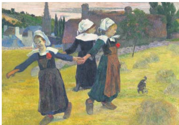
Breton Girls Dancing, Pont-Aven (1888), de Gauguin. NATIONAL GALLERY

Esta es la gran historia que se cuenta en el documental Gauguin en Tahití. Paraíso perdido , que se proyectará hoy y mañana en 90 salas de toda España dentro del ciclo Los Grandes del Arte en el Cine (más información en