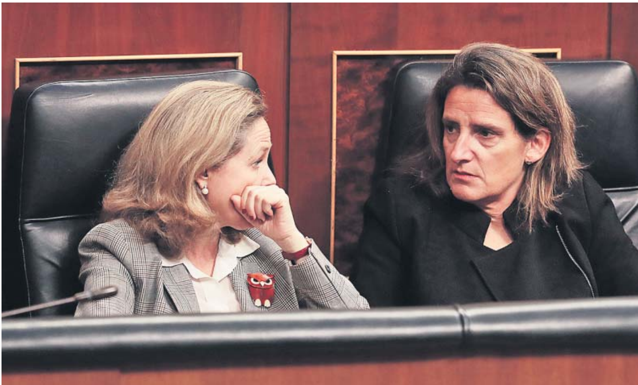
Las vicepresidentas de Asuntos Económicos y Transición Ecológica, Nadia Calviño y Teresa Ribera, en el Congreso.