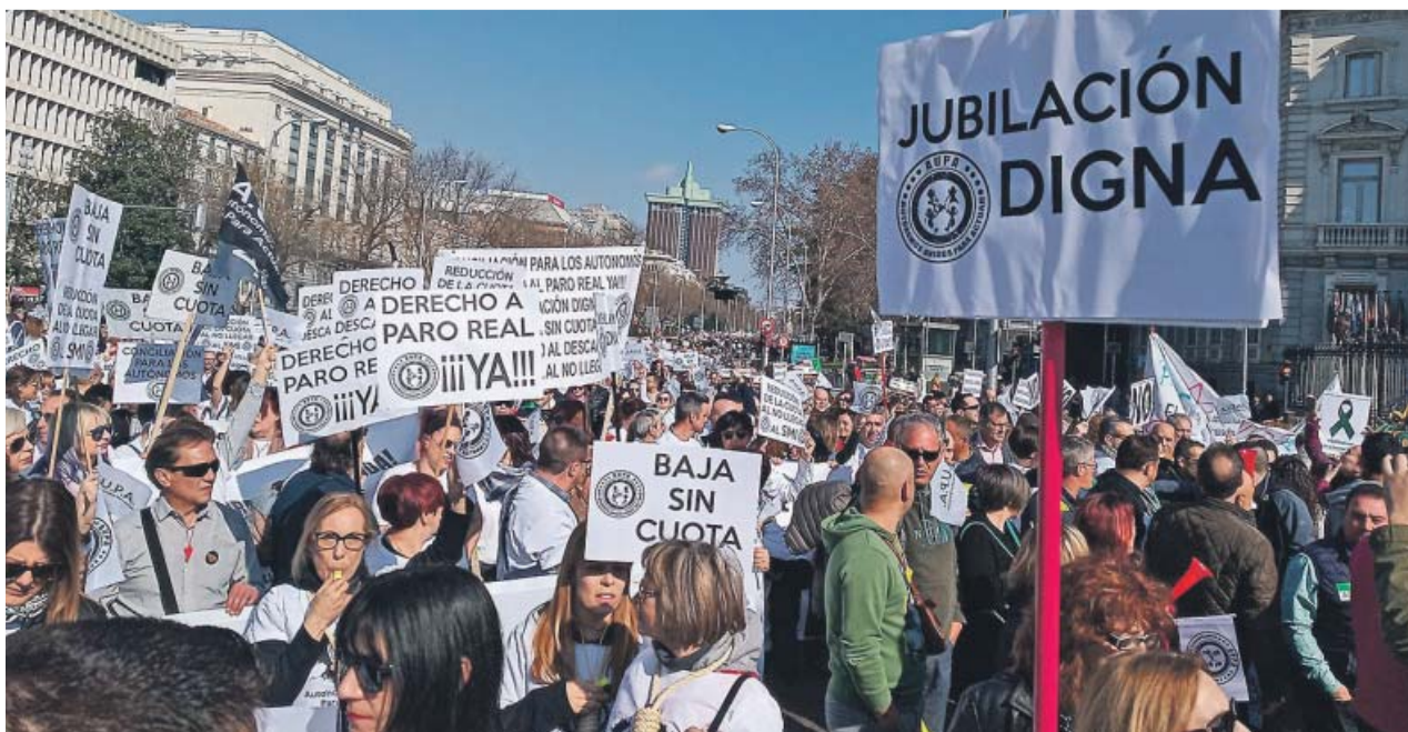
Miles de autónomos marcharon ayer por el centro de Madrid.

No parece que vaya a ocurrir hoy. El tono de los últimos días no anticipa ni la oposición «de» Estado (y no «al» Estado) que busca Sánchez en Casado ni el giro sobre Cataluña que exige el líder popular al presidente. ●