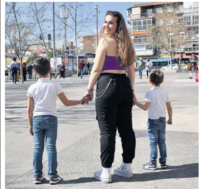
Una canguro, cuidando de niños.

Para consultar las últimas noticias del avance del coronavirus puedes hacerlo en nuestra web 20minutos.es