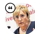
ANA BARCELÓ Consellera de Sanidad Universal y Salud Pública

«La sociedad valenciana está dando verdaderos ejemplos de comportamiento cívico»