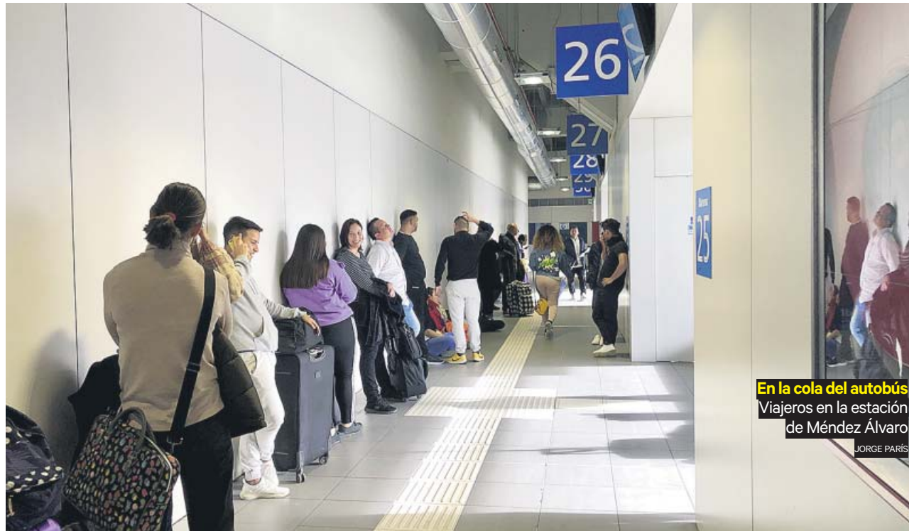
En la cola del autobús Viajeros en la estación de Méndez Álvaro

Los colegios mayores se han mantenido abiertos, salvo el Loyola, que decidió suspender temporalmente su actividad desde ayer durante 15 días, llevando a los 200 universitarios que residen en sus instalaciones a volver a sus casas. ●