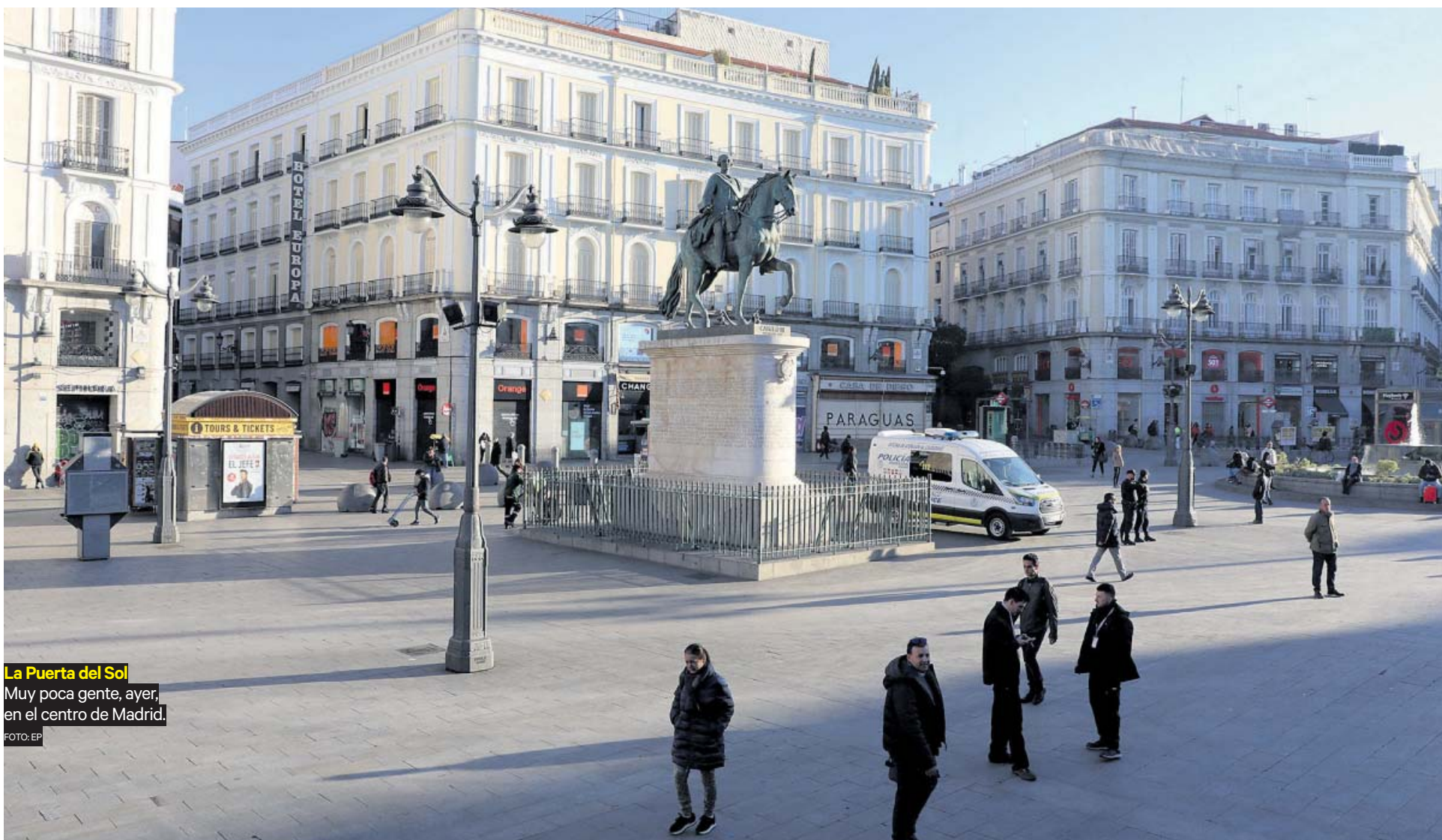
La Puerta del Sol Muy poca gente, ayer, en el centro de Madrid.