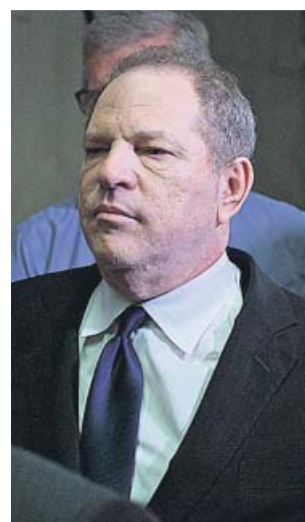
Weinstein, en una imagen de 2018.

Antes de escuchar su sentencia, Weinstein dijo ante el tribunal que estaba «profunda-