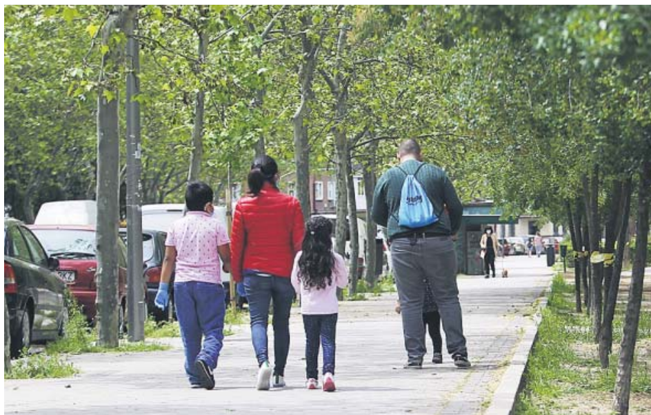
Los niños salen a las calles por segundo día consecutivo.

No obstante, las sanciones por saltarse las normas de salida de menores de 14 años —una vez al día, una hora, acompañados por un adulto y a un máximo de un kilómetro de su casa— fueron anecdóticas. Según indicó el ministro del Interior, las fuerzas de seguridad tramitaron 17.515 propuestas de sanción y detuvieron a 157 personas el domingo —primer día en el que los niños salieron a pasear— lo que supone una cifra similar a la de