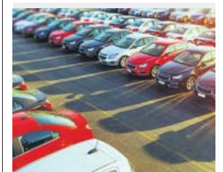
El ritmo de matriculaciones no puede ser más bajo.

La crisis provocada por el coronavirus y el estado de alar-