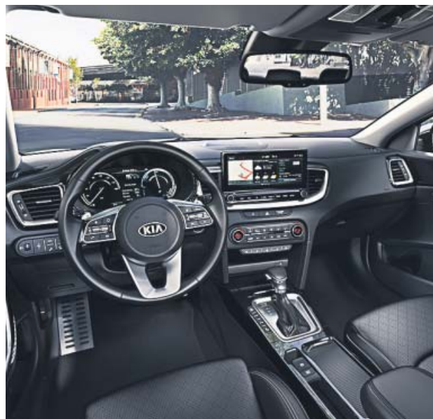
Buenos acabados y diseño atractivo en el amplio interior.

Por dentro, el ambiente es agradable, moderno y amplio. Eso sí, el maletero, por la pre-