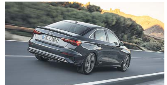
La silueta de tres volúmenes diferencia a esta versión.

En principio el A3 Sedán se comercializará con un motor TFSI de 1,5 litros y 150 caballos