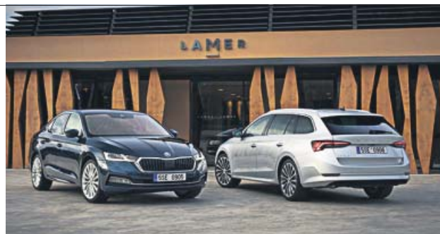
Está disponible en carrocerías berlina y familiar (Combi).

Ya se pueden hacer pedidos de este modelo, el más vendido de Skoda en su historia. Inicialmente se va a comercializar en dos acabados, Ambition y Style, el primero de ellos ya con elementos de equipamiento importantes como faros Led, cuadro de instrumentos digital (Virtual Cockpit), climatizador bizona, sistema multimedia con pantalla de 8 pulgadas, retrovisores abatibles eléctricamente, control de crucero, sistema de mante-