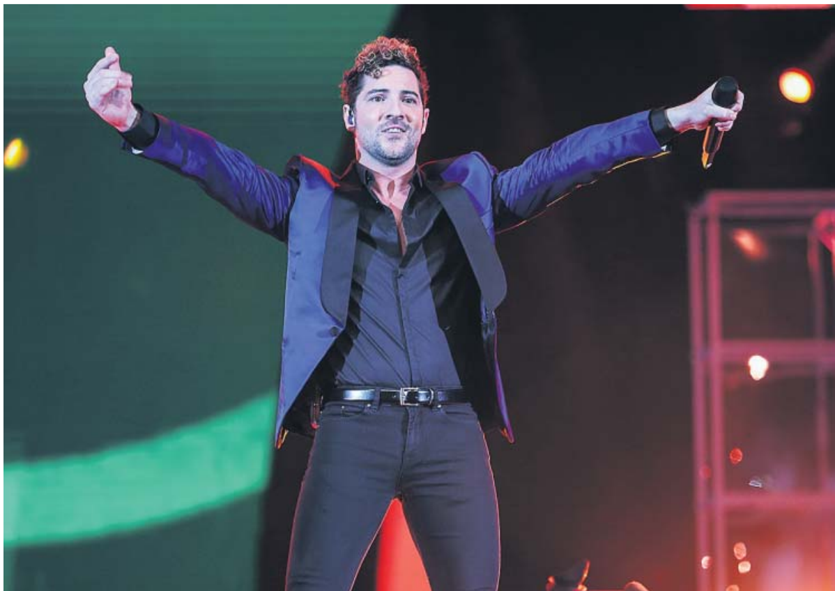
El cantante almeriense David Bisbal, durante una actuación en 2019 en Tenerife.