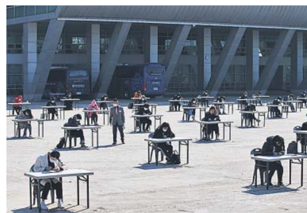
Decenas de estudiantes se examinan en Corea del Sur.

pina, los contagios ascienden a 199.144 y los fallecimientos a 26.977, la segunda cifra de mortalidad más elevada. Con 333 fallecidos en el último día, Italia se prepara para ir retomando paulatinamente la normalidad a partir del próximo 4 de mayo, un proceso que, si todo va como se planea, podría estar completo en junio.