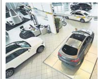
El sector acumula unas pérdidas del 95%.

Esta asociación estima que esta semana será de transición hasta retomar la activi-