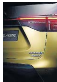
Detalle de la trasera, con la firma 'Hybrid' y de la tracción total inteligente 'AWD-i'.