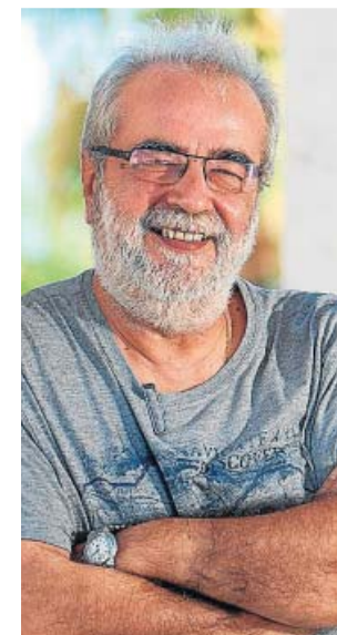
El director del Centro de Educación y Nuevas Tecnologías de la UJI cree que la 'teleeducación' llega para quedarse, aunque con mucho que pulir

La 'teleeducación', que de la noche a la mañana ha obligado a los docentes a que cogiesen sus ordenadores y tabletas y se las apañasen para seguir enseñando a sus pupilos, «llega para quedarse», según considera el director del Centro de Educación y Nuevas