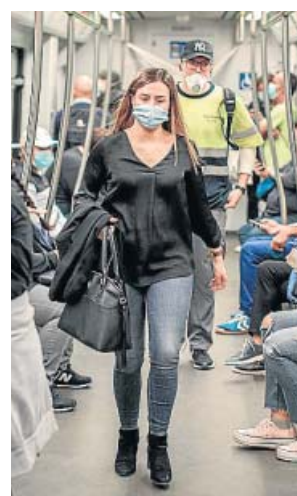
Usuarios del metro de València, con mascarillas.

En cuanto a la cartelería, ya se está trabajando con los proveedores para, a la mayor brevedad posible, colocar vinilos o pegatinas en estaciones e interior de los vagones que indi-