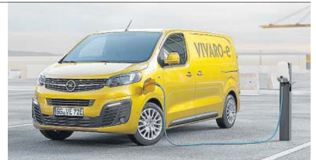
El Vivaro-e puede recorrer hasta 330 kilómetros sin recarga.

Con 136 CV de potencia, se puede elegir entre dos tipos de batería: una de 75 kWh, con una autonomía de hasta 330 kilómetros (según el ciclo de homologación WLTP), y otra de 50 kWh, con la que se es-