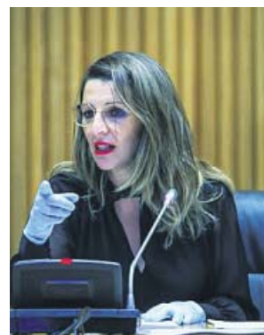
La ministra de Trabajo, Yolanda Díaz.

Precisamente la Confederación Española de Organizaciones Empresariales (CEOE) reclamó ayer que se ponga en marcha esta prórroga de los ERTE, pero además pidió «limitar» la obligación que tienen las empresas de mantener al menos durante seis me-