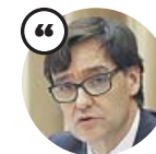
SALVADOR ILLA Ministro de Sanidad

«Es recomendable que los menores salgan a una hora en la que las temperaturas no son tan altas»