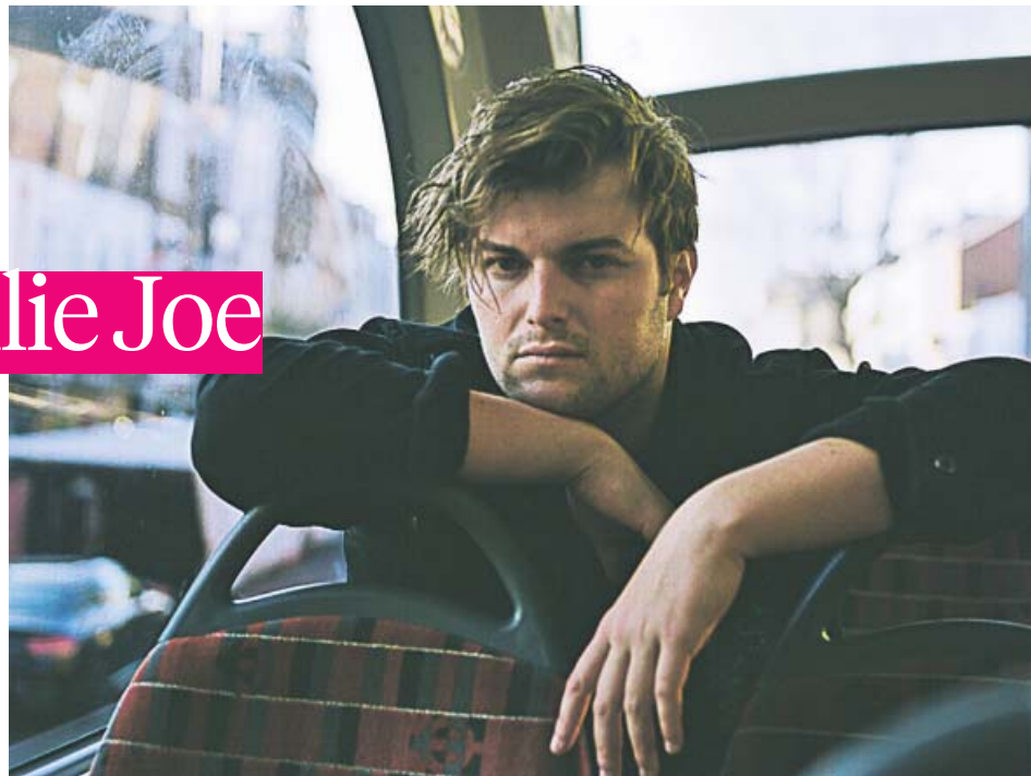
ST WOODS / BE THE ONE

¿Aprendió a tocar la guitarra de forma autodidacta? En su mayoría ha sido Youtube. He dado algunas clases de guitarra, piano y voz, pero, sí, la mayoría es autodidacta. No sé si decir esto queda muy pretencioso... Youtube ha sido su mayor difusor. Hay opiniones muy contrarias sobre lo que internet ha-