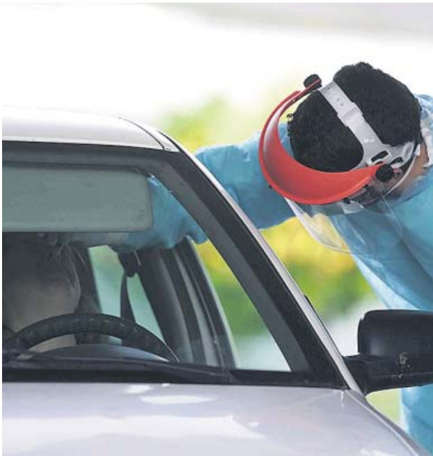
Un sanitario hace una PCR a una persona en Córdoba.

La estrategia de Sanidad para la detección precoz del coronavirus amplía los síntomas requeridos para realizar los test