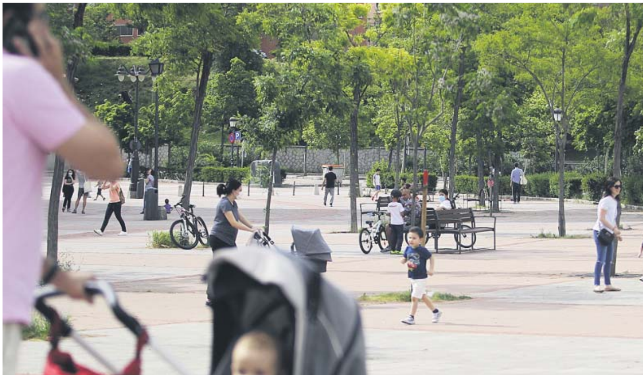
Niños jugando con sus madres y padres, durante la tarde de ayer en una plaza de Madrid.

DANIEL RÍOS danielrios@20minutos.es / @Dany_Rios13