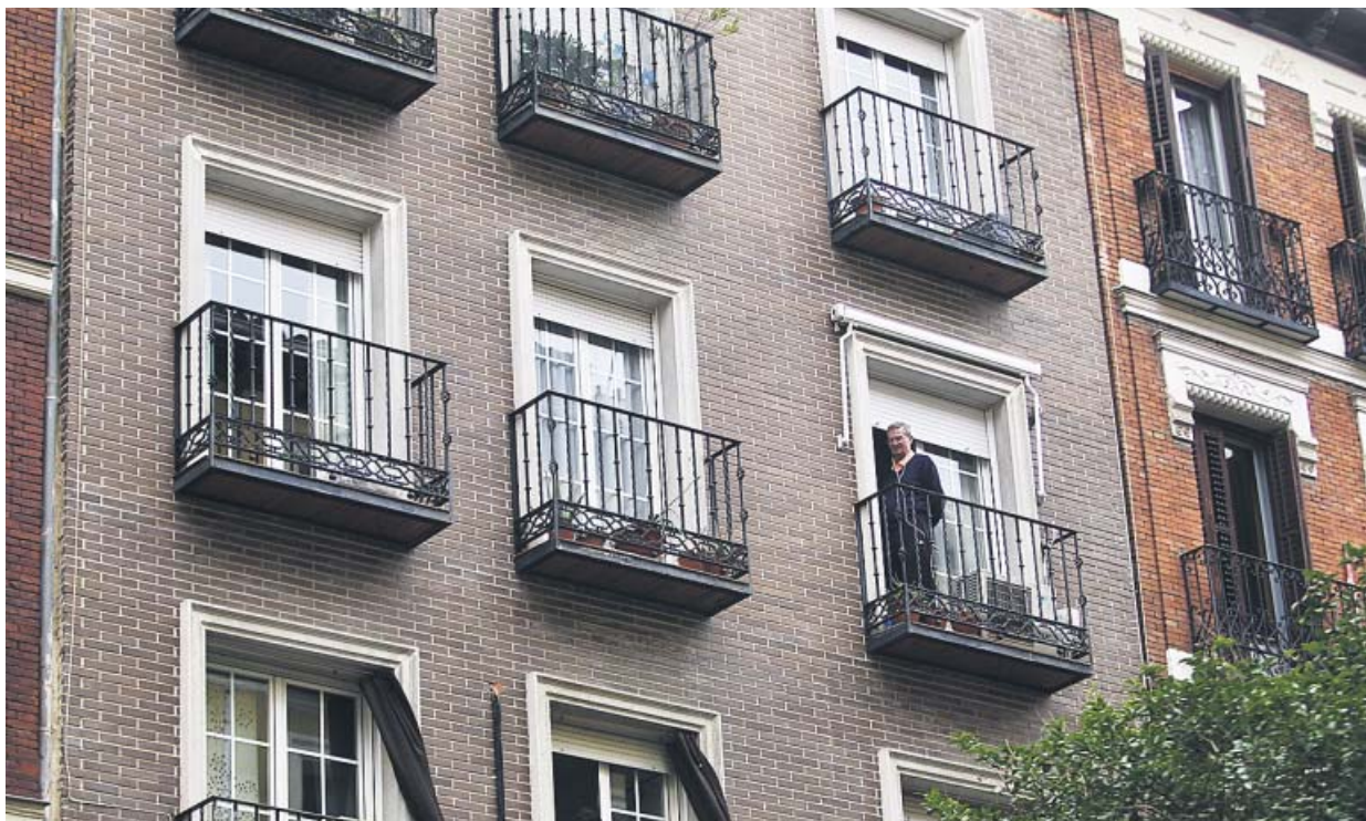
Un hombre asomado al balcón de su vivienda durante el confinamiento.