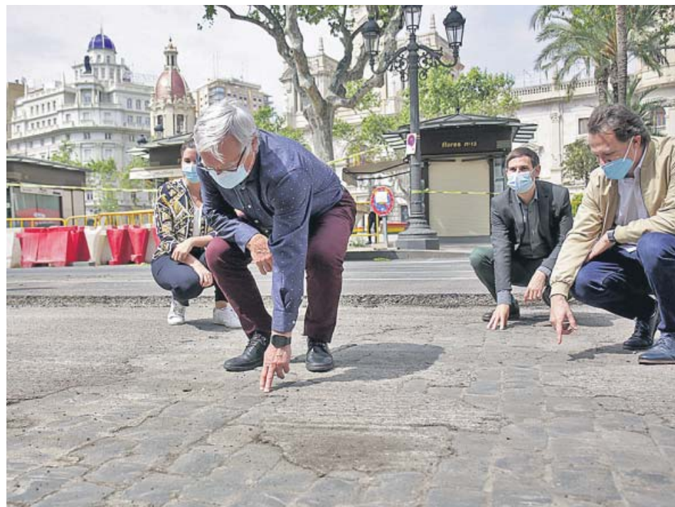
El alcalde Ribó, el pasado lunes, día en el que arrancaron las obras de la plaza.

Después continuaron con el reasfaltado y con la colocación de algunos elementos que formarán parte de la plaza, como grandes maceteros o bolardos que se encargarán de separar el espacio peatonal del carril que han respetado para taxis y una única línea de EMT: la nueva C1-Casco Histórico.