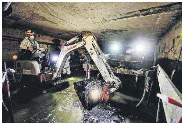
Una imagen de la red de alcantarillado de València.

Puede detectar el virus desde el primer momento en que se mete al cuerpo humano a través de sus secreciones, incluso cuando aún no ha presentado síntomas o es asintomático. Por eso, puede contribuir a diagnosticar de manera temprana la evolución de la enfermedad y adelantarse así a rebrotes, tanto a nivel general «como a nivel de pequeñas poblaciones o, incluso, de barrios», explicó el presidente de