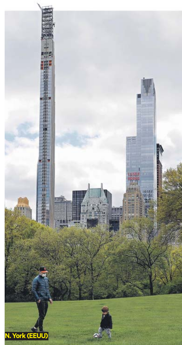
N. York (EEUU)