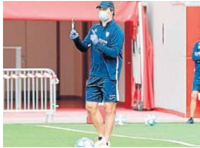
Julen Lopetegui dirigió ayer el segundo entrenamiento del Sevilla