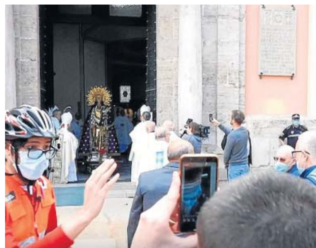
La basílica muestra la Virgen de los Desamparados.

Fuentes del Arzobispado explicaron que la misa se realizó a puerta cerrada sin fieles y que, al terminar, se abrió la puerta para que la imagen peregrina se pudiera ver desde la calle «ape-