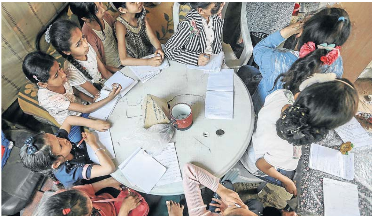
Un grupo de niñas atiende durante una clase voluntaria en Al-Mughraqa, donde las escuelas están cerradas.

altas sanitarias se han producido desde que se originara la crisis.