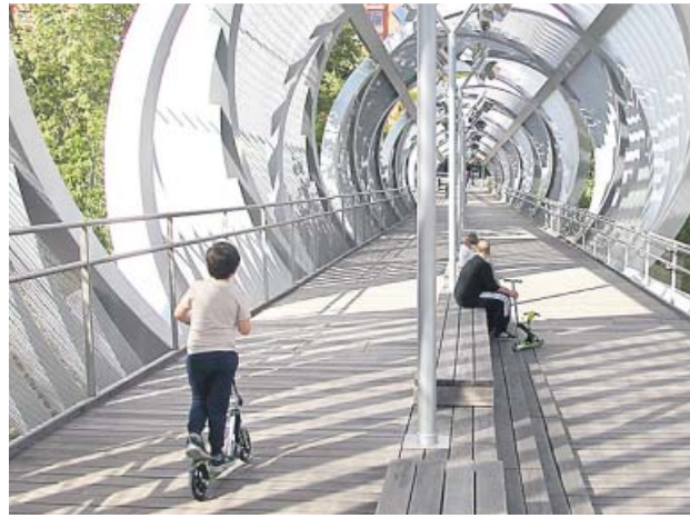
Un niño monta en su patinete durante el desconfiamento.

Si se retrocede más atrás en el tiempo y se observa lo ocurri-