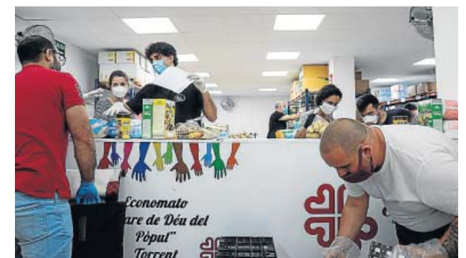
Un momento del reparto de víveres.