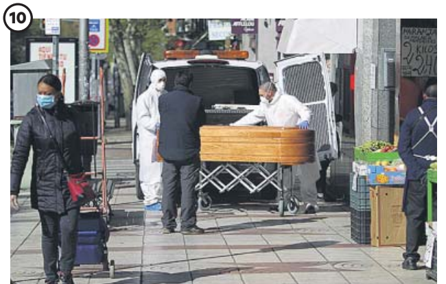
10 FALLECIDOS. Los servicios funerarios se desbordaron En el momento de mayor mortalidad –el pico en un solo día se alcanzó el 2 de abril, cuando se notificaron 950 fallecimientos– se habilitaron morgues en distintos edificios en Madrid y Barcelona.