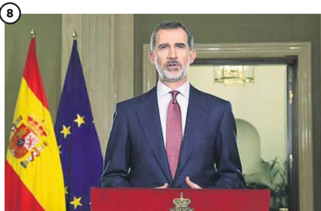
8 ESTADO. Mensaje de unidad a los españoles El 18 de marzo, el rey Felipe VI compareció por primera vez en un discurso en el que llamó a «dejar de lado nuestras diferencias» y que fue respondido con una cecerolada desde algunos balcones.