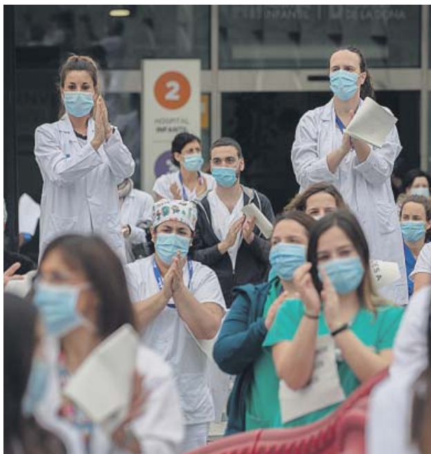
Enfermeras aplauden a las puertas de un hospital de Barcelona.

Desde el sindicato Satse apelan a la conciencia de las autoridades para que aprendan de los fallos y no se repitan