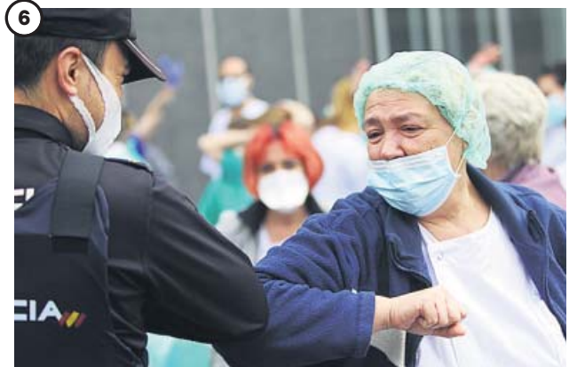
6 PROTECCIÓN. La primera línea contra el coronavirus Los trabajadores sanitarios han sido el sector más expuesto de la sociedad al contagio mientras trataban de ayudar a los enfermos. Cerca del 20% de casos identificados son profesionales sanitarios.