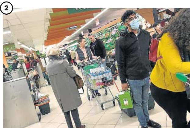
2 ACOPIO. Colas y estantes vacíos en los supermercados. Ante los rumores sobre un posible confinamiento, miles de personas acudieron a los supermercados a hacer acopio de bienes básicos. El papel higiénico fue uno de los productos más demandados.