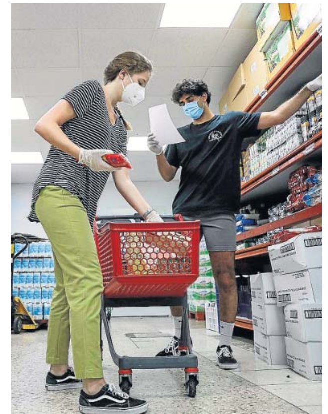
Algunos de los productos de primera necesidad disponibles.

frente de familias monoparentales. Pero ese perfil ha dejado paso en las últimas semanas a otro muy diferente. Quienes acuden ahora a los bancos de alimentos o a los economatos solidarios como el de Cáritas en Torrent son trabajadores muy jóvenes que se han quedado sin trabajo y que ni siquiera tienen derecho a paro por carecer del tiempo suficiente cotizado para percibir esta prestación por desempleo. Además, Cáritas atiende también estos días a mayores que viven solos y a migrantes en situación irregular que vivían de la economía sumergida. ● R. V.