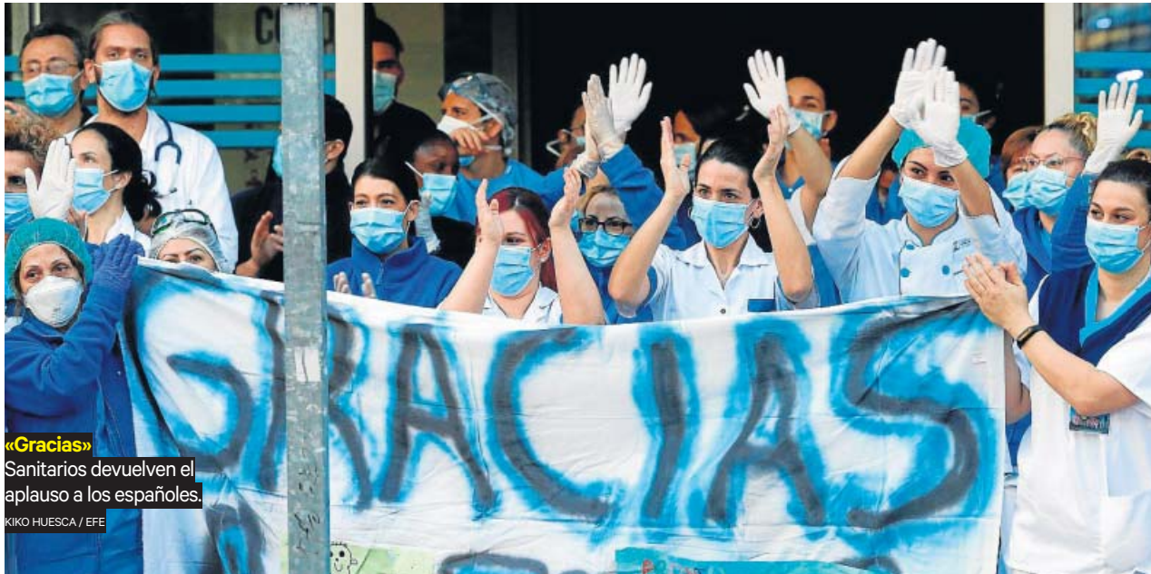
«Gracias» Sanitarios devuelven el aplauso a los españoles.

Coronavirus, febrícula, curva, desescalada... la emergencia sanitaria ha cambiado nuestra forma de hablar y ha descubierto unos cuantos candidatos a vocablo del año