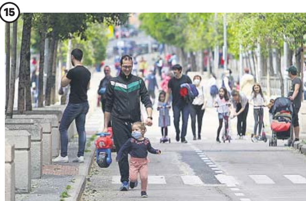
15 ALIVIO. Primero, los niños y, después, paseos y ejercicio A finales de abril comenzaron a relajarse las restricciones. El día 26 salieron por primera vez los niños y el 4 de mayo reabrió el pequeño comercio y se permitieron los paseos y el ejercicio individual.