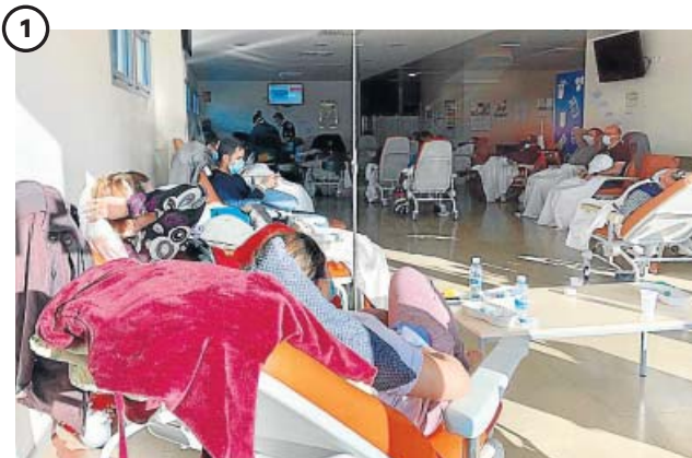
1 URGENCIAS. Los hospitales empiezan a desbordarse. La semana previa a la declaración del estado de emergencia, las urgencias de los hospitales de Madrid y Barcelona empezaron a saturarse, obligando a buscar hueco para más camas en los pasillos.