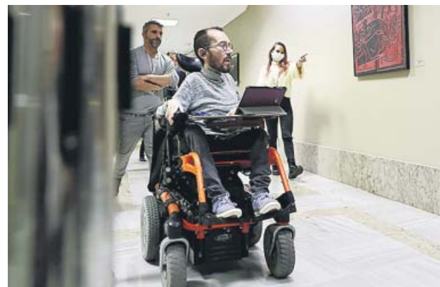
El portavoz de Unidas Podemos, Pablo Echenique. EFE

Ese tipo del 2% solo se aplicaría a patrimonios superiores al millón de euros, pero inferiores a los 10 millones. Para quienes tengan bienes con un valor superior a esta cantidad, el tipo aplicable sería del 2,5%. Y aumentaría hasta el 3% si el patrimonio es de más de 50 millones de euros y a un 3,5% en el caso de los patrimonios de 100 millones de euros o más. Las co-