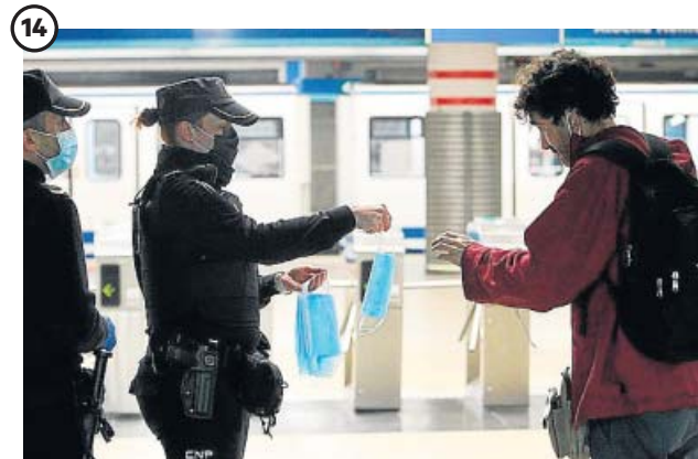
14 MASCARILLAS. Uso obligatorio en el transporte público. Tras la hibernación, el Gobierno optó por repartir mascarillas en el transporte público para fomentar su uso, que se hizo obligatorio en metros, trenes, autobuses y taxis desde el pasado 4 de mayo.