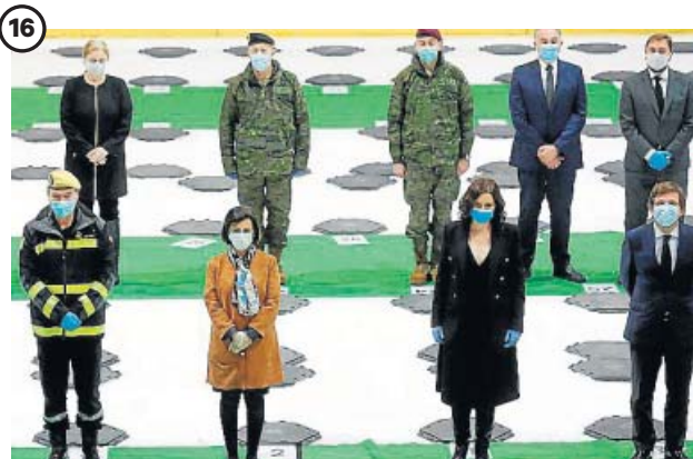
16 HOMENAJE Y LUTO. Minuto de silencio por los fallecidos El Palacio de Hielo, en Madrid, cerró el 22 de abril sus puertas como morgue, tras un mes en el que acogió a 1.146 fallecidos, con un acto de homenaje en el lugar donde se habían ubicado los ataúdes.