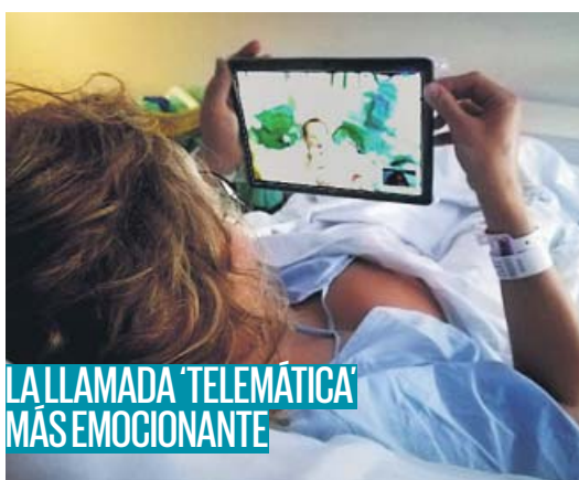
LA LLAMADA 'TELEMÁTICA' MÁS EMOCIONANTE

Prohibidas las rebajas en tiendas para evitar multitudes