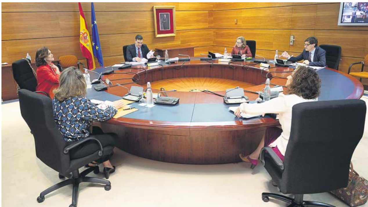
El Consejo de Ministros, reunido ayer, con parte de sus miembros participando de forma telemática.

HASTA AHORA defendía las prórrogas de 15 días para «rendir cuentas» ante el Congreso cada dos semanas