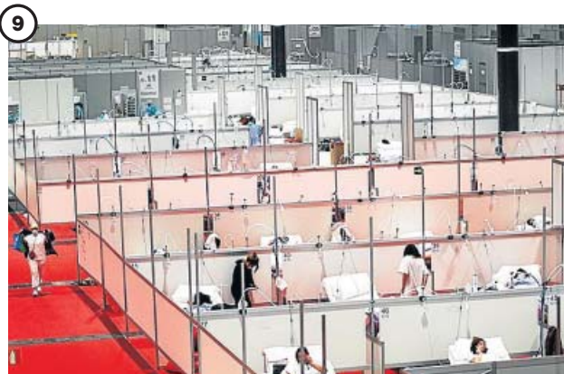
9 IFEMA. Un macrohospital improvisado en Madrid Ante el aumento de presión sobre los servicios sanitarios en la capital, se habilitaron varios pabellones de la feria de Madrid, por donde pasaron 3.800 pacientes entre el 22 de marzo y el 1 de mayo.