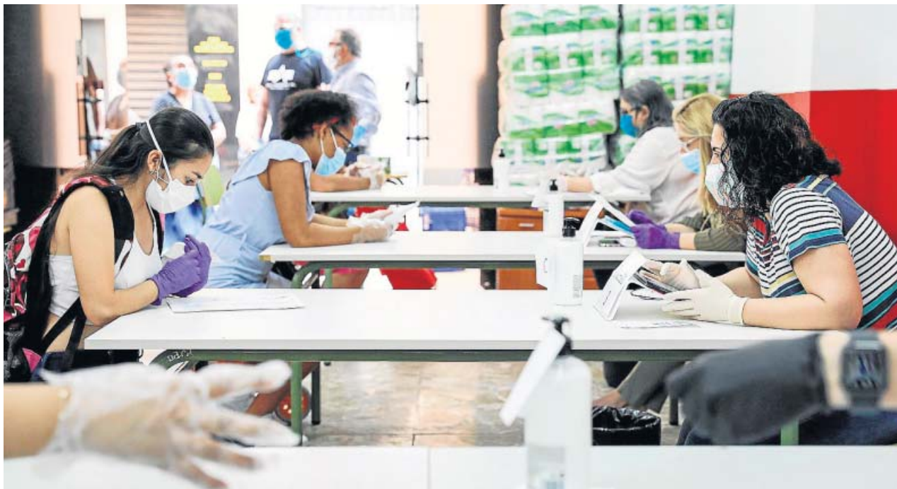
Voluntarios del economato interparroquial gestionado por Cáritas en Torrent atienden a algunos solicitantes de ayuda.

El hospital habilita un sistema para que parturientas aisladas con la Covid-19 puedan ver a sus hijos, también ingresados