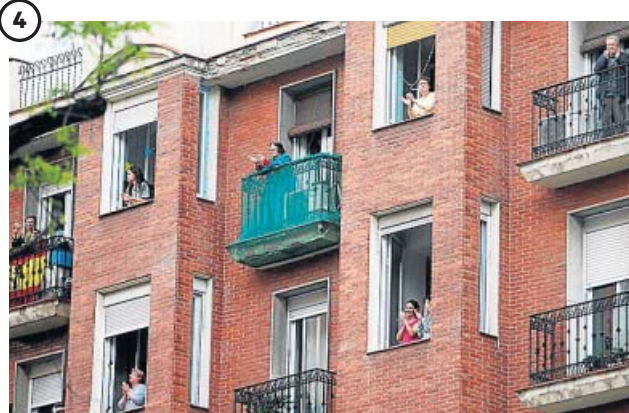
4 APLAUSOS. Reconocimiento a los trabajadores sanitarios El sábado 14 de marzo, primer día del confinamiento, los balcones y las ventanas de todo el país se llenaron por primera vez de aplausos dedicados a los trabajadores de los servicios sanitarios.