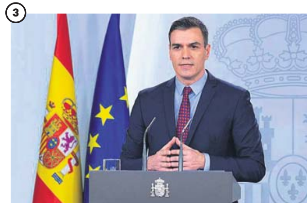
3 ALARMA. Comenzaba el confinamiento en toda España. El presidente del Gobierno, Pedro Sánchez, compareció el viernes 13 de marzo para anunciar la declaración del estado de alarma: «Haremos lo que haga falta, donde haga falta y cuando haga falta».