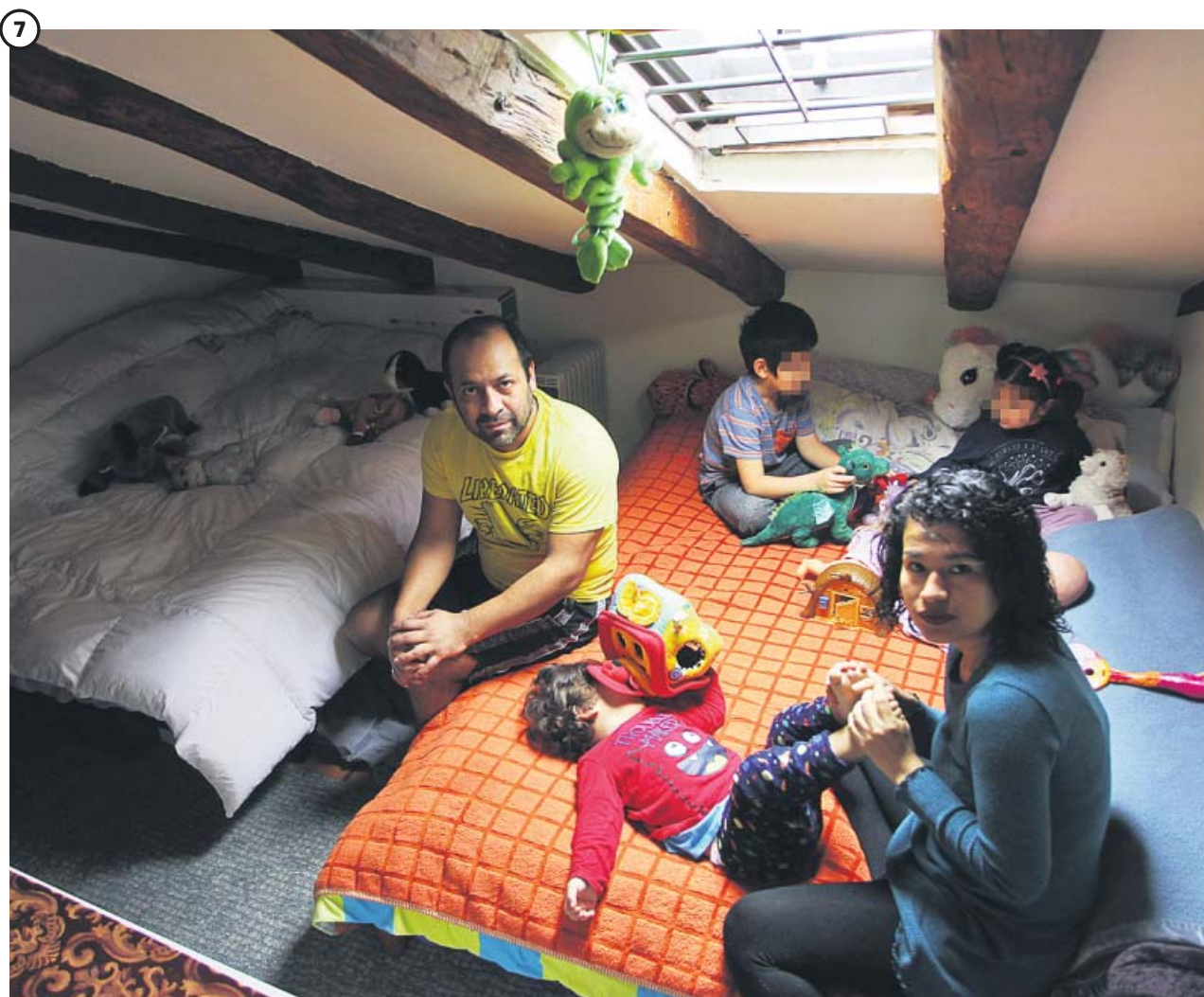
7 CONFINADOS. Una vida entre cuatro paredes. El recuerdo de este periodo que más perdurará será el de la cuarentena, que ha evidenciado las brechas sociales que existen en España en materia de vivienda, con un confinamiento que no ha sido igual para todos.

Llegó sin hacer ruido. Fue apareciendo en el día a día de los españoles sin que prácticamente nadie fuera capaz de predecir la debacle que se avecinaba. El coronavirus alcanzó a España en algún momento de febrero y se ha convertido en el centro de nuestras vidas, cambiando nuestras costumbres más cotidianas de forma abrupta y por un tiempo aún difícil de determinar. Hace dos meses cerraban todos los centros educativos en España por un mínimo de dos semanas. Fue la primera de las medidas que se implementaron para frenar una pandemia cuya magnitud aún se desconocía y que, por fin, parece dar los primeros signos de remisión. ● TEXTOS: P. RODERO