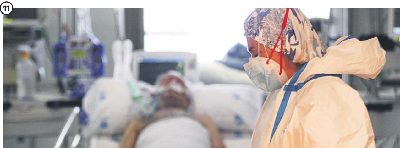
11 UCI. La realidad más dura de la pandemia. El aumento incesante de pacientes contagiados hizo que las UCIs de los hospitales llegaran al límite, al igual que su personal sanitario que, durante semanas, no contó con las medidas de protección suficientes frente al virus.