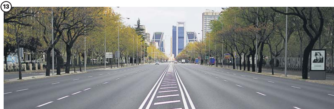
13 HIBERNACIÓN. Se paraliza toda la actividad no esencial. Ante el aumento de contagios y fallecimientos, el Gobierno tomó la decisión de llevar al país a la hibernación casi total durante dos semanas. El 30 de marzo, todos los trabajadores de sectores no esenciales tuvieron que quedarse en casa, reduciendo las pulsaciones de la economía al mínimo. Las calles de las ciudades presentaron un aspecto casi fantasmal hasta después de Semana Santa, cuando, ya superado el pico de la epidemia, estos trabajadores volvieron a sus puestos.