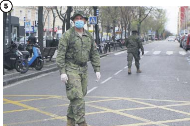
5 EMERGENCIAS. El ejército es desplegado por todo el país El primer día bajo el estado de alarma dejó las calles vacías, parques sin niños, avenidas sin coches y la UME comenzó a desplegarse en zonas de alta transmisión como Madrid, Valencia y Sevilla.