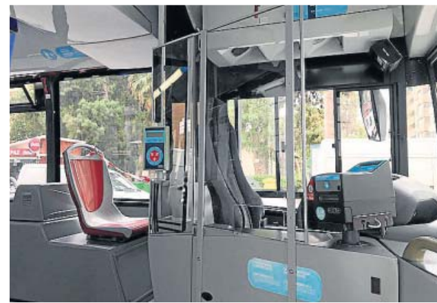
Modelo presentado para los autobuses de València.

Cada vale-beca comedor solo se puede utilizar una vez. Es importante que las familias adquieran los alimentos necesarios para cada hijo y por valor de 60 euros en una sola compra. Educación invertirá hasta 14,6 millones de euros en los vales-beca comedor si las autoridades sanitarias determinan que no se vuelve a las clases presenciales este curso, que acaba el 18 de junio en Infantil y Primaria y, por tanto, no se pueden abrir los comedores escolares. ●