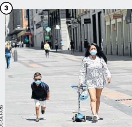
Las medidas de prevención seguirán

En el corto plazo, los viajes estarán orientados a los pueblos pequeños y las zonas rurales, por lo que las grandes urbes tardarán más en recuperar los flujos de viajeros de antes de la pandemia.