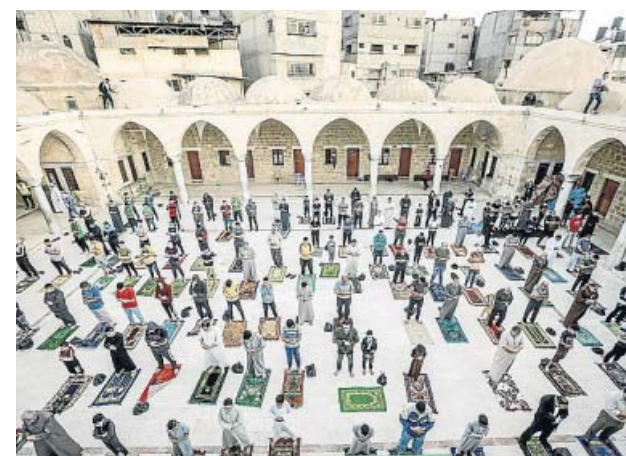
↑ Despedida al Ramadán Algunos musulmanes de Gaza (Palestina) oran durante el fin del Ramadán más atípico, que concluyó el sábado.