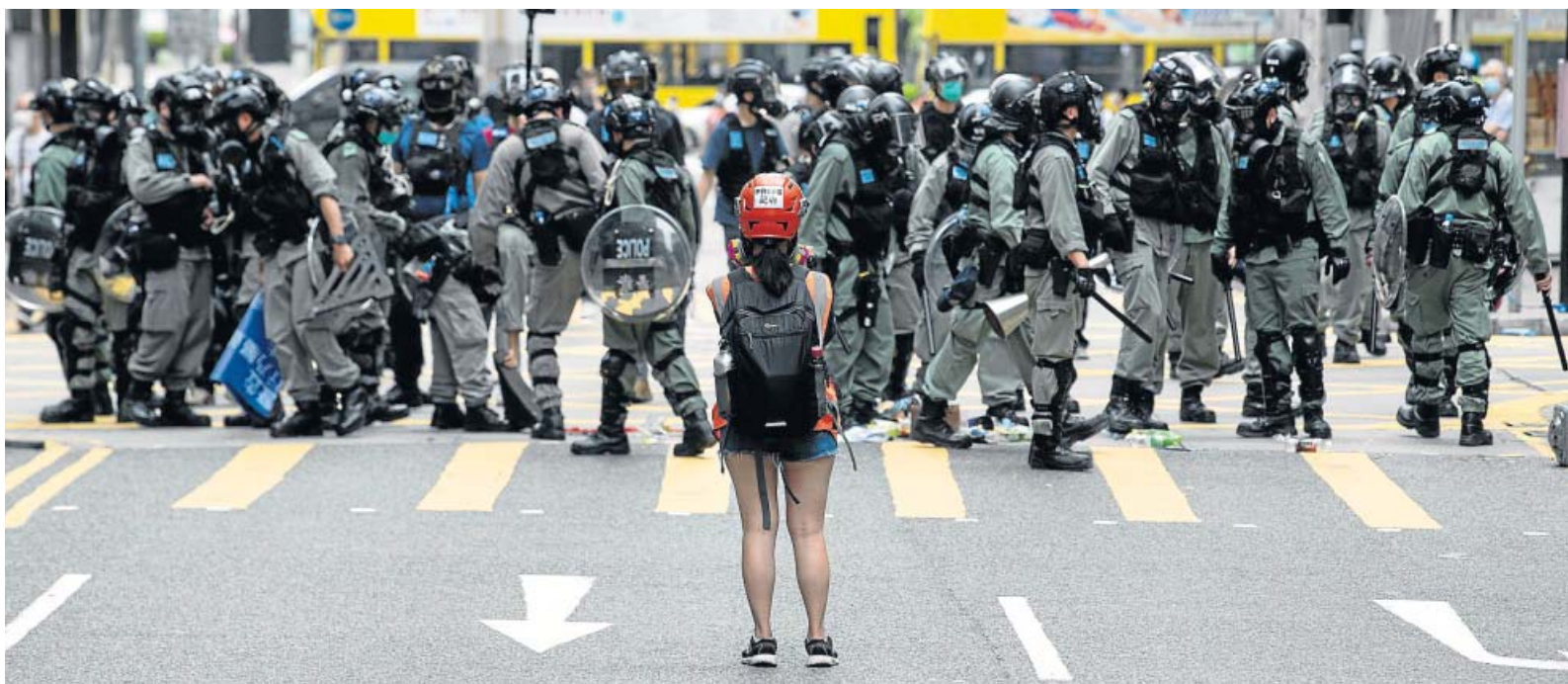
← Protestas en Hong Kong Miles de ciudadanos se manifestaron ayer en Hong Kong, como hacían antes de la pandemia, para protestar por la ley de seguridad nacional que planea el Gobierno de Pekín.