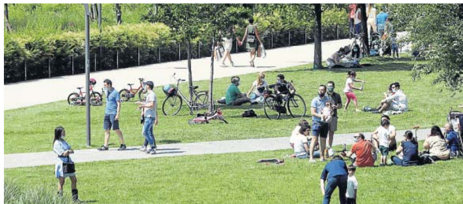
→ Un respiro en el parque Las personas caminan, andan en bicicleta y se relajan mientras disfrutan de un día soleado de fase 2 en el Parco di CityLife de Milán (Italia).