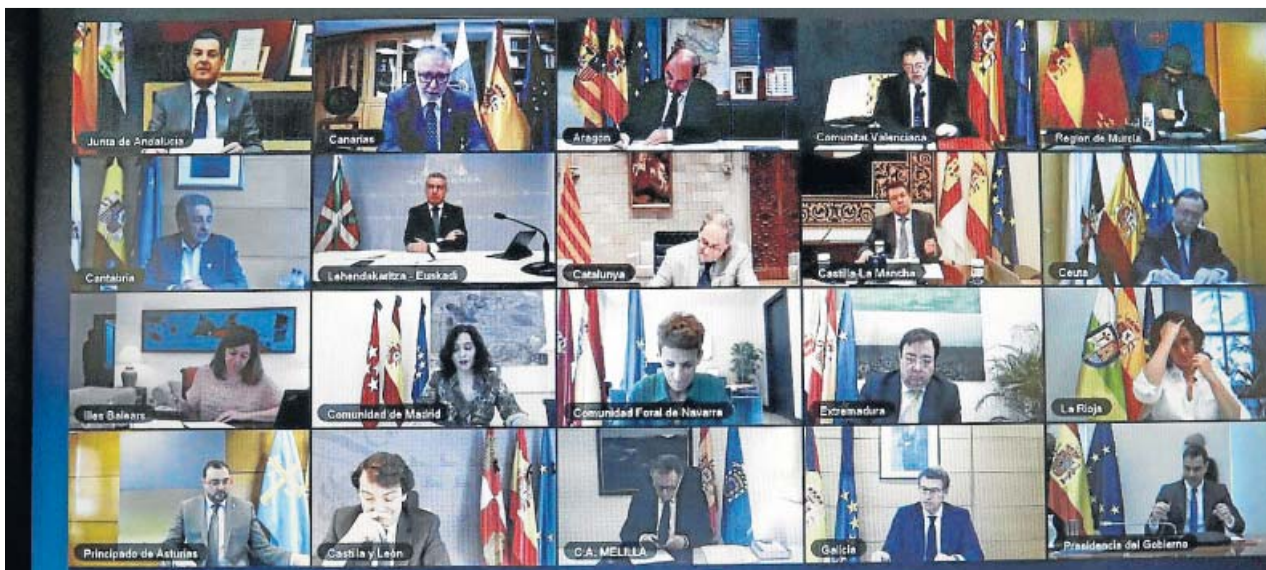
Imagen de la undécima conferencia de presidentes autonómicos.

EL PRESIDENT asegura que los indicadores de la pandemia «van en la buena dirección» SÁNCHEZ prevé acelerar la desescalada y que no sea necesario estar 14 días en una fase