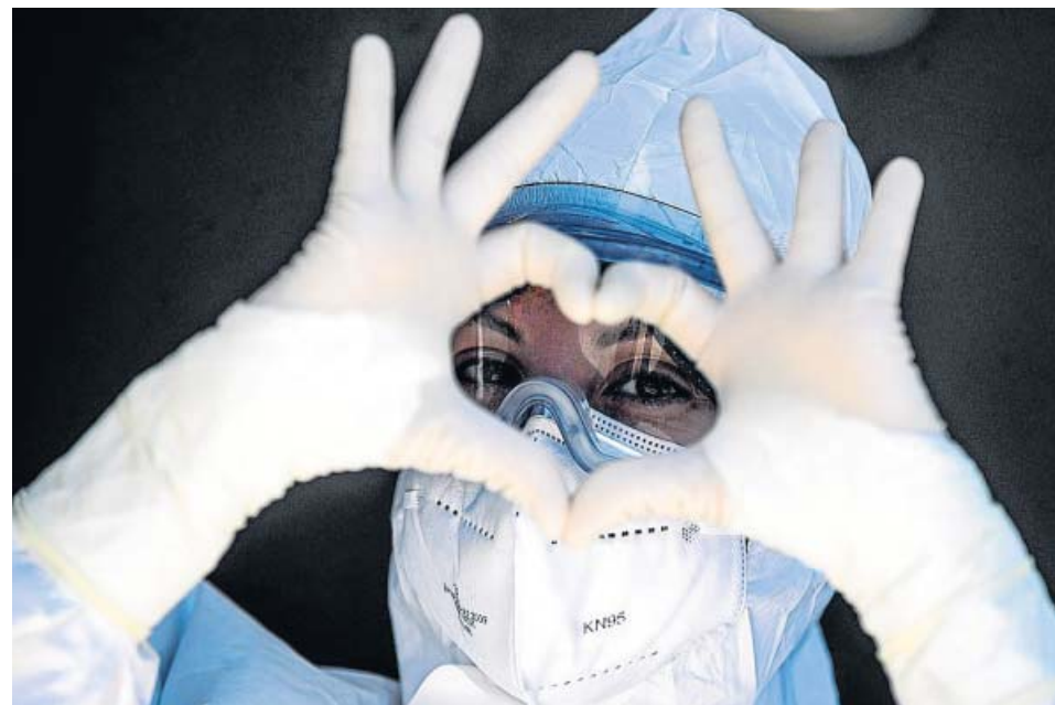
Una de las doctoras se despedía así ayer de su paciente italiano.

Este oncólogo se encuentra ya plenamente incorporado a su trabajo: «Habitualmente la PCR se repite a los catorce días pero como tenía tan pocos síntomas volvieron a hacérmela a los diez y ya había negativizado. En el momento en el que estábamos, la necesidad de reincorporación era relativamente acuciante». Ya han empezado a notar un descenso en la presión del hospital, pero han pasado por un momento excepcional: «Nunca jamás habíamos vivido una cosa como esta. Nunca habíamos tenido una cantidad de pacientes tan grande. Cuando estás dentro te das cuenta de la trascendencia de esta infección». ●