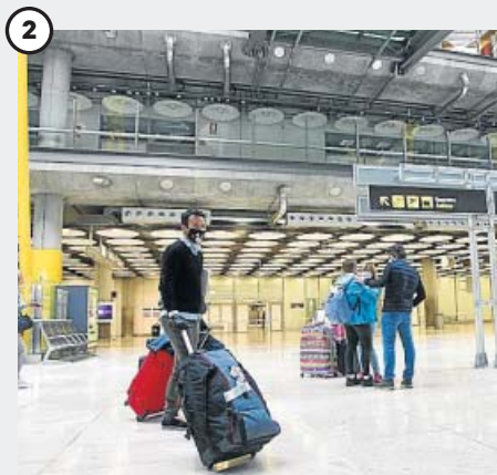
Un turismo de corta distancia

El virus ha cambiado el concepto de ciudades, y esta estará más aproximada a las necesidades humanas. «No tiene sentido que tengamos que trasladarnos kilómetros para hacer lo que queremos hacer» por lo que «se pondrá en valor el entorno cercano», dice José Francisco García.