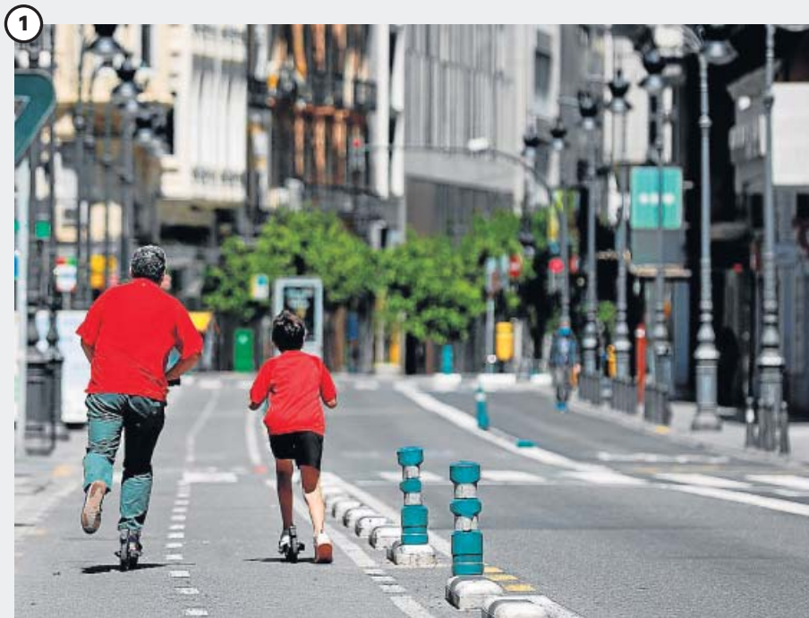
Adiós a las megaciudades: las distancias serán más cortas