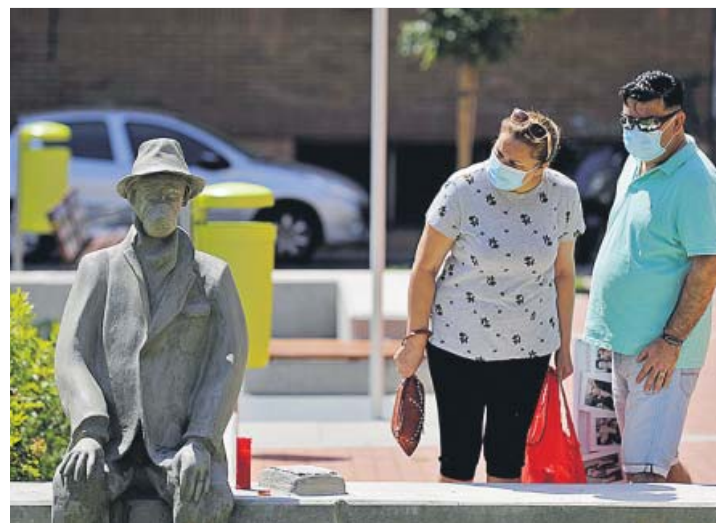
Una pareja observa atentamente la escultura del anciano.

Todos los vecinos que pasaban por allí hacían un alto en el camino para observar detenidamente el homenaje a los que ya no están. Con sorpresa pero con emoción, adultos de todas las edades no dudaban en detenerse para recordar, a través de la figura sin nombre, a los muchos familiares, amigos o allegados víctimas de la Covid-19. ● S. G.