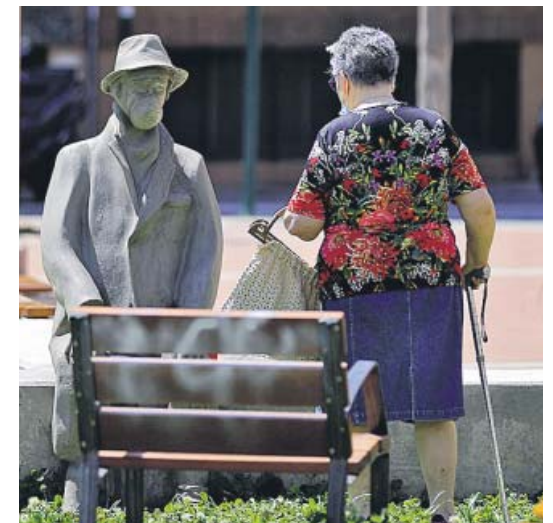
Una mujer se acerca hasta el anciano.