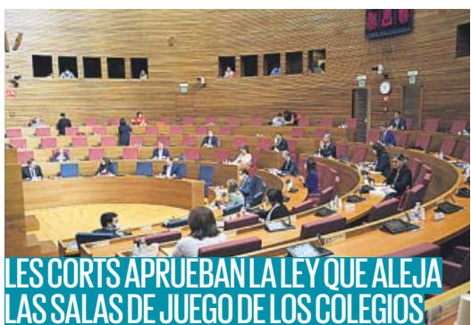
LES CORTS APRUEBAN LA LEY QUE ALEJA LAS SALAS DE JUEGO DE LOS COLEGIOS

El Consejo de Ministros aprueba hoy la puesta en marcha del Ingreso Mínimo Vital, que se empezará a cobrar a partir de junio. La previsión es que puedan acceder a esta ayuda unos 850.000 hogares. De estos, unos 100.000 podrán recibirla de forma directa, al tener ya verificado que cumplen los requisitos.