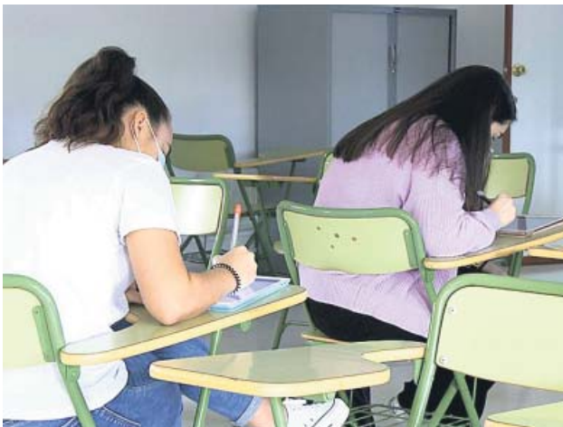
Alumnos, en su primer día de vuelta a las aulas en la fase 2.

Con la fase 2, los colegios empiezan a recibir estudiantes, de forma parcial y voluntaria. Cada comunidad ha decidido el proceso a seguir, con bastantes coincidencias