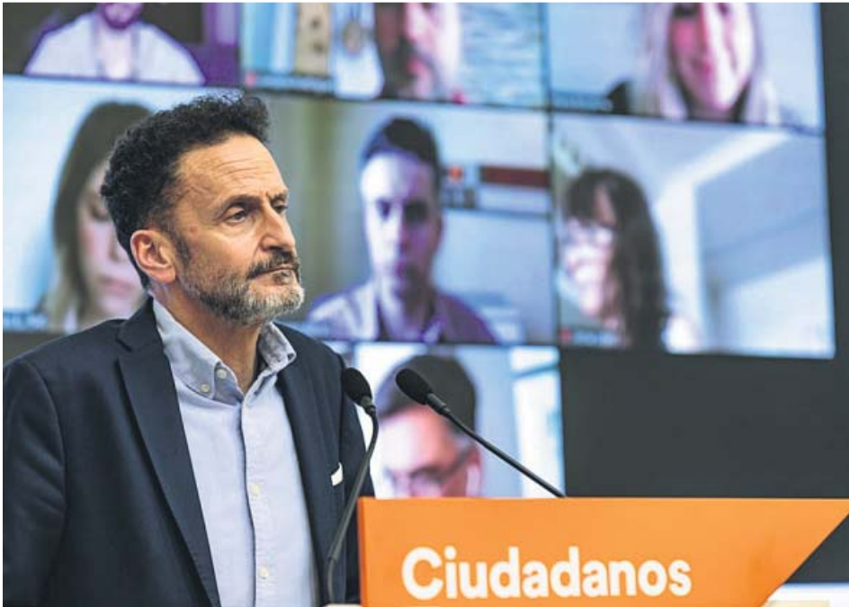
El portavoz adjunto de Cs en el Congreso, Edmundo Bal, en rueda de prensa.

Los naranjas dicen que serán coherentes y prudentes mientras el PP les mete presión: «Otros serán los que tengan que explicarse»