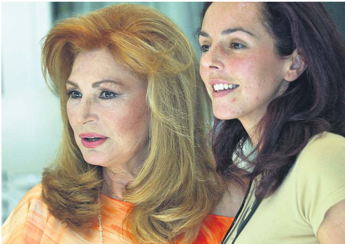
Rocío Jurado y su hija Rocío Carrasco, en una imagen de 2004.