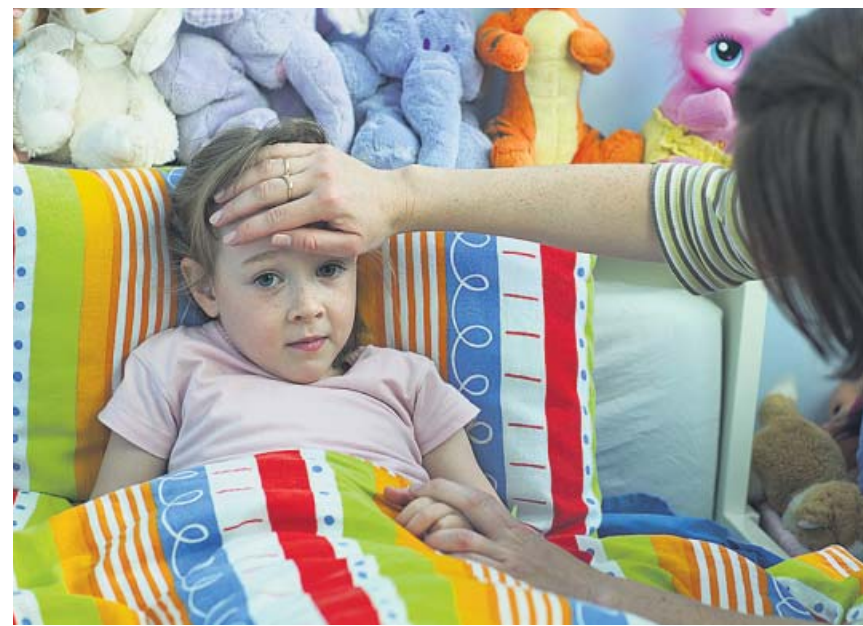
El signo de alarma al que más atención prestan los padres es la fiebre.

Los colegios se han llenado de protocolos para evitar contagios y de botes de hidrogel. Los pupitres se han situado a dos metros uno de otro y los alumnos llevan mascarillas por si no pueden mantener esa distancia de seguridad. Los chicos regresan a unas aulas y a una forma de enseñanza muy diferentes a las que dejaron en marzo. ●