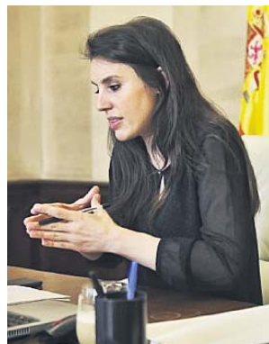
La ministra de Igualdad, Irene Montero.

«O sea, no lo voy a decir porque no lo voy a decir. Porque quiero ser muy prudente, porque creo que la comunicación que se estaba haciendo como Gobierno es buena comunicación, muy basada en los datos médicos», aseguraba Montero en una charla off the record