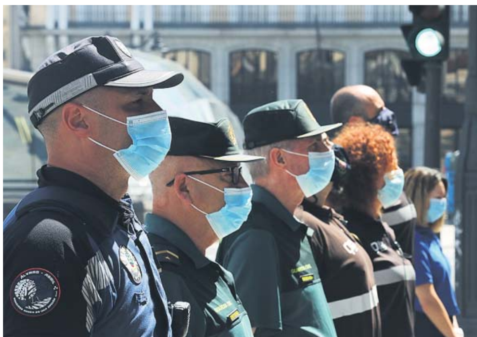
Agentes de la Policía Municipal y la Guardia Civil guardan un minuto de silencio en Madrid.

Antes, los informes del Ministerio de Sanidad hablaban de fallecidos notificados cada día, y en ese «notificados» es donde está la clave. Al tratarse de muertes notificadas y no de muertes con fecha de defunción de ese día, cada jornada se conocían varios decesos con una fecha de fallecimiento anterior, lo que provocaba que muertes antiguas y otras más recientes se mezcla-