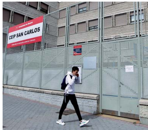
Un colegio de Villaverde (Madrid), en la mañana de ayer.