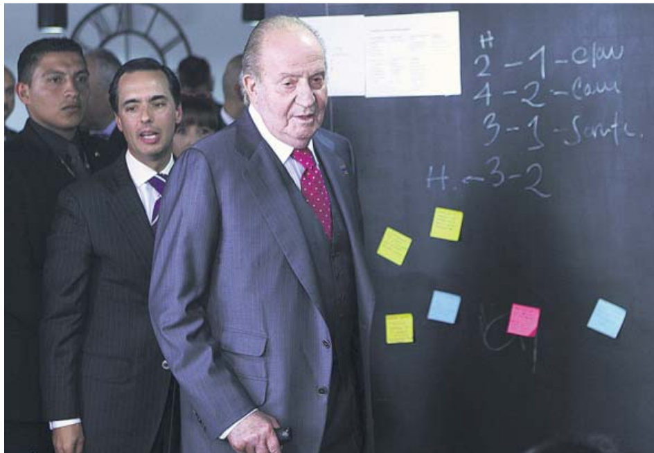
Juan Carlos I, ya emérito, llega a Colombia para asistir a la investidura del presidente Santos.

ADJUDICACIONES Se enmarca en la causa por el presunto cobro de comisiones por las obras del ferrocarril CALIFICACIÓN Tiene que decidir sobre la relevancia penal, pues son hechos posteriores a la abdicación