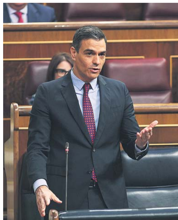
El presidente del Gobierno, ayer en el Congreso.

De momento, la receta del presidente pasa por una reforma hacia «más justicia fiscal» o la confianza en que cada vez serán necesarios menos recursos en prestaciones de desempleo porque el paro irá disminuyendo. Aizpurua le hizo notar a Sánchez que así no respondía a su duda y el presidente dijo que su pregunta era «interesada en una época preelectoral en el País Vasco». «El debate es otro, el debate es que esta crisis ha acelerado cambios que veíamos venir», como en el