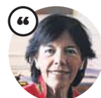
ISABEL CELAÁ Ministra de Educación

«Cuando los colegios cerraron no había información suficiente sobre los niños como transmisores del virus»