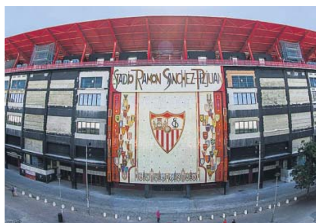
Todo preparado en el Pizjuán para la vuelta de la Liga EFE

El Sevilla aparece en la tabla con 14 puntos más que el Betis, aunque en estos partidos ese dato cuenta poco y más con el factor de apoyo de la grada perdido. Si se ha beneficiado el equipo que dirige Julen Lopetegui de la recuperación durante el obligado parón del centrocampista brasileño Fernando Reges, uno de los in-