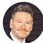
KENNETH BRANAGH Director de cine

«De niño, mi padre me hablaba de gigantes y trolls. Ser irlandés implica aceptar la posibilidad de que la magia exista»