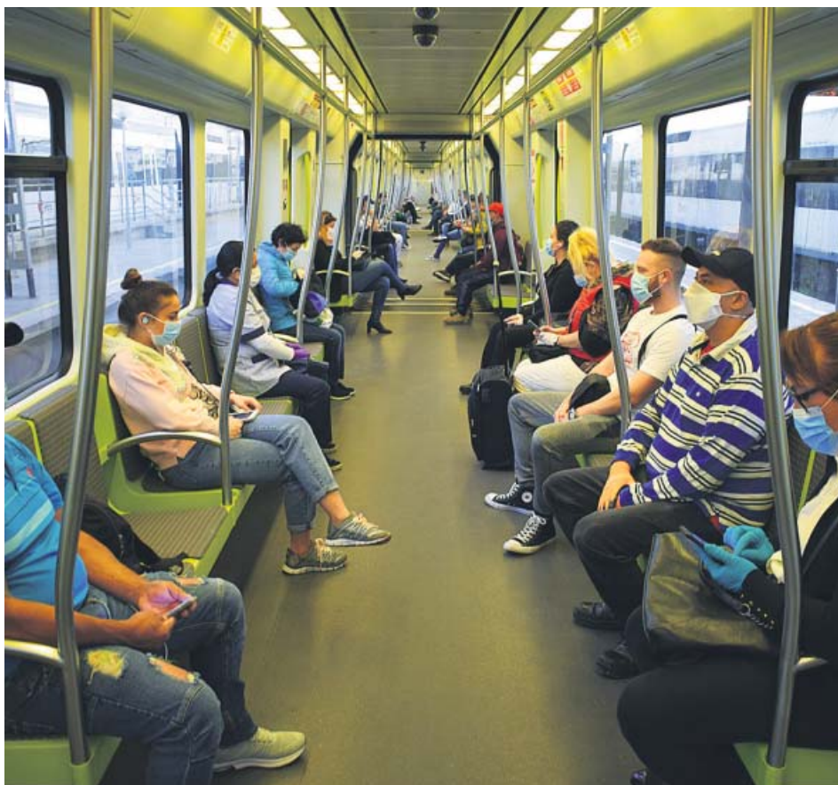
Usuarios de Metrovalencia en un convoy.

ESPACIO PÚBLICO El documento aboga por sustituir plazas de aparcamiento por terrazas y tiendas