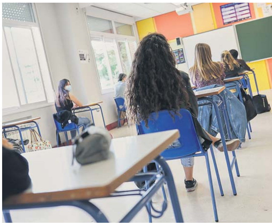
Alumnos en el aula en el Colegio Alameda de Osuna de Madrid.

ción de 1,5 metros entre las mesas, para lo cual habrá que reorganizar los espacios. Se baraja la posibilidad de adecuar como aulas bibliotecas, salones de actos o gimnasios y se priorizarán las actividades al aire libre. Sobre los recreos, el director del Ccaes señaló que se proponen cuestiones como limitar zonas en el patio o escalonar sus horas de uso, algo que también se recomienda para la entrada y salida de los centros.