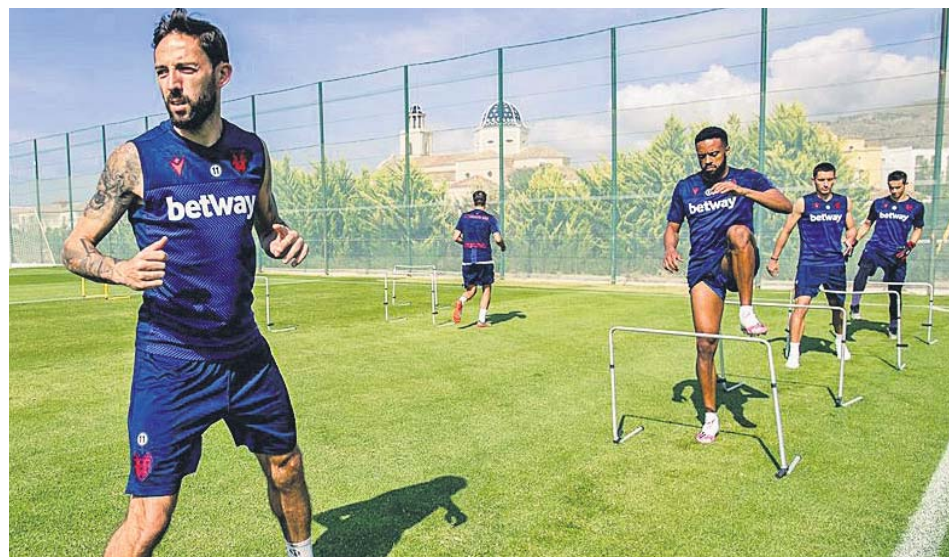
Morales y Hernani en el entrenamiento de ayer del equipo granota.

«Sabemos la camiseta que vestimos y nos estamos preparando, no solo dentro del campo, también mentalmente, para competir al máximo». ●