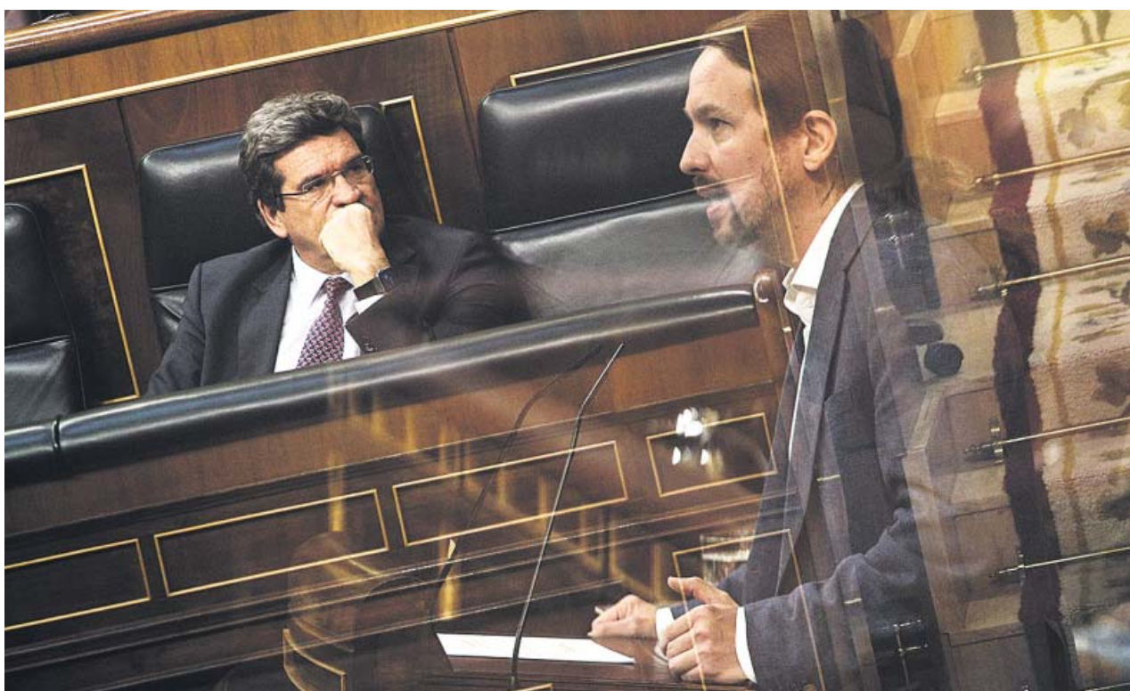
El ministro José Luis Escrivá y el vicepresidente segundo, Pablo Iglesias, ayer en el Congreso.

EL PP termina votando a favor después de mantener la incógnita hasta el final