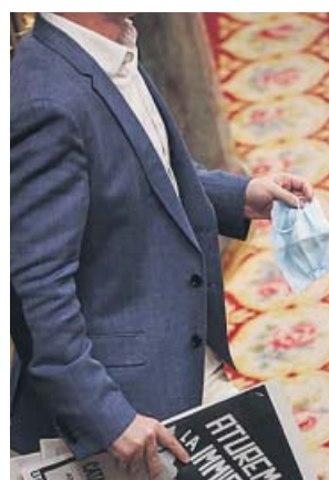
Un diputado baja de su escaño con una mascarilla.

Pero pese al avance de la desescalada sanitaria, la tensión siguió escalando en una sesión en la que la oposición mencionó el 8-M, la supuesta «purga» del ministro Marlaska en la Guardia Civil, las muertes en