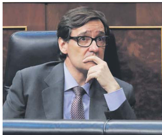
El ministro de Sanidad, Salvador Illa, en el Congreso.

Illá es secretario de Organización del PSC y en enero desembarcó en el Gobierno como la cuota catalana. La pandemia le ha convertido en la estrella del Ejecutivo a ojos de Sánchez. El presidente está muy satisfecho con su gestión de la crisis, y también tiene claro que se ha con-