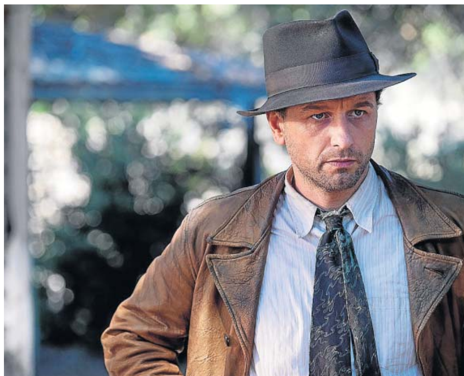
El actor galés Matthew Rhys da vida al detective y abogado Perry Mason.

El nuevo Mason recuerda al cínico Philip Marlowe. Aunque él es un tipo hundido, siempre tristón, con la mirada como ausente, que malvive en las ruinas de la granja de su familia, donde le asaltan los fantasmas de las trincheras de la Primera