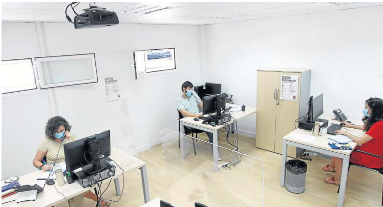
Tres rastreadores, técnicos de seguimiento de contactos, en instalaciones médicas de la Comunidad de Madrid. JORGE PARÍS