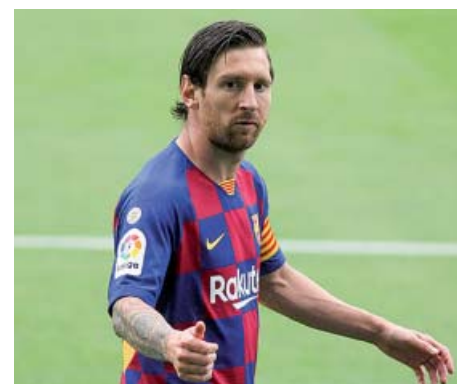
Tres jornadas sin marcar del Pichichi Leo Messi repartió dos asistencias en Vigo el sábado, pero no marcó por tercera jornada seguida. Benzema aprieta a cuatro goles.