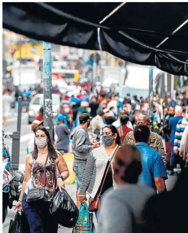
Fotografía de una calle de Sao Paulo, Brasil, el segundo país más golpeado por la Covid.

De momento, el país más afectado por el virus es Estados Unidos, que este fin de semana superó los 2,5 millones de contagios y rebasó la barrera de las 125.000 muertes, con Florida como uno de los puntos calientes junto