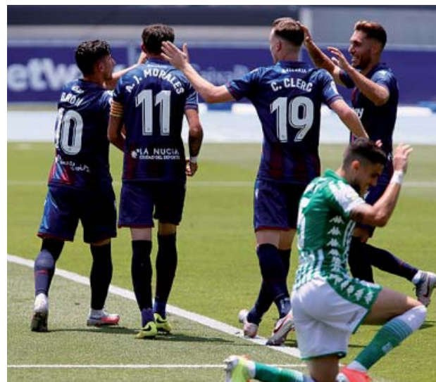
Los jugadores del Levante celebran el gol de Bardhi.

Goles: 1-0, 21': Mayoral. 2-0, 35': Bardhi. 3-0, 50': Morales. 4-0, 59': Rochina. 4-1, 70': Canales. 4-2, 87': Juanmi.