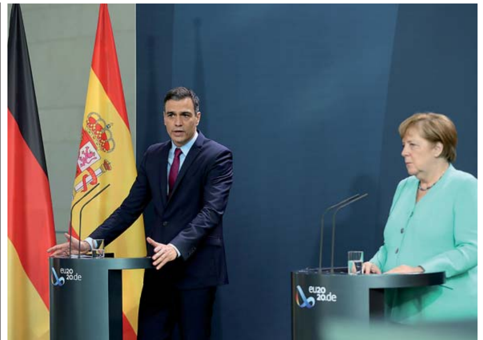
Pedro Sánchez y Angela Merkel, ayer, tras su reunión bilateral en Berlín.

Las palabras de Felipe VI llegarán al final de un acto que se cerrará con el poema Silencio de Octavio Paz —que leerá en grabación el actor José Sacristán— y un minuto de silencio. ●