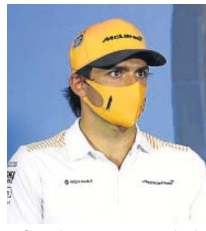
Sainz, durante una rueda de prensa reciente.

saber que McLaren está trabajando en la dirección correcta». En declaraciones facilitadas por su equipo, el madrileño reconoció que se fue del Gran Premio de Estiria «con sentimientos encontrados». Firmó una magnífica tercera posición en la sesión de cali-