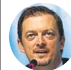
ANDREW PARSONS Presidente del Comité Paralímpico Internacional

«Después de la pandemia, debemos reconstruir mejor y trabajar juntos para crear una sociedad más inclusiva»