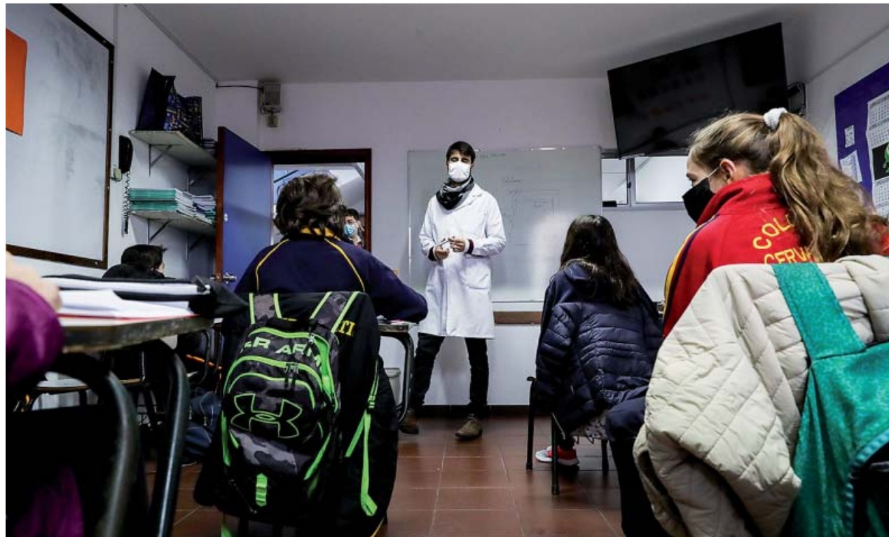
Varios alumnos y un profesor, protegidos con mascarillas en el interior de un aula escolar en Montevideo, Uruguay.

El último de ellos se trata de una investigación realizada por científicos del Hospital Universitario de Dresde, en Alemania, en la que se han analizado muestras de sangre de casi 1.500 adolescentes y 500 profesores de 13 centros