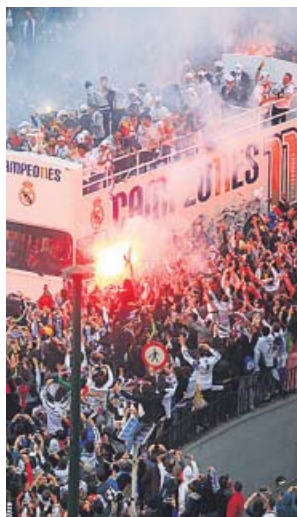
Miles de personas, en una celebración del Madrid.

«Animamos a que la celebración no sea en Cibeles, que no se produzcan aglomeraciones, que haya celebración en los balcones. Asomemos las banderas del Madrid a los balcones, los aplausos, pero en la medida de lo posible, de verdad, que no se acerquen a Cibeles», dijo ayer el alcalde ma-