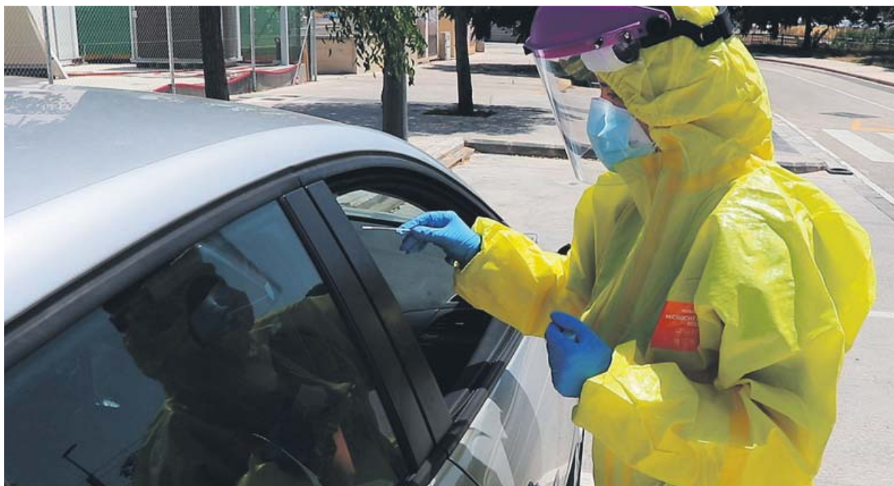
Ayer arrancaron las pruebas a clientes de discotecas de Valencia capital con empleados afectados.

RÉCORD Ayer Sanidad informó de la cifra más alta de contagios desde el 2 de mayo, con 1.153 positivos ARAGÓN 45 centros de mayores cuentan con casos en esta región, con dos fallecidos y 112 contagiados CATALUÑA Se reducen las restricciones en Lleida y otros seis municipios afectados C. VALENCIANA Un deceso y 114 positivos en 24 horas comunicó ayer la Comunitat