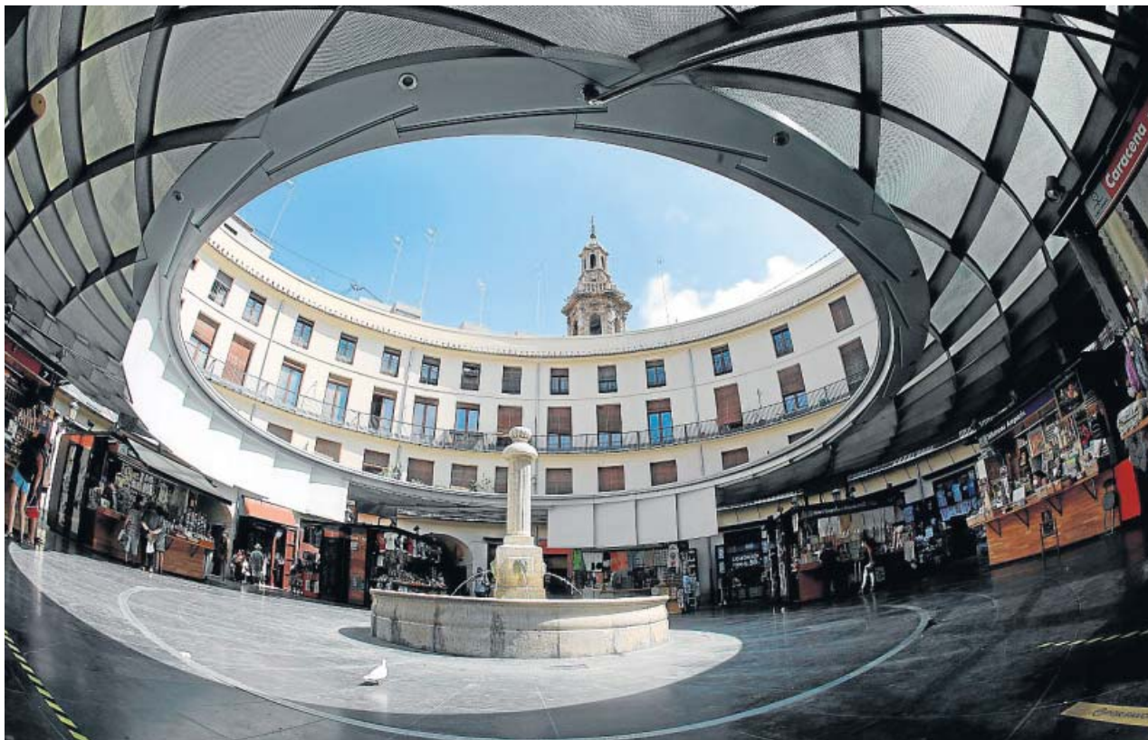
La plaza Redonda, normalmente abarrotada de turistas, completamente vacía.