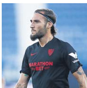
Nemanja Gudelj en el choque entre Leganés y Sevilla.

Las minivacaciones de los futbolistas tras el final de la Liga dieron lugar a viajes, reuniones familiares y con amigos y alguna que otra fiesta. Tras ellas, el madridista Mariano volvió contagiado, por lo que fue inmediatamente aislado antes de que se mezclara con sus compañeros. Fue el primer susto. Al día siguiente, ayer, el Sevilla informó por la mañana de que uno de sus jugadores estaba contagiado, revelando después el futbolista, Gudelj, que era él y que estaba perfectamente de salud. Este caso es mucho más preocupante, pues los jugadores sevillistas estuvieron entrenándose en grupo tanto el domingo como el lunes. Solo Éver Banega lo hizo al margen debido a que fue 'cazado' de fiesta en una discoteca de Valencia en