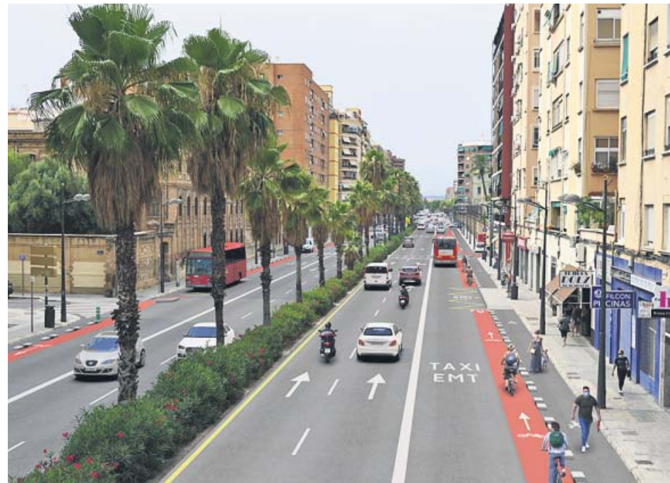
Figuración del nuevo reparto del espacio público que tendrá la avenida Pérez Galdós de València.

Es decir, con aceras más anchas, eje ciclista compartido