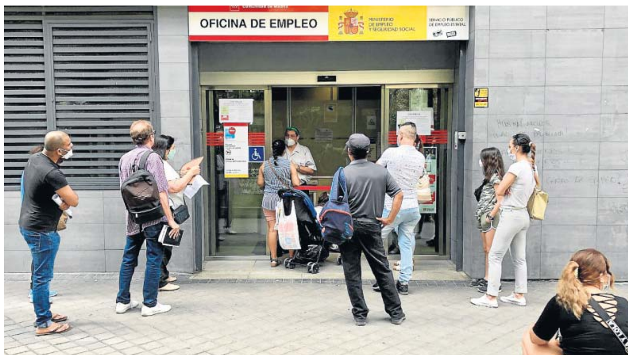
Un grupo de personas esperan su turno en una oficina del SEPE, en Madrid.

El Ejecutivo siempre se ha mostrado proclive a extender el alcance temporal de esta medida mientras siga haciendo falta para evitar despidos masivos, aunque revisando el estado del mercado laboral cada pocos meses. Pese a que sindicatos y patronal han