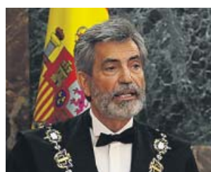
El presidente del CGPJ, Carlos Lesmes.

Lesmes no concretó pero en los últimos meses se ha asistido a distintos criterios sobre una misma cuestión y en distintos tribunales. Uno de los casos a los que se han enfrentado los jueces es la autorización