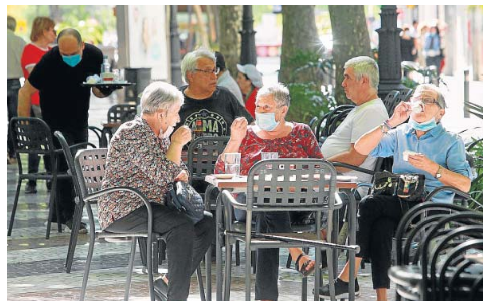
Vista general de la terraza de un bar, en Gandia.