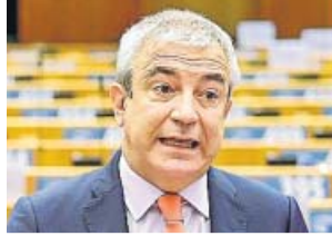
Luis Garicano (Cs).

Luis Garicano sostuvo que «debemos estar orgullosos de la respuesta» de la UE ante esta crisis. «Transmitimos un mensaje a los ciudadanos para salir de esto juntos», pero no todo está resuelto, pues el dinero «hay que gastarlo bien». Insistió que el Parlamento Europeo asegurará que los fondos «se usen para favorecer a las familias» porque Europa «no es un cajero automático». Para el portavoz de Ciudadanos en la Eurocámara y vicepresidente de Renew Europe lo importante es el cómo a partir de ahora. Y repitió una idea: «El reto ahora es gastar bien el dinero del plan de recuperación: para mejorar en empleo, sanidad, educación, no para convertir a los amigos de algunos en élite empresarial», en una crítica a Pablo Iglesias. ●