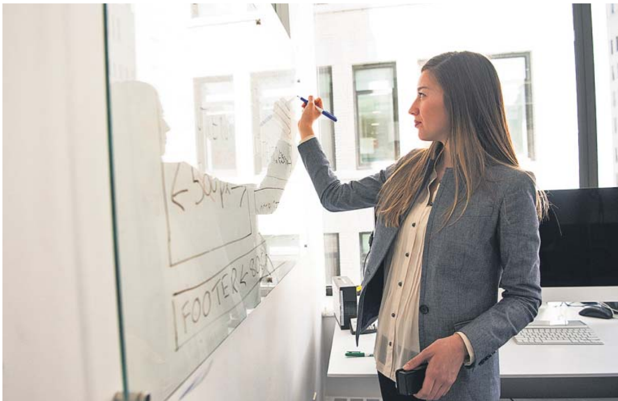
Una mujer escribe en una pizarra en una oficina.