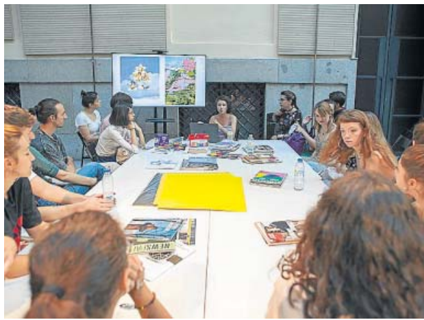
Taller Cómico Virtual de Puwerty 2019. PUWERTY