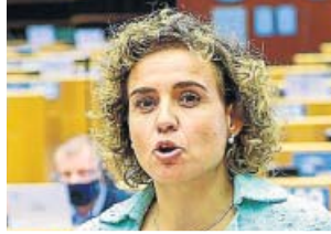
Dolors Montserrat (PP). P. E.

La portavoz del PP en el Parlamento Europeo, Dolors Montserrat, explicó que la pandemia es «el mayor desafío de nuestras vidas» y que la UE tiene que estar «al lado de quienes más lo necesitan» porque «Europa no puede permitirse una generación perdida». Según ella, «hay que tomar ya medidas urgentes» para recuperar la economía y el empleo. «Necesitamos que los gobiernos nacionales hagan sus deberes». Señaló que la pandemia ha causado «daños inimaginables porque miles de familias han perdido seres queridos y millones de personas han perdido su trabajo», y recordó que «también ha acelerado fenómenos que ya estaban produciéndose y que socavaban la fuerza de la UE y el futuro de los ciudadanos europeos». ●