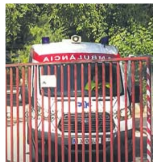
Puerta de acceso a la residencia. ●

La residencia, que se encuentra bajo vigilancia activa e investigada después de que se difun-