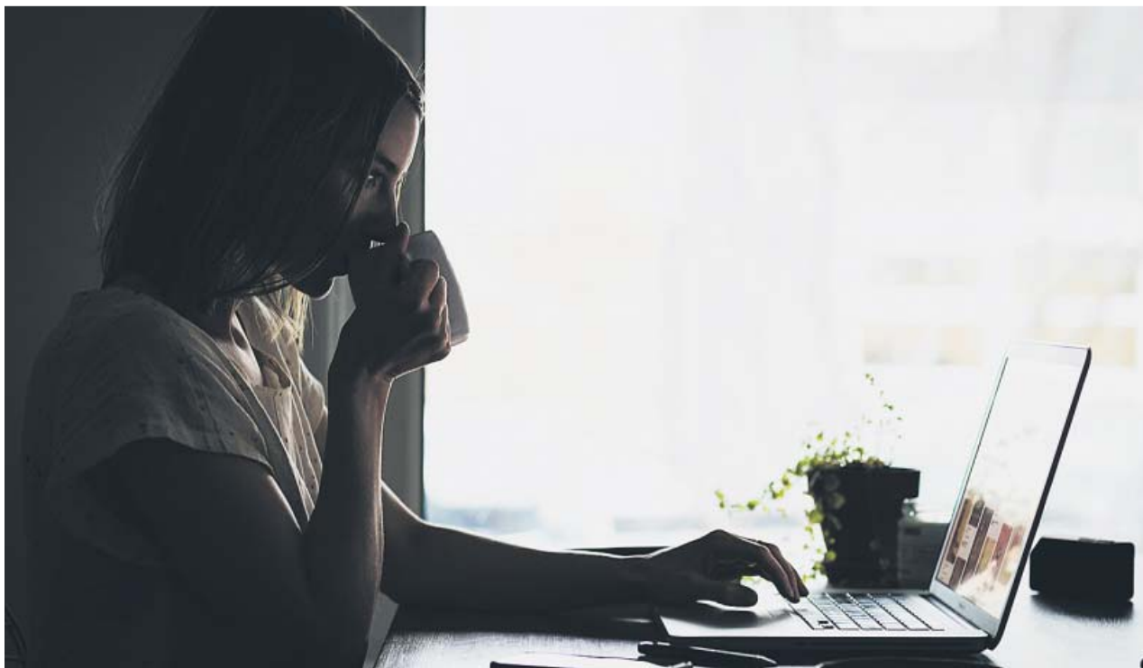
Una mujer joven rastrea ofertas de trabajo en su ordenador portátil mientras toma un café en su hogar.

Diseñar una estrategia, mentalidad positiva, formarse, prepararse las entrevistas o reactivar los contactos ayudan a encontrar empleo