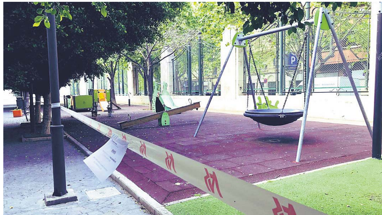
Una zona de columpios y juegos de un parque de València, precintada durante el estado de alarma de marzo.

La ciudad de València es la zona más afectada del conjunto de la Comunitat Valenciana, por lo que se están adoptando medidas concretas por su elevada movilidad