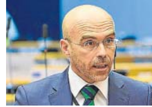
Jorge Buxadé (Vox).

En la ronda de respuestas por parte de los eurodiputados intervino también Jorge Buxadé. El eurodiputado de Vox comentó que el discurso de Von der Leyen estuvo completamente vacío. «¿En qué mundo viven?», se preguntó, y pidió olvidarse de las «agendas globales» porque «Bruselas hundirá a toda Europa» si no sale a la calle. «Toca la ley y el orden», expresó en uno de los mensajes más críticos con la presidenta Ursula von der Leyen. «Bla, bla, bla», ironizó, criticando además el beneplácito de «populares, socialistas y liberales» a la presidenta de la Comisión. «Es, además, un discurso peligroso», expresó el portavoz de Vox, que mencionó en el Hemiciclo «las colas del hambre» que «se están viendo en España» a causa de la crisis. ●