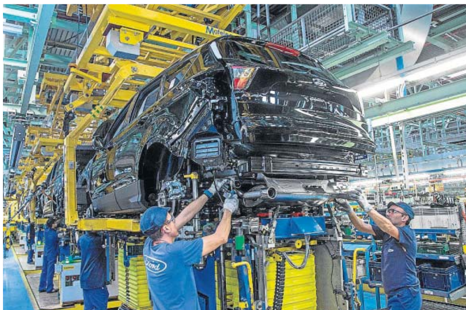
Cadena de montaje en la factoría de Ford Almussafes.

Asimismo, Ford ha confirmado a los sindicatos, en una reunión de la comisión consultiva, que revierte su decisión adoptada hace más de un año de dejar de producir en Almussafes el próximo año el porcentaje de Transit Connect desti-