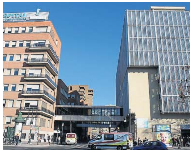
Fachada del Hospital Clínico de València.

Los actuales pabellones sufren actualmente problemas de falta de espacio en unida-