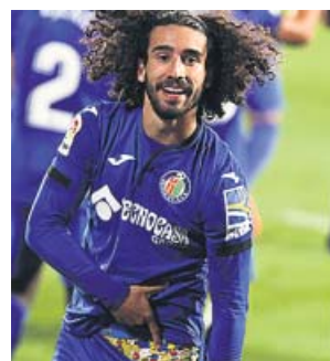
Cucurella y sus calzoncillos, protagonistas del gol.

El Getafe salió a por todas desde el primer minuto, con mucho ritmo, y al cuarto de hora de juego ya se había adelantado en el marcador mer-