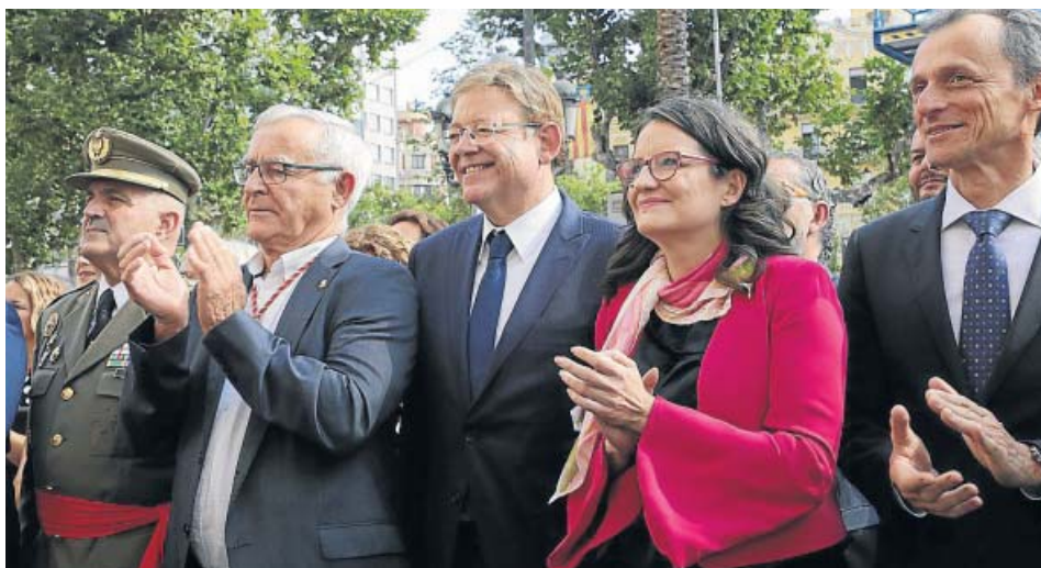
Ribó, Puig, Oltra y el ministro Duque, en la Procesión Cívica del año pasado.

La Procesión Cívica queda oficialmente cancelada al no salir la Senyera a la calle y los actos municipales serán en el interior del Consistorio y «controlados»