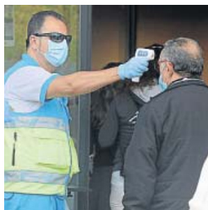
Control de temperatura en un centro cultural de Madrid.

En lo que respecta a la situación en los hospitales, el número de pacientes con coronavirus actualmente ingre-