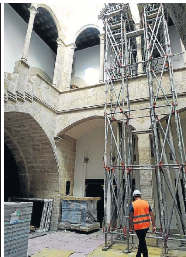
Estado de las obras en el interior del edificio.

El alcalde aseveró que el Ayuntamiento busca «celebrar el 9 d'Octubre lo mejor posible», dentro de lo «que permitan las normas de sanidad» y huyendo «de cualquier acto que suponga concentración de personas». ●