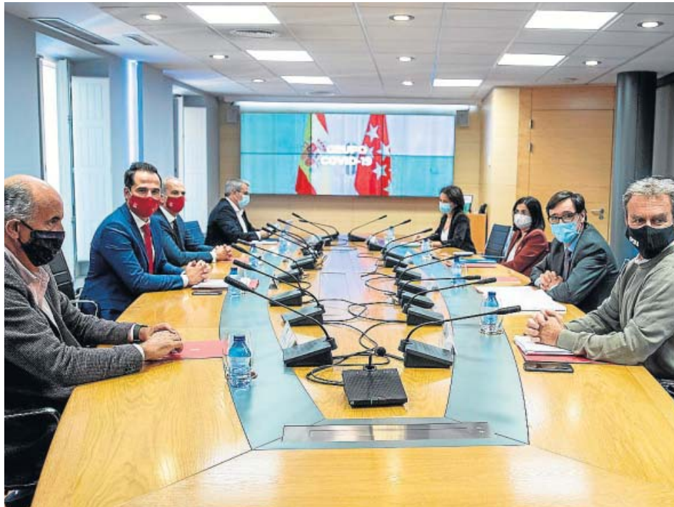
El Grupo Covid, entre ellos el vicepresidente madrileño y el ministro de Sanidad, reunidos ayer.

ficados por todas las comunidades autónomas al final de la jornada. De momento, el Gobierno central y Madrid acordaron que se fijen criterios comunes de actuación para todas las ciu-