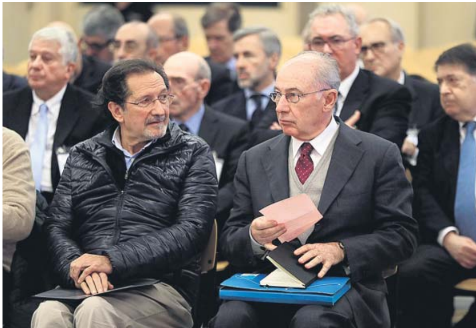
El exministro, Rodrigo Rato, sentado en el banquillo.

años lleva en prisión Rodrigo Rato, condenado por el caso de las tarjetas black .