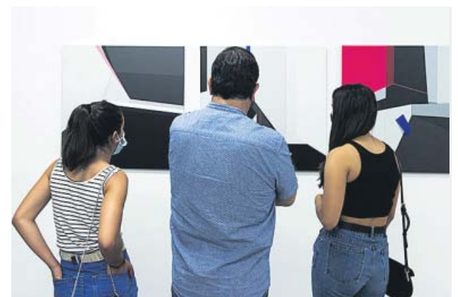
Tres personas observan unos cuadros del pintor.