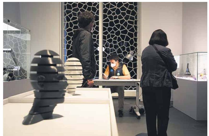
La muestra está compuesta por más de 40 piezas impresas en 3D.

Se crea una prestación para los trabajadores con contrato fijo discontinuo o que realizan trabajos fijos y periódicos en determinadas fechas afectados por un ERTE. ●