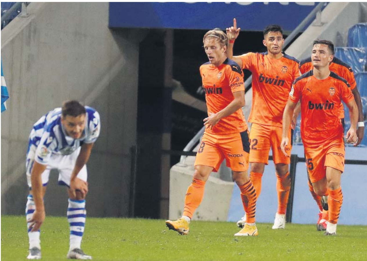
El delantero uruguayo Máxi Gómez celebra su gol ante la Real Sociedad.