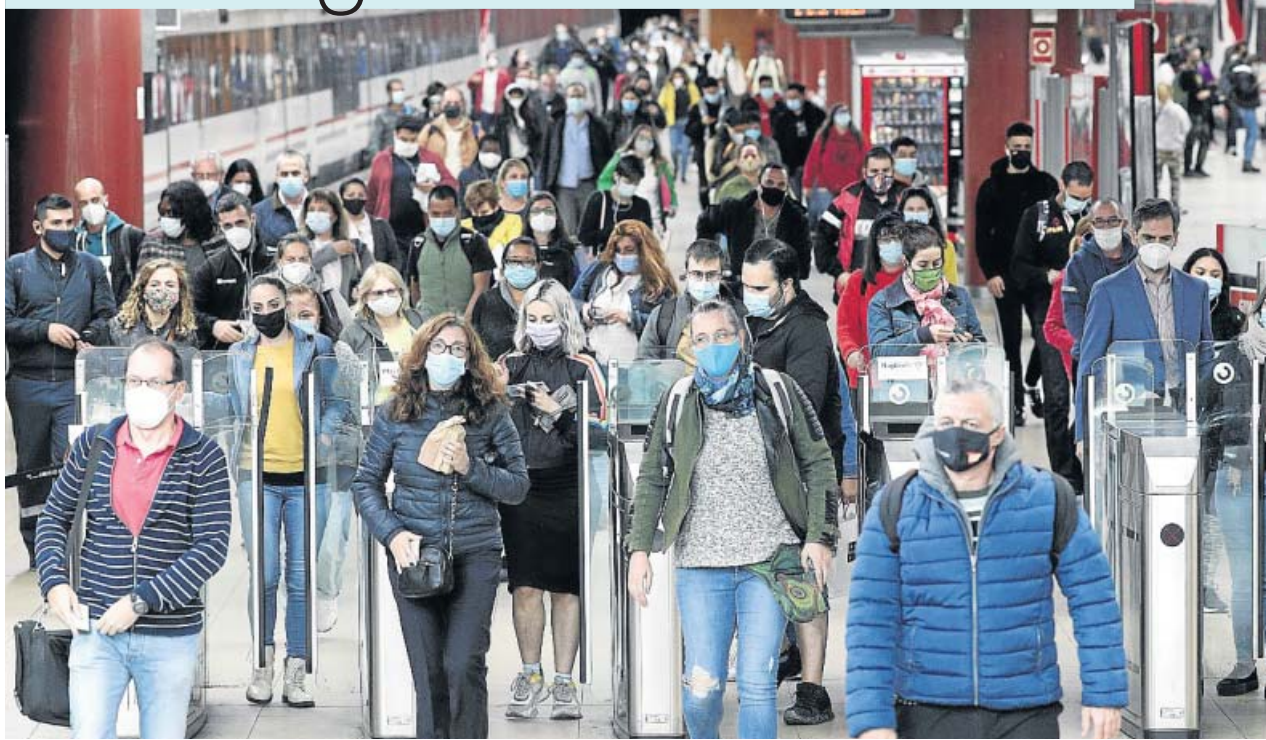
Viajeros con mascarilla en la estación de Cercanías de la localidad madrileña de Getafe.

Algunos hábitos incorporados al inicio de la pandemia han perdido validez a la hora de evitar el contagio por Covid. Sin mascarilla, distancia y lavado de manos nada es eficaz