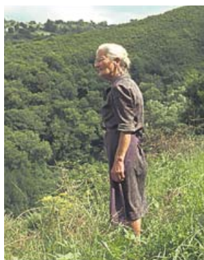
Imágenes de El hoyo , La trinchera infinita y O que arde .