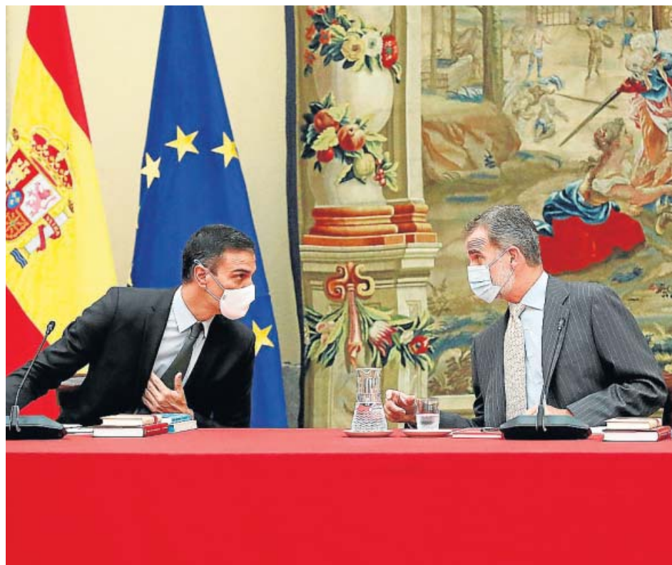
El presidente Sánchez y el rey Felipe VI en la reunión del Patronato del Instituto Cervantes.

El rey Felipe VI y el presidente del Gobierno, Pedro Sánchez, participaron ayer en la reunión anual del patronato del Instituto Cervantes, en la que fue su primera aparición juntos desde hace casi dos meses y que antecederá a la visita que harán ambos a Barcelona este viernes, con motivo de la New Economy Week. El cara a cara entre Sánchez y Felipe VI fue también el primero después del polémico veto del Gobierno a la presencia del monarca en la entrega de despachos a los nuevos jueces en Barcelona, hace solo once días. ●