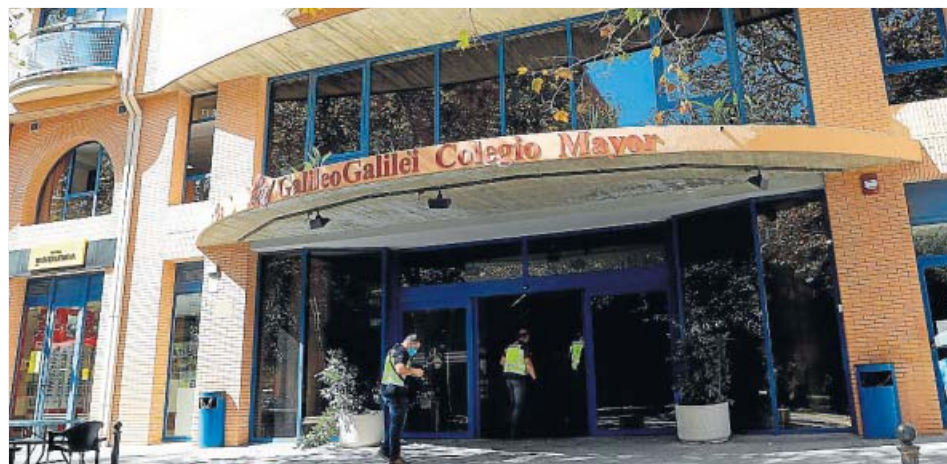
La Policía entra en el colegio mayor Galileo Galilei, origen del brote.

Tres agentes acudieron al colegio mayor para recabar información. El centro asegura que desconocía su celebración