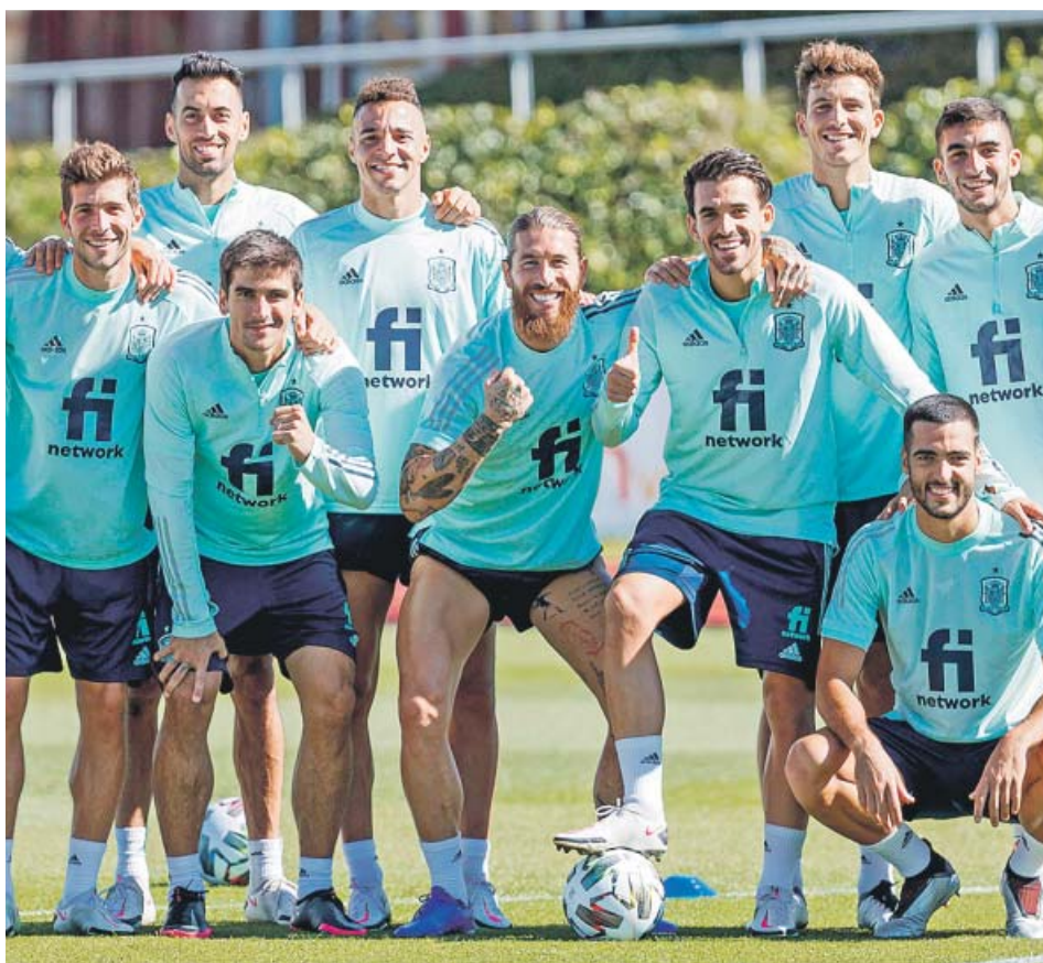
La selección posa en Las Rozas antes de poner rumbo a Portugal.

El Consejo de Ministros aprobó ayer, a propuesta del ministro de Cultura y Deporte, el Anteproyecto de Ley Orgánica de lucha contra el dopaje en el deporte, que «actualiza y moderniza el marco normativo existente, y adapta el ordenamiento jurídico español a las normas internacionales».