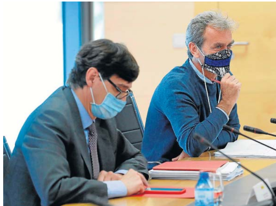
El ministro de Sanidad, Salvador Illa, y el director del Ccaes, Fernando Simón.

El ministro de Sanidad, Salvador Illa, comunicará hoy sus planes oficialmente a los consejeros autonómicos en la reunión semanal del Consejo Interterritorial de Salud. Según figura en un borrador que se trasladó a las comunidades en los últimos días, su intención es empezar a trabajar en una evaluación sobre la gestión de la pandemia en la que Illa quiere implicar también a las comunidades. Sigue así la lógica del PSOE en su propuesta al Congreso y Senado para crear una comisión mix-