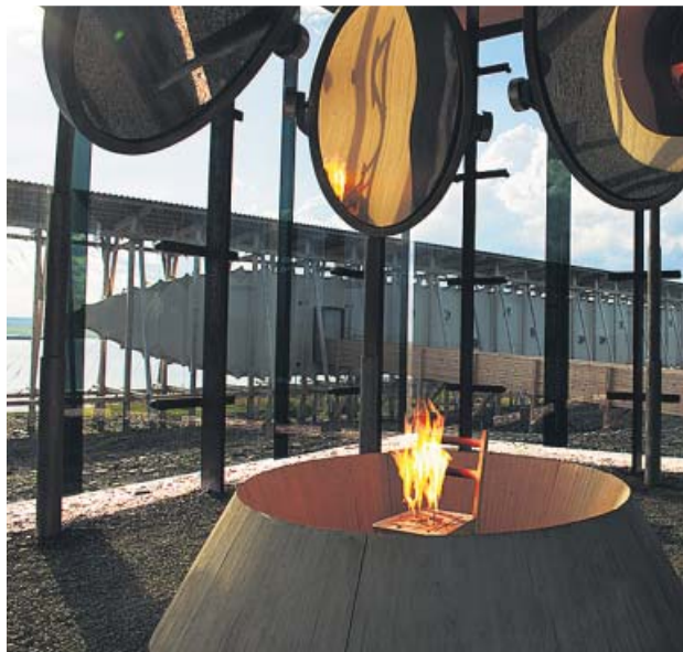
Memorial Steilneset, en Vardø (Noruega). BJARNE Riesto

El libro se apoya en el episodio histórico del primer gran juicio por brujería en la zona para imaginar a Maren, una joven de familia de pescadores a punto de casarse, y a Ursa, la esposa sobrevenida de un implacable y obsesionado