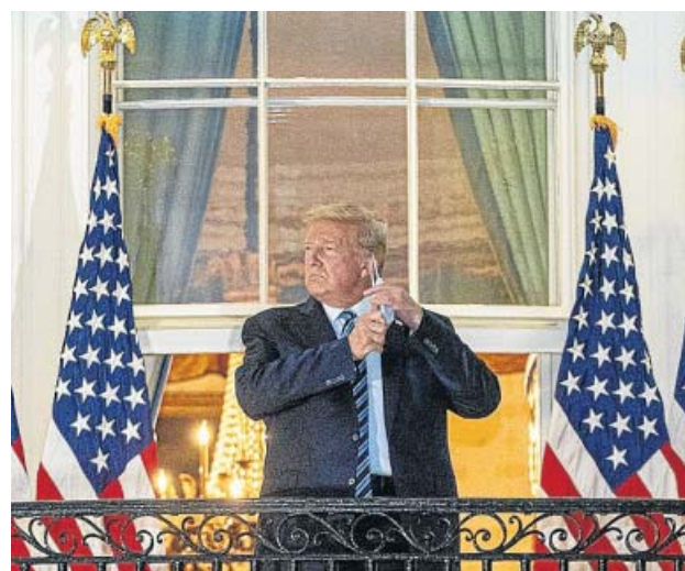
Trump se quita la mascarilla en su regreso a la Casa Blanca.

A pesar de ello, sigue minimizando el problema. «¡Se acerca la temporada de gripe! Muchas personas cada año, a veces más de 100.000 y, a pesar de la vacuna, mueren a causa de la gripe. ¿Vamos a cerrar nuestro país? No, hemos aprendido a vivir con eso, al igual que estamos aprendiendo a vivir con la Co-