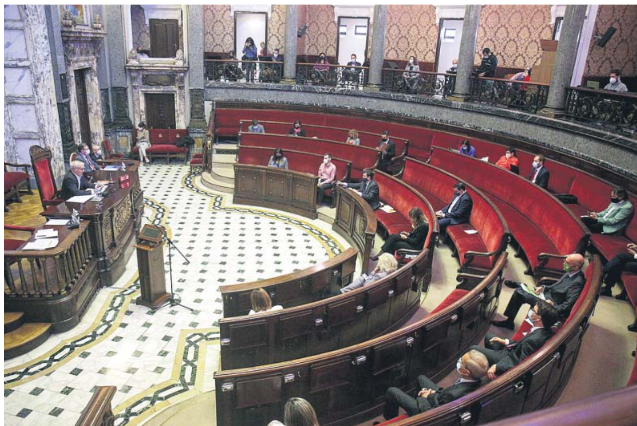
El hemiciclo municipal, durante el debate de ayer, con distancia de seguridad entre los miembros del pleno.

También está a punto de firmarse la cesión de un solar al CSIC para un centro de investigación de imagen molecular.