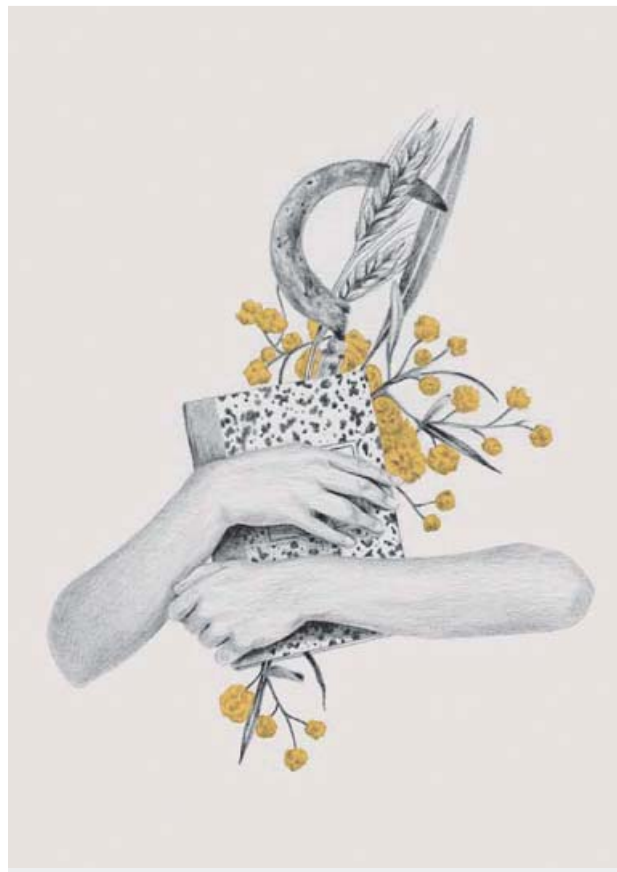
El proyecto nació como un cuaderno de notas. GEOPLANETA