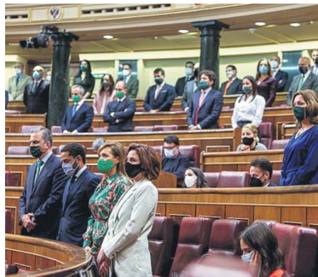
El grupo de Vox, de pie cuando Abascal leía los nombres.

Asimismo, el líder de Vox, que en algunos casos hizo mención a alguna víctima para comentar si era familiar de algún compañero suyo o militante de otro partido político, pidió al resto de diputados de su formación que no aplaudieran cuando arrancó