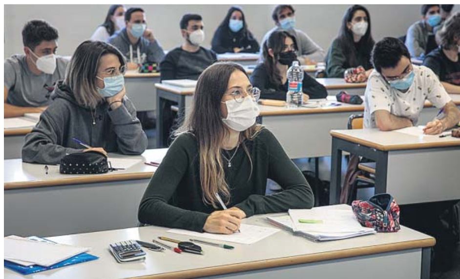
Alumnos de la escuela de Industriales de la Universidad Politécnica de Valencia.

«El conjunto de las comunidades han coincidido en que, según las informaciones de los rectores y los estudiantes, las aulas son seguras. Hay una proporción mínima de contagios en el recinto universitario. Respecto a lo que ocurre a veces en entornos que no son estrictamente docentes, como colegios mayores, residencias u otros lu-