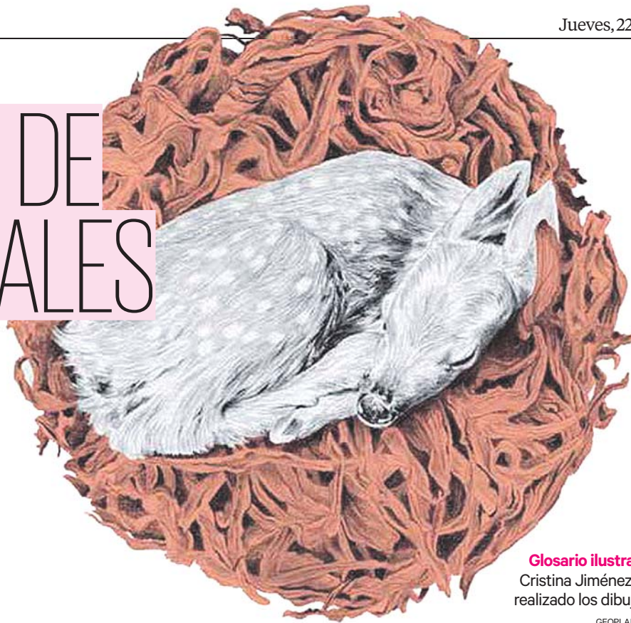
Glosario ilustrado Cristina Jiménez ha realizado los dibujos.

«En mi día a día trabajo por otras formas de producción en