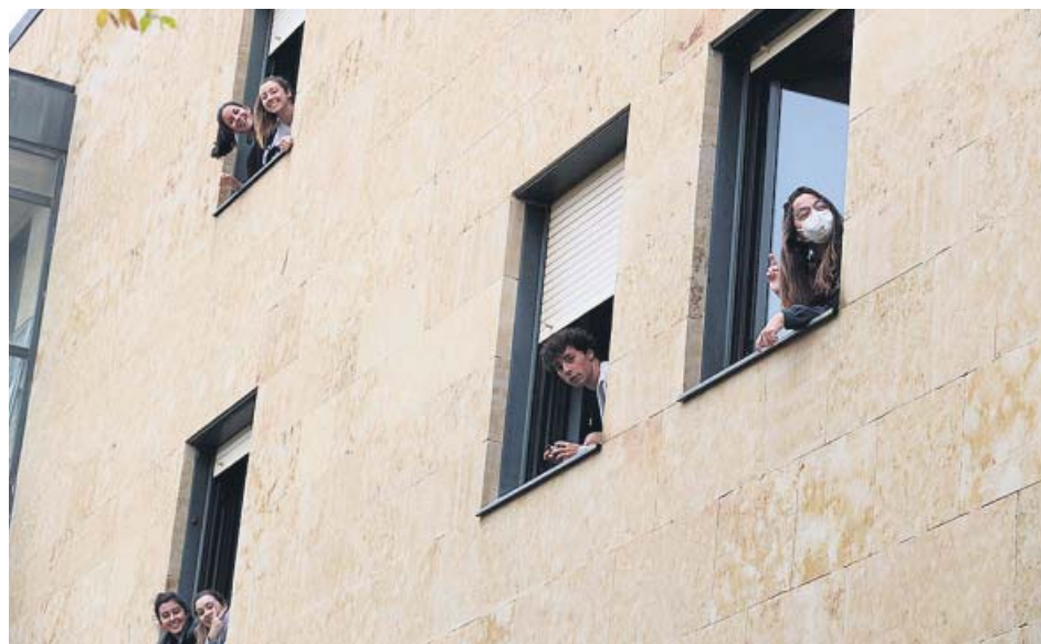
Confinamiento en el colegio mayor Oviedo de la Universidad de Salamanca.

«La herramienta Radar Covid para el rastreo puede tener una cabida satisfactoria en el espacio universitario»