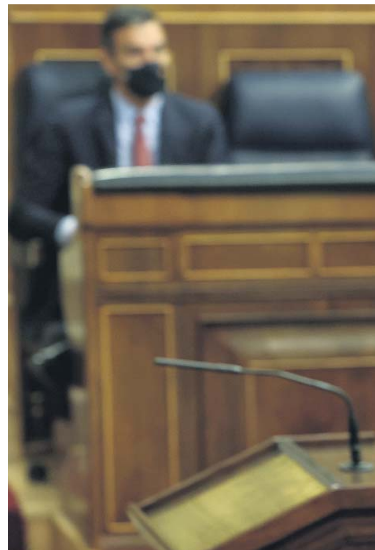
El candidato a la presidencia del Gobierno y presidente de Vox, Santiago

«Son ustedes un frente popular socialcomunista en alianza