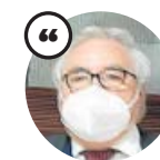
MANUEL CASTELLS Ministro de Universidades

«Algunas universidades han tenido que cerrar facultades y en cambio no se han cerrado los bares que había al lado»