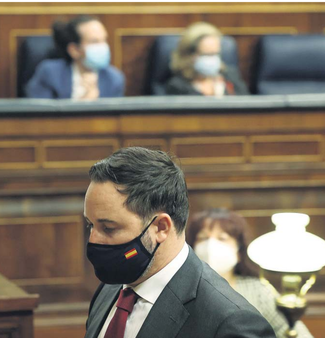
Abascal, pasa frente a la bancada del Gobierno ayer en el Congreso de los Diputados. EP

do que no le regale un éxito a la ultraderecha, que se volverá contra todos y contra usted, el primero», planteó Sánchez a Casado, al que señaló que «no es el beneficiario, sino el blanco» de la moción de Vox.