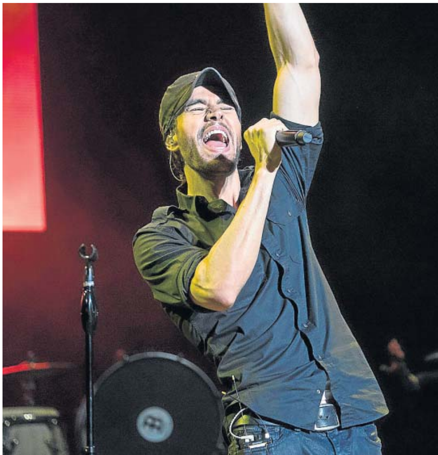
Enrique Iglesias, durante una actuación en 2018 en Nueva York (EE UU).