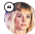
MAGGIE CIVANTOS Actriz

«Veo que el mundo de los videojuegos ha evolucionado hacia el cine. Tiene ingredientes que, vengas de donde vengas, te puede atrapar»