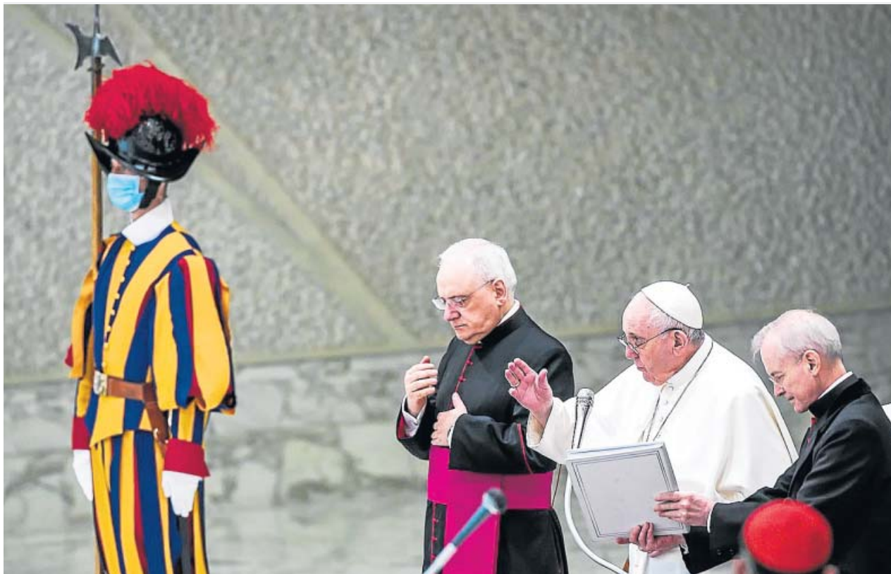
El papa Francisco atiende ayer a la audiencia en la sala Pablo VI, en la Ciudad del Vaticano.

a 20minutos que esas devoluciones no están cerradas, pues seguirá siendo cada juez el que decida si la cláusula es abusiva o no. La decisión del Supremo es, dice, «salomónica» y, aunque «supone un jarro de agua fría», no es «contundente»: «Seguiremos peleando». ●