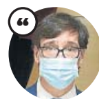
SALVADOR ILLA Ministro de Sanidad

«La herramienta Radar Covid para el rastreo puede tener una cabida satisfactoria en el espacio universitario»