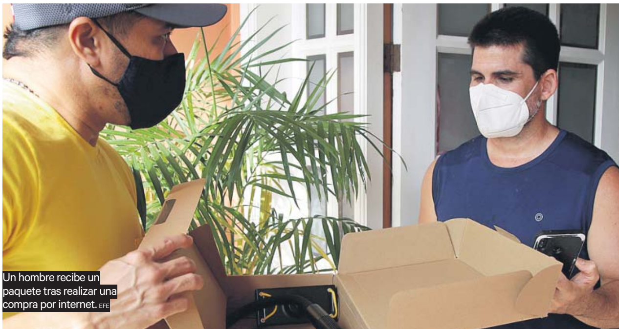
Un hombre recibe un paquete tras realizar una compra por internet.