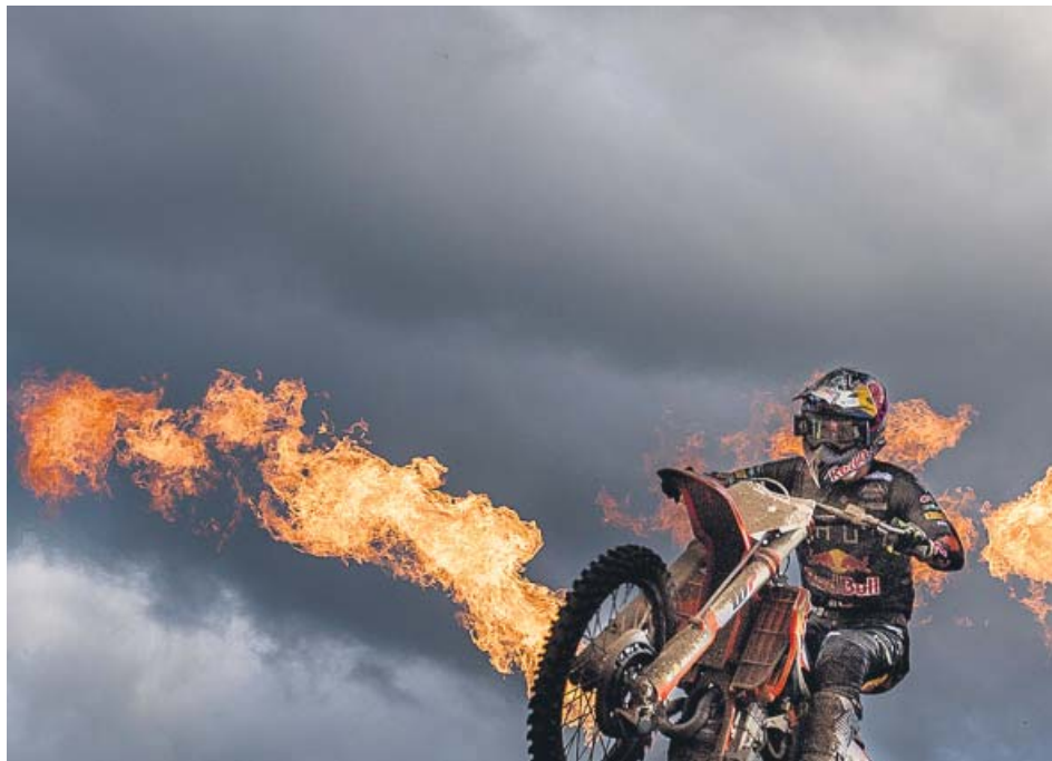
Prado celebra su victoria tras la carrera en territorio belga.

El piloto español de motocross Jorge Prado disputó y ganó ayer durante el GP de Limburgo, prueba perteneciente al Mundial de motocross disputada en Lommel (Bélgica), la victoria en la categoría MXGP. El GP de Limburgo, segunda de las tres pruebas que este año acoge la pista belga, fue la ocasión perfecta para volver a escuchar el himno nacional del joven piloto que ya suma tres grandes premios en su año de rookie en la clase máxima. ●