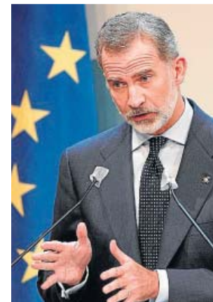
El rey Felipe VI interviene en el Congreso CEDE.

Acompañado de la vicepresidenta tercera del Gobierno, Nadia Calviño, y del presidente de la Generalitat, Ximo Puig, el rey utilizó el valenciano para dirigir sus primeras palabras a los asistentes, destacando la «alegría» que le produce siempre visitar València. En el Palau de les Arts, donde tuvo lugar el evento, Felipe VI transmitió «todo su ánimo y apoyo» a las empresas para superar la «grave» crisis que ha causado el coronavirus, «la peor que ha vivido el país en más de medio siglo». En ese sentido, des-