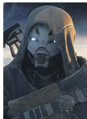
La Desconocida regresa en esta expansión.

Maggie Civantos es quien pone voz a La Desconocida, un personaje misterioso y que puede parecer frío, pero que tiene su parte vulnerable y emocional. «Me he sentido muy identificada, porque de alguna forma creo que ya he interpretado esto. Mis personajes siempre se han debatido entre la luz y la oscuridad», asegura la actriz de Vis a vis a 20minutos . De hecho, ella define como funda-