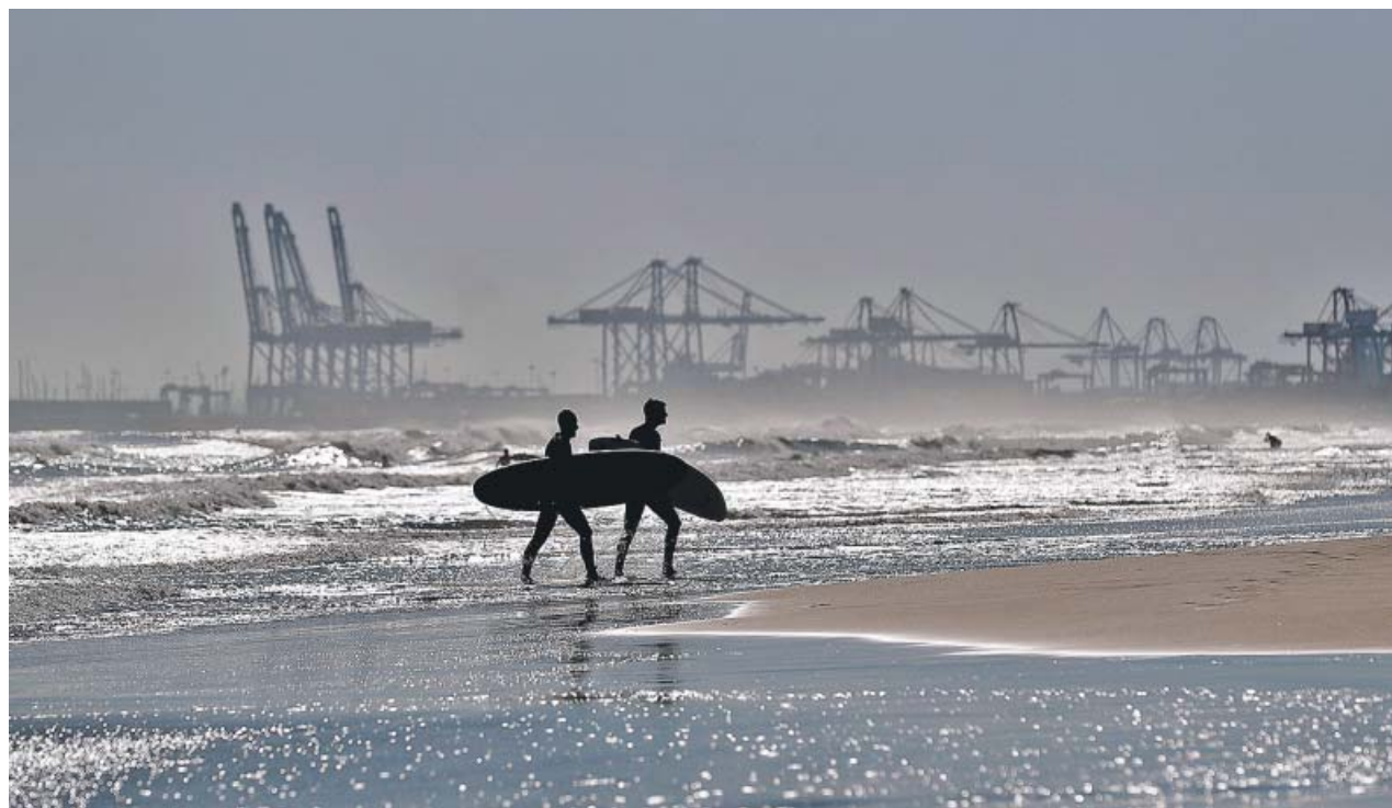
Dos surfistas aprovecharon ayer el buen tiempo para coger olas en la playa de La Malvarrosa de València.

Los cielos despejados y las temperaturas suaves llenaron este fin de semana de noviembre las playas del litoral valenciano de surfistas y todo tipo de deportistas que aprovecharon para acercarse al mar. Según la Aemet, esta tendencia se mantendrá y la semana comienza hoy con sol y hasta 17 grados en los termómetros. Mañana y el miércoles aparecerán algunas nubes, aunque las temperaturas apenas descenderán. Será el jueves cuando podrían llegar las primeras precipitaciones, que se extenderían hasta el fin de semana. ● R. V.