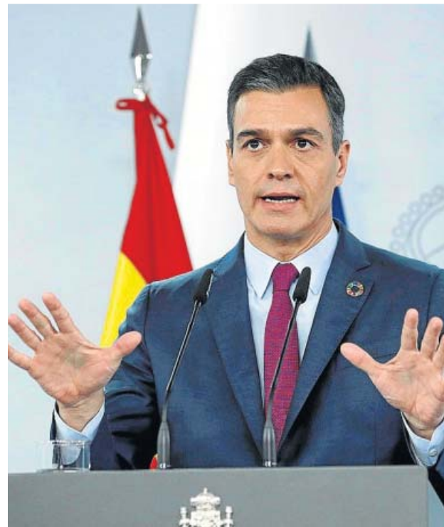
Pedro Sánchez, ayer, durante su comparecencia en Moncloa.

específica de una Navidad que va a ser distinta, pero segura. Este año tendremos que permanecer a distancia de nuestros seres queridos en vez de abrazarlos», sentenció. El objetivo no es otro que «evitar la tercera ola», una vez que la segunda ya está más controlada. De hecho, el líder del Ejecutivo comentó que ya hay en España una incidencia acumulada por debajo de los 400 casos por 100.000 habitantes en 14 días. Este dato no se daba desde finales de octubre. Sánchez resaltó que aún se está lejos de alcanzar el objetivo de 25 casos por cada 100.000 habitantes, pero resaltó la trascendencia de este descenso y que cree que demuestra el éxito de las decisiones del Gobierno y de las medidas adoptadas por las comunidades autónomas. «El estado de alarma y la cogober-