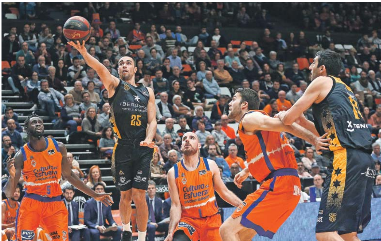
Un lance de juego en el partido de la Liga ACB entre el Valencia y el Tenerife en la Fonteta.

Dos de las piezas más codiciadas del mercado de la NBA eran dos españoles. Serge Ibaka fichó ayer por Los Angeles Clippers, un claro candidato al anillo para la temporada que viene. Por Marc Gasol hay una dura pugna y le quieren los tres últimos campeones: los Raptors (su último equipo), los Warriors y los Lakers.