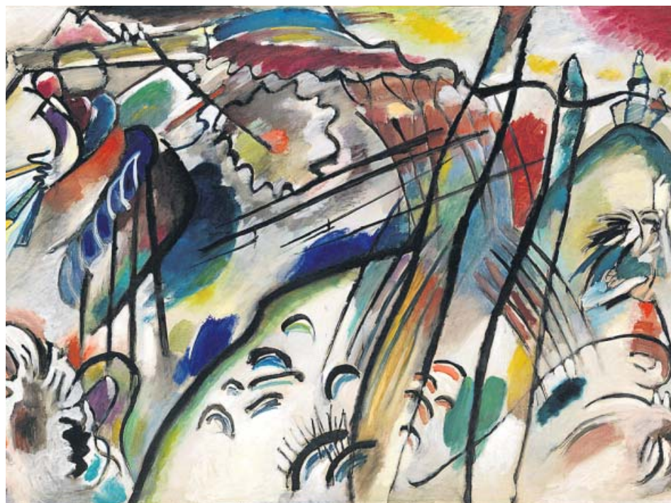
'Improvisación 28 (2a versión)'. Solomon R. Guggenheim Museum, NY.

El Museo Guggenheim de Bilbao ha inaugurado una exposición de pinturas y obras sobre papel de Vasily Kandinsky (1866-1944), que se podrá visitar hasta el 23 de mayo de 2021. La muestra refleja la evolución del artista ruso, que comenzó a estudiar pintura en Múnich en 1896, cuando ya había cumplido 30 años, y fue un precursor de la abstracción, además un reconocido teórico de la estética. Las obras proceden de la Fundación Guggenheim de Nueva York.