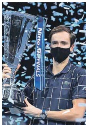
El ruso Daniil Medvedev, con el trofeo de Maestro.

Con su resistencia impertérrita y su juego cuadrado y ortodoxo, Medvedev tomó el relevo de Nikolay Davydenko, el anterior ruso en ganar las