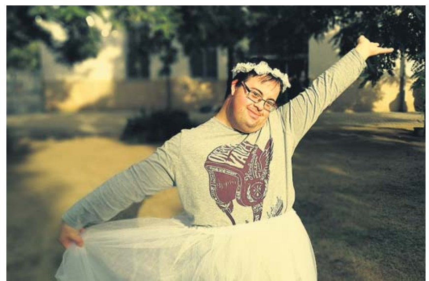
La fundación ofrece ayudas a proyectos de fotografía, literatura, música, artes...

«Es crucial entender los tipos de focos y patrones de transmisión, dado que las intervenciones deben centrarse en todos los focos con un alto riesgo de evento supercontagador y en limitar las reuniones sociales en estos lugares», concluyen los investigadores, que alertan sobre el riesgo de levantar las medidas restrictivas «hasta que las rutas de transmisión sean bien entendidas». ●