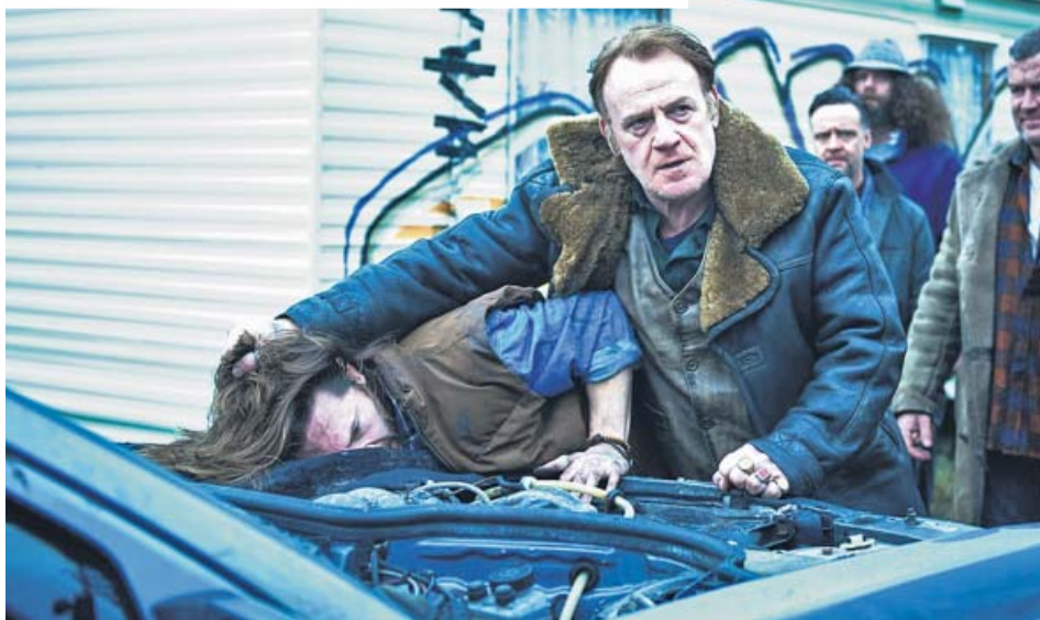
Gareth Evans firma este thriller lleno de acción ambientado en Londres. SKY ATLANTIC / STARZPLAY

Tras triunfar en el Reino Unido y renovar por otra temporada, 'Gangs of London' llega a Starzplay. ¿Estás preparado?