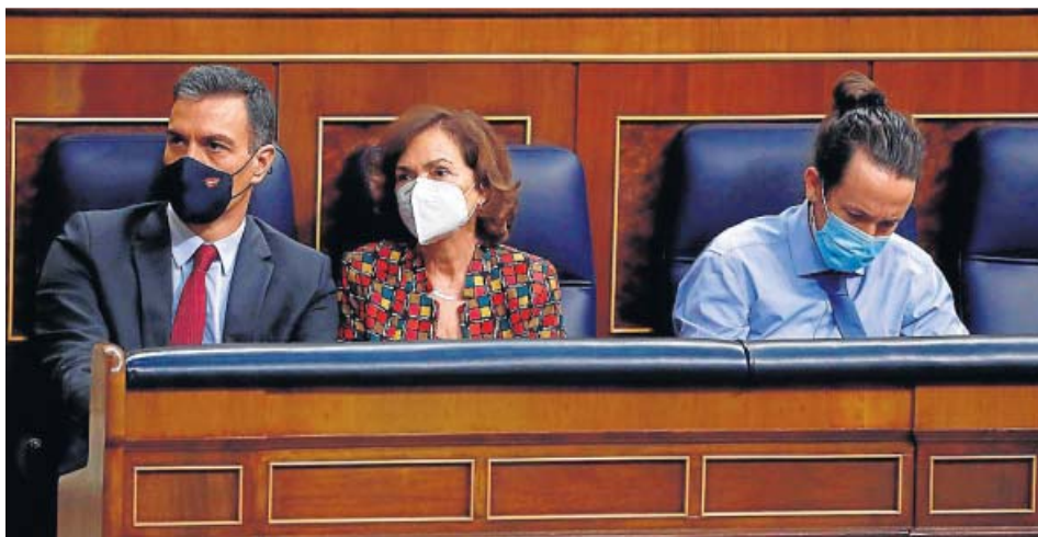
Pedro Sánchez, Carmen Calvo y Pablo Iglesias.

Corren malos tiempos para la unidad del Gobierno de coalición entre PSOE y Unidas Podemos. Su continuidad no está en absoluto amenazada, pero a las puertas de encarar las semanas clave para la aprobación de los Presupuestos Generales del Estado, los socialistas y la formación morada mantienen abiertos tres frentes que han pasado de la discreción del Consejo de Ministros a la discrepancia pública y abierta.