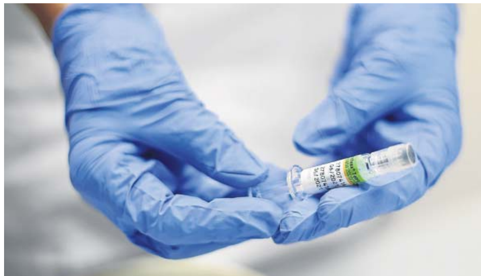
Un profesional sanitario prepara una dosis de la vacuna antigripal.

Fuentes sindicales y de la propia Conselleria de Sanidad Universal y Salud Pública coinciden en que el problema no tiene su origen en el número de dosis adquiridas, sino en la logística de su distribución y sobre todo de