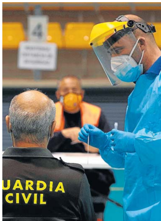
Un sanitario toma una muestra para un cribado en Córdoba.

Además, los datos a más corto plazo son mejores todavía. Salvo Asturias y Cantabria, todas las comunidades redujeron su incidencia en la última semana.