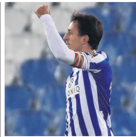
Oyarzábal aumentó la distancia en el Pichichi.

★ Champions League ▲ Europa League ▼ Desciende a segunda