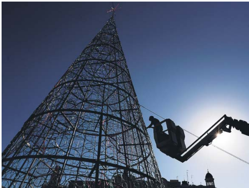
Operarios municipales ultimaban la semana pasada el árbol de la plaza del Ayuntamiento.

LA NAVIDAD preocupa por una posible relajación social como la vivida este pasado fin de semana. LAS MEDIDAS deben seguir para evitar un repunte, según los expertos, que prevén que llegue una 3.ª ola. LA VACUNACIÓN de la mayor parte de la población se hará en verano, cuando se relajarían restricciones