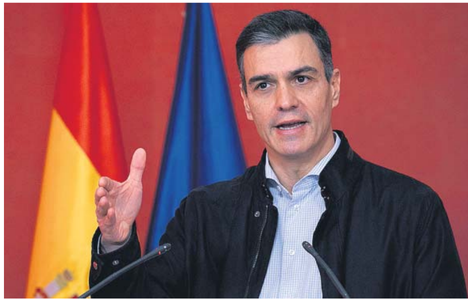
El presidente del Gobierno, Pedro Sánchez, el pasado sábado.

La ejecutiva de ERC confirmó el miércoles pasado su apoyo a los Presupuestos, un día después de que lo hiciera el PNV y de la misma forma que lo hizo el viernes la militancia de EH