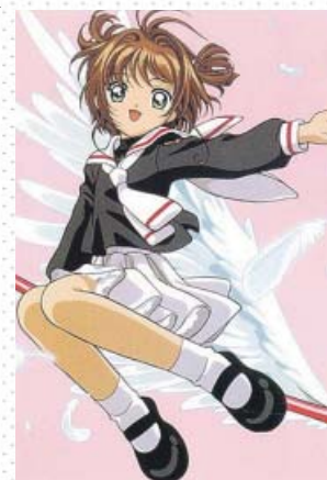
Sakura Kinomoto es la protagonista del anime.

franquicia, es parte de su encanto), sino por la guerra que enfrenta a los fans ya veinteañeros de show contra los viejales que aún juramos por Sailor Moon . Pese a ello, y aunque servidor quiere a Usagi Tsukino como a una hermana, tiene que admitirlo: con su mezcla de drama, fantasía y jovialidad, esta serie es una introducción perfecta para que hijos, sobrinos o hermanos pequeños (o uno mismo, qué diantre) descubran los placeres de la animación japonesa.