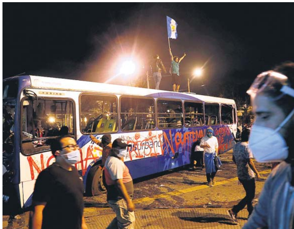
Un grupo de radicales prendió fuego a un autobús frente a la oficina del Gobierno.

Miles de guatemaltecos han vuelto a tomar las calles este fin de semana para pedir la dimisión del presidente del país, Alejandro Giammattei, y del resto de diputados y la creación de una Asamblea Nacional Constituyente. Las protestas empezaron la semana pasada por el rechazo social a un proyecto de presupuestos aprobado por el Congreso. Sin embargo, pese a que este proyecto fue retirado, el descontento hacia la clase política persiste. En las manifestaciones hubo al menos 40 detenidos y heridos. ●