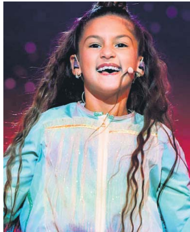
La sevillana interpreta Palante en 'Eurojunior'.