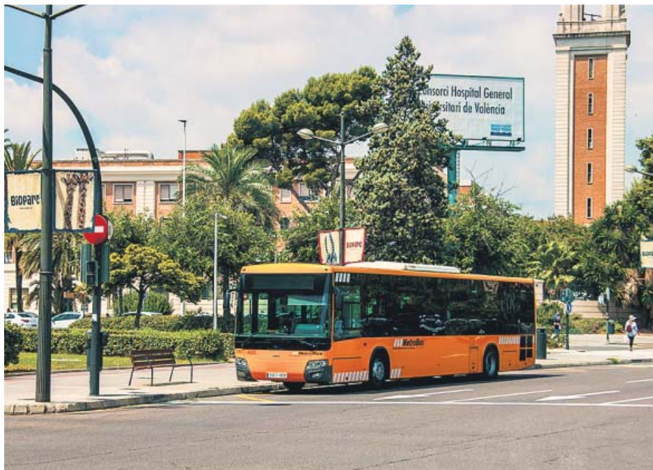
Un convoy de MetroBus, a su paso por la ciudad de València.

20M.ES/VALENCIA Consulta todas las noticias de la actualidad valenciana en nuestra página web