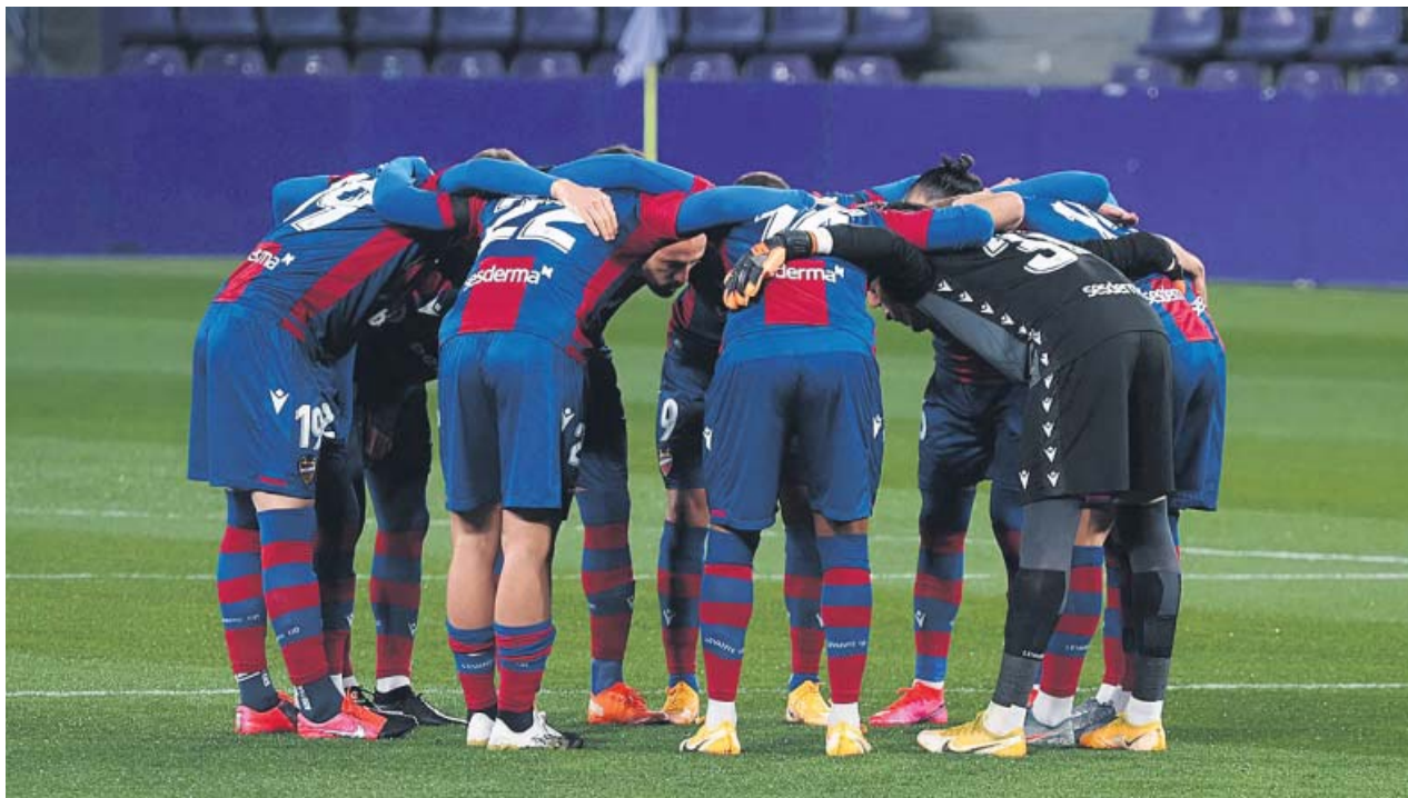
Los jugadores del Levante se conjuran antes del partido de la última jornada ante el Real Valladolid.

EL EQUIPO VALENCIANO vive en un bucle, con cinco empates seguidos y en descenso NI EL BANQUILLO ni la dirección deportiva hallan la fórmula para acabar con la crisis