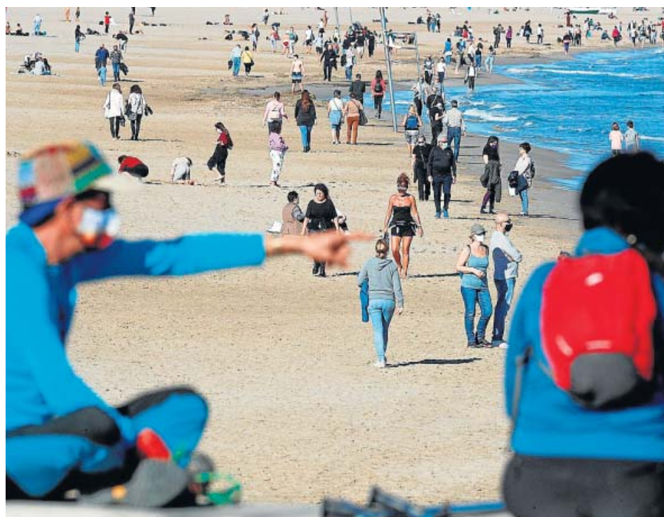
Mucha gente aprovechó para despejarse dando un buen paseo por la Malvarrosa.

Segundo fin de semana de diciembre y los termómetros alcanzaron los 20°C. Este clima, como no podía ser de otra forma, condujo ayer a los valencianos hasta la orilla de la Malvarrosa —y hasta dentro del agua a los surfers y a los más atrevidos— para disfrutar del buen tiempo en su día libre. Los más frioleros llevaron consigo una chaqueta, pero los hubo que optaron por los tirantes y pantalones cortos, como se puede apreciar en la imagen. Hoy la máxima será de 17°C, pero mañana volverá a subir a los 20°C. ●