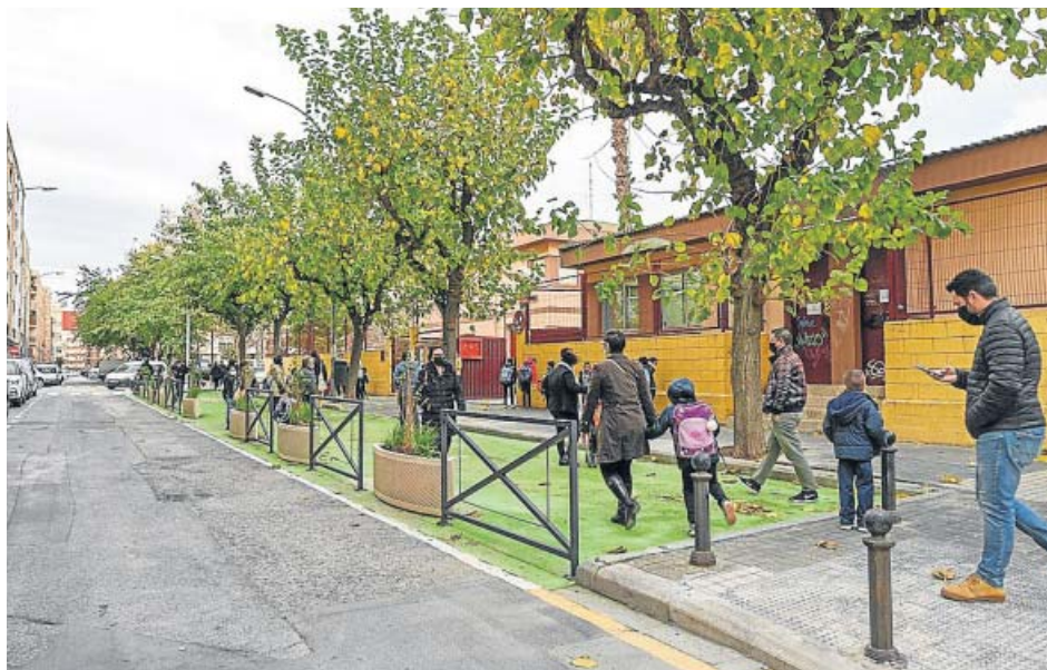
La entrada del CEIP Carles Salvador, ampliada con maceteros y pintura verde en el suelo.

Varios colegios y sus respectivas ampas, hartos de esta situación que se repite a diario, han pedido al Ayuntamiento de Valencia que haga algo para acabar con ella. El último ha sido el CEIP Mestalla, que la semana pasada solicitó al Consistorio que tome cartas en el asunto. Con él, ya son 11 los colegios que han hecho este tipo de petición al Ayuntamiento desde que arrancó el curso es-