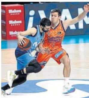
Un lance del partido Estudiantes-Valencia.

Los madrileños se sintieron cómodos ante las facilidades de los levantinos en defensa y