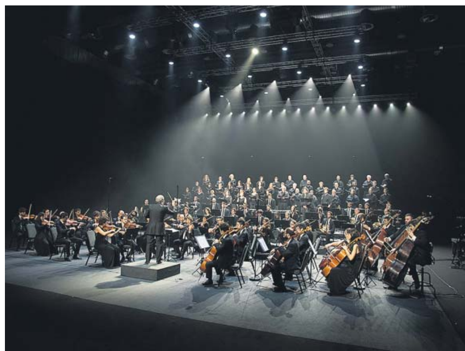
Josep Pons dirige la Orquesta Sinfónica Camera Musicae. FUNDACIÓN LA CAIXA

El secretario de Estado de Medios de Comunicación del Reino Unido ha dicho en la Cámara de los Comunes que Netflix debe advertir de que la serie The Crown es una «dramatización» basada en «especulaciones».