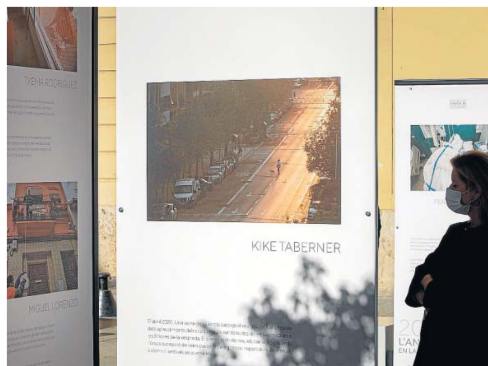
Un visitante recorría ayer la exposición organizada por la Diputación de Valencia.

Calles desiertas tomadas por bandadas de aves; las UCI repletas de personas que tratan de combatir al enemigo inesperado de la Covid-19; agentes de seguridad y ciudadanos que aplauden a sanitarios descompuestos en su lucha contra la pandemia... Eso muestran algunas de las imágenes que resumen un año complicado y que forman parte de la exposición 2020 L'Any de la pandèmia en la mirada del fotoperiodista , que ya se puede ver en la plaza Manises hasta el día 29. ●