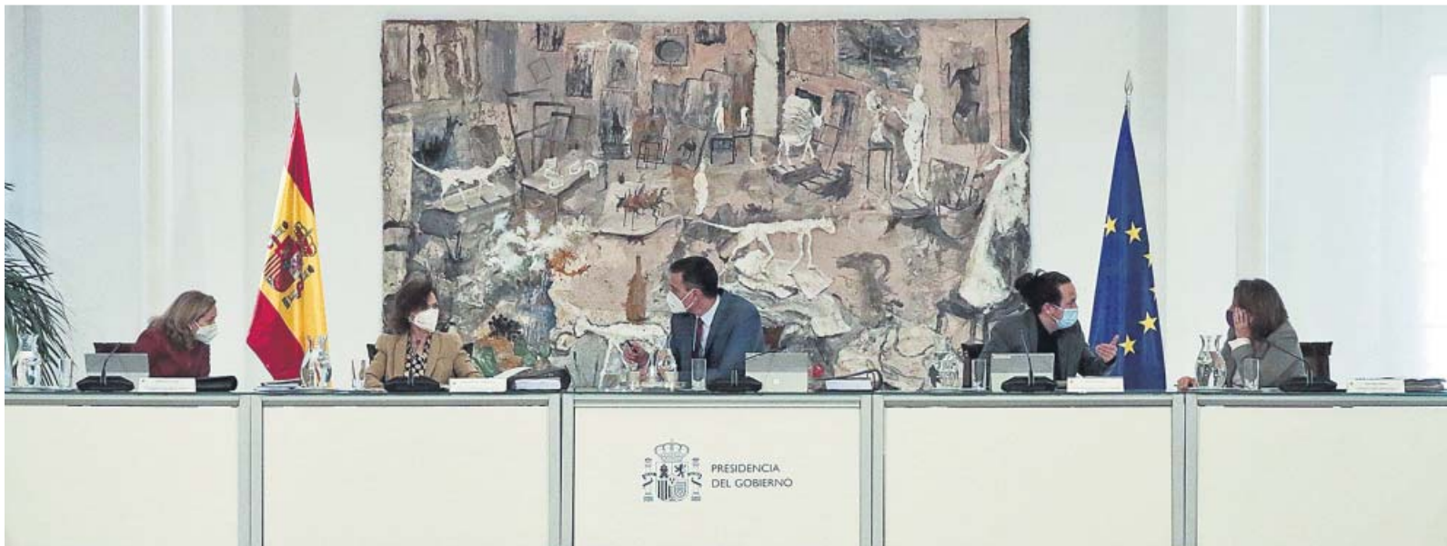
El presidente Pedro Sánchez rodeado de los cuatro vicepresidentes: de izquierda a derecha, Nadia Calviño, Carmen Calvo, Pablo Iglesias y Teresa Ribera.