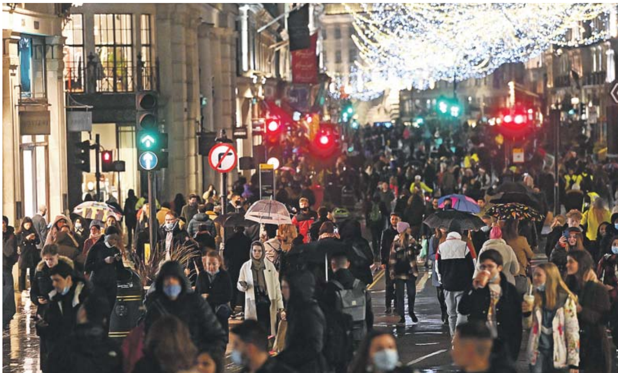
Ciudadanos realizan compras navideñas en el centro de Londres el fin de semana que Johnson endurece las restricciones.