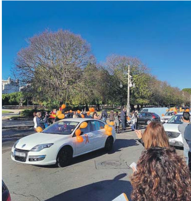
La caravana de coches, ayer, en el centro de Valencia.

En un manifiesto leído al final de la protesta, la plataforma convocante –en la que se agrupan asociaciones de padres y madres, organizaciones empresariales y también sindicales, entre otras– volvió a censurar que la reforma educativa, la octava desde que