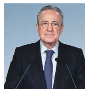
Florentino Pérez, durante la Asamblea del Real Madrid.

La postura del Real Madrid queda bastante clara y ahora fal-