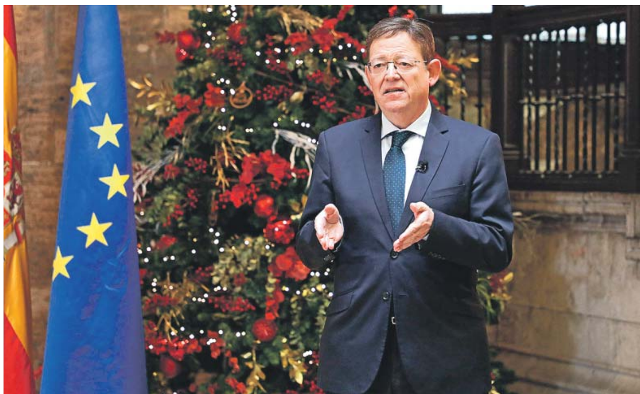
El president de la Generalitat, Ximo Puig, ayer, durante su mensaje institucional.

BALANCE A MITAD DE FIESTAS. La Junta ha dividido las Navidades en dos tramos. En el actual, que durará hasta el domingo 27