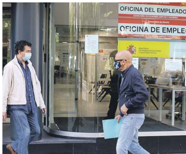
Dos hombres ante una oficina de empleo, en Madrid.

A cierre del tercer trimestre, en España se contabilizaban casi 16,7 millones de inactivos por distintas causas, entre ellas la jubilación, recibir cursos de formación, el cuidado de menores o dependientes, y no buscar empleo por pensar que no se va a encontrar (desanimados).