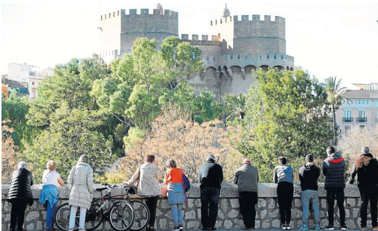
Padres y familiares observan los partidos de fútbol de categorías inferiores desde el pretil del viejo cauce del río Turia.

Ya han empezado los trabajos de plantación de la platabanda de la sala hipóstila del Museo de Historia de València. Las especies elegidas —lamiáceas, agaváceas, asparagáceas, aizoáceas, euphorbiáceas, bromeliáceas, crasuláceas y palmitos— necesitan poca agua y esto evitará filtraciones y goteras.