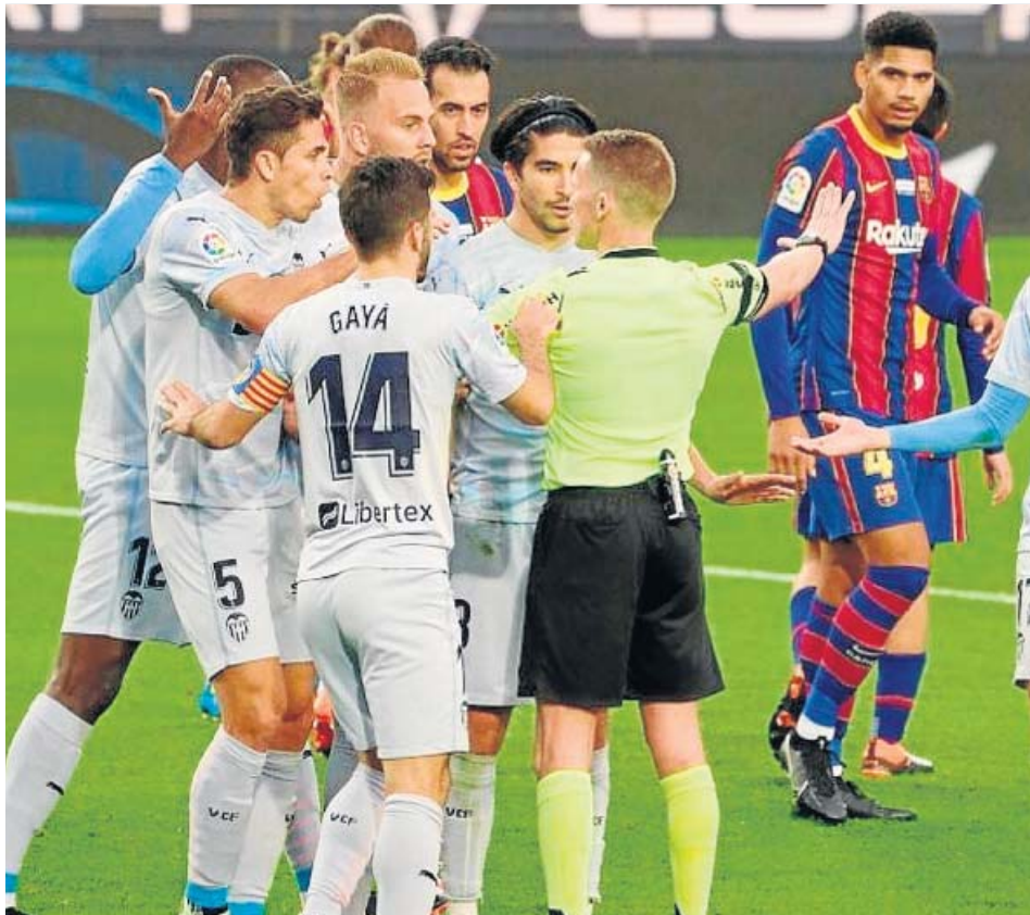
Los jugadores del Valencia le protestan una acción a Hernández Hernández. EP

R. R. Z. deportes@20minutos.es / @20mDeportes