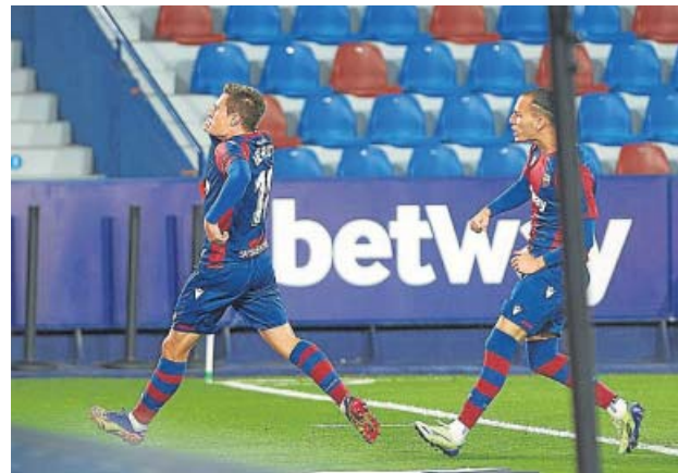
Los jugadores del Levante celebran un gol a la Real.

Al cuadro valenciano le faltó eficacia a raudales en las dos áreas. Desde el banquillo, Paco López usó sistemas distintos y puso sobre el campo a