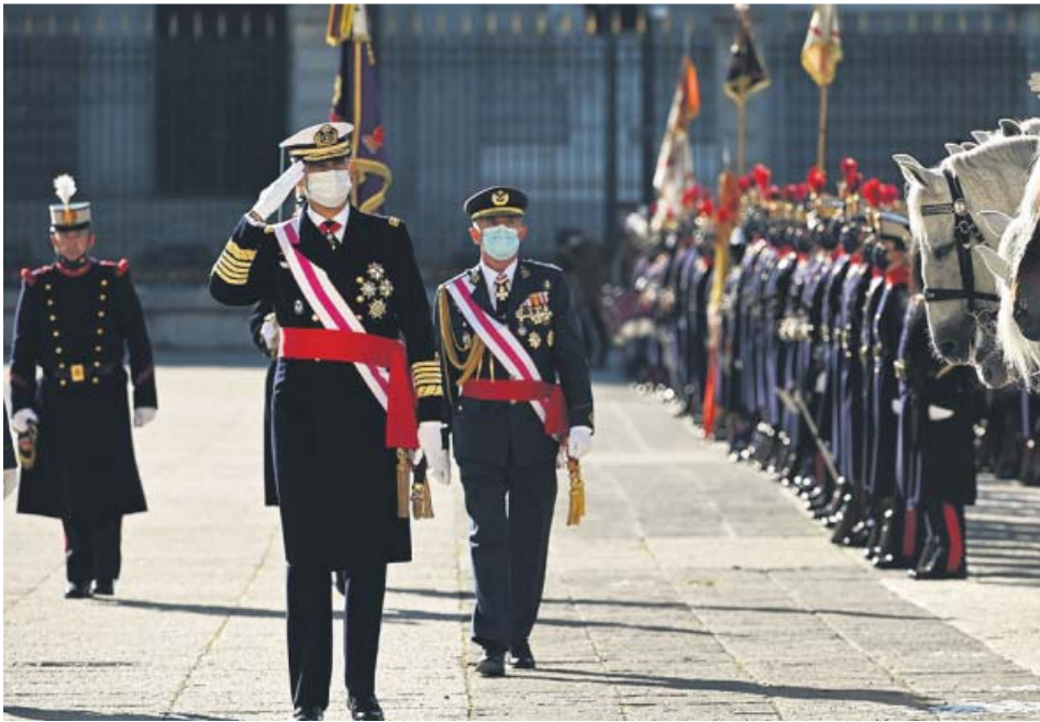
El rey Felipe VI pasa revista a las tropas en la Pascua Militar celebrada ayer.