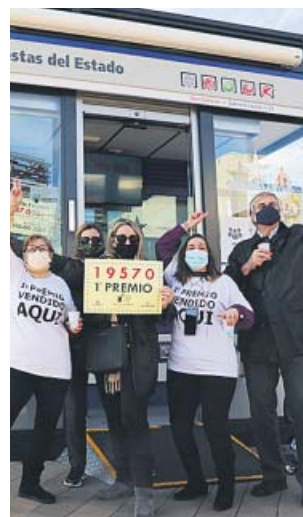
Celebración del primer premio ayer en Getafe.

Este establecimiento, ubicado en el paseo Cortes de Aragón, ha repartido unos 40 millones de euros entre sus clientes y los del bar, cercano a la