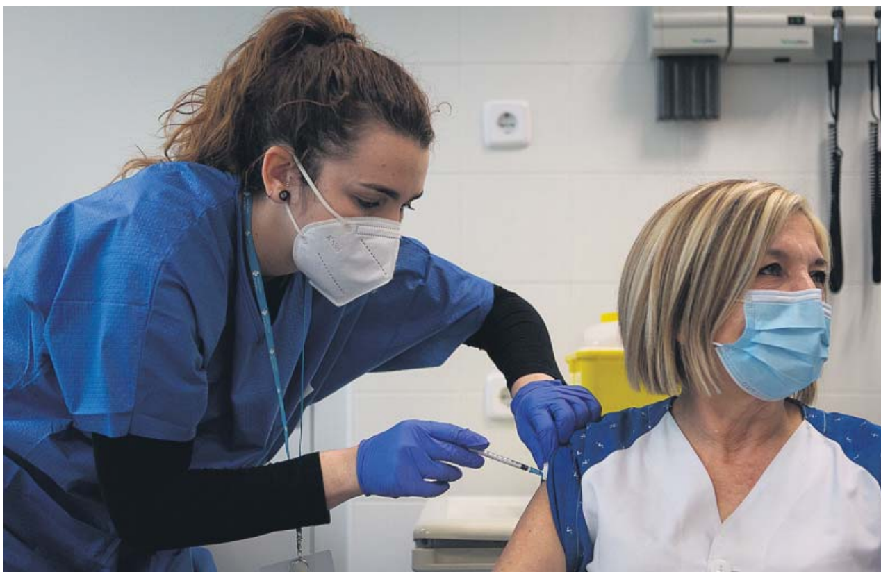
Una enfermera pone la vacuna de Pfizer a una sanitaria en un centro asistencial de Barcelona.