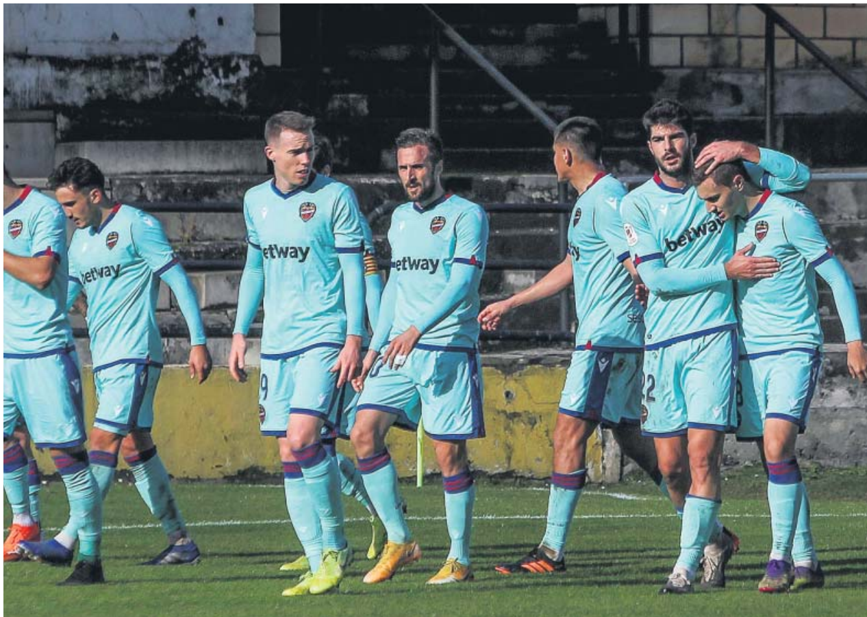
Los jugadores del Levante celebran uno de los dos tantos logrados ayer.