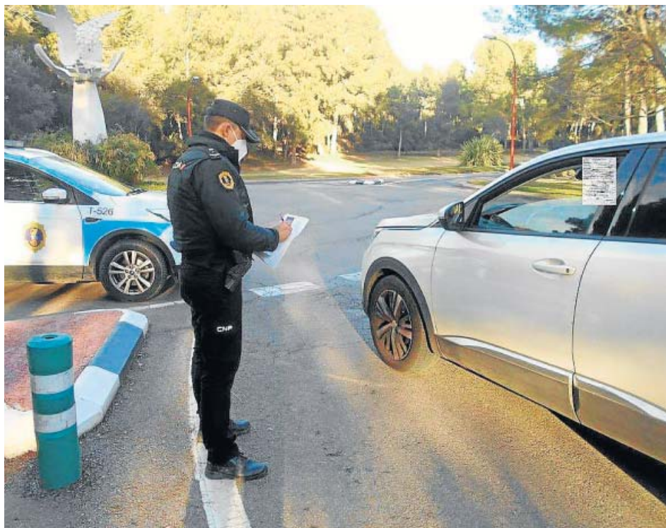
La Policía de la Generalitat intensificó el fin de semana los controles en Cheste.

No se sabe si las pretensiones de Puig irían en ese sentido. Lo único que dijo el president es que lo que hagan será «desde el convencimiento de que no hay disyuntiva entre salud y economía y de que no hay medidas neutras ni inocuas. Todas tienen un coste, un daño y un impacto social, físico y psicológico. Por eso se tienen que ponderar desde el rigor máxi-