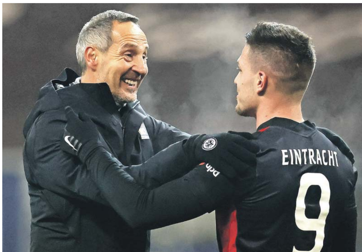
Luka Jovic celebra uno de sus goles con Adi Hütter, entrenador del Eintracht de Frankfurt.