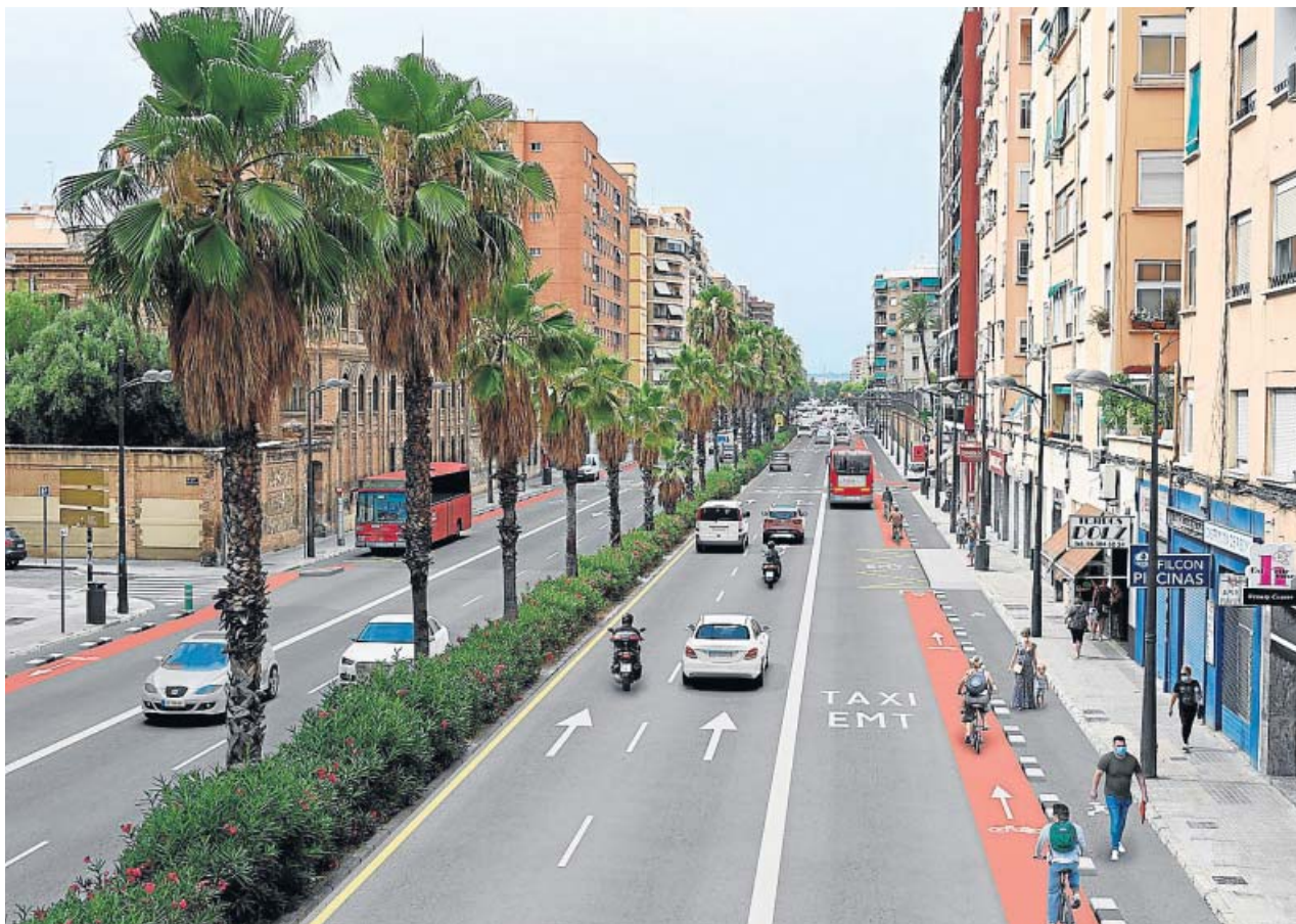
Figuración virtual de la avenida tras la intervención de urbanismo táctico.