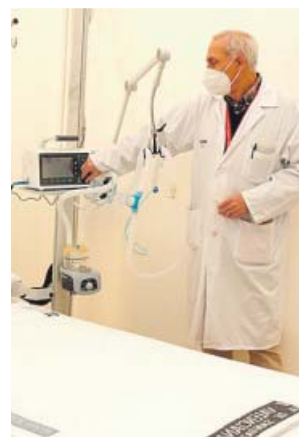
Un sanitario de un hospital de campaña en La Fe.

No obstante, el president del Consell señaló que hay habilitadas 931 camas nuevas en los hospitales auxiliares de campaña, en espacios adicionales y en