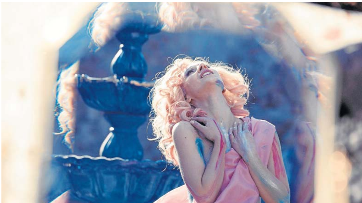
La actriz británica Juno Temple interpreta a Lucy Savage.