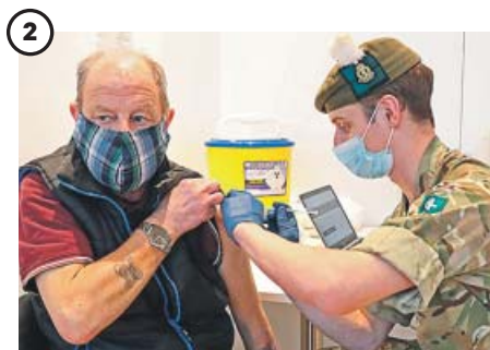
Problemas con la cepa sudafricana

Un hombre es vacunado en Jerusalén. Con más del 30% de su población vacunada en tan solo un mes y medio, Israel está funcionando como un laboratorio global de la vacuna: las primeras cifras demuestran su efectividad, pero los expertos insisten en que aún falta información concluyente.