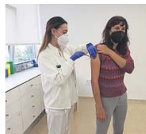
Vacunación en el centro de salud de Bellreguard.