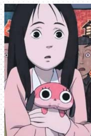
Tsukiko y Maromi, de Paranoia Agent . FILMIN

Y, así como Lynch usa el inconsciente colectivo de EE UU como arcilla para sus trabajos, Kon convirtió Paranoia Agent en una puesta en solfa de su propia cultura: la tiranía del