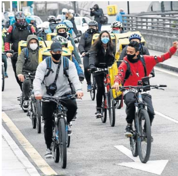
Manifestación en contra de la ley rider.

La ley rider lleva siendo «inminente» desde hace meses y fuentes sindicales acusan del retraso a la CEOE y a su desinterés en regular el sector de las plataformas digitales. El mismo que sindicatos y el Ministerio de Trabajo atribuyen a Calviño, que —además de sacar del documento enviado a Bruselas la obligación de que Deliveroo, Glovo o