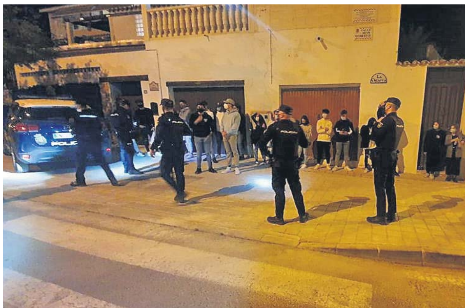
La Policía reunió a los jóvenes en una zona más accesible para identificarlos.

La petición de que «nadie actúe irresponsablemente» la hizo Ximo Puig tras conocer que el segundo fin de semana de cierre perimetral de las grandes ciudades de la Comunitat había dejado hasta ayer