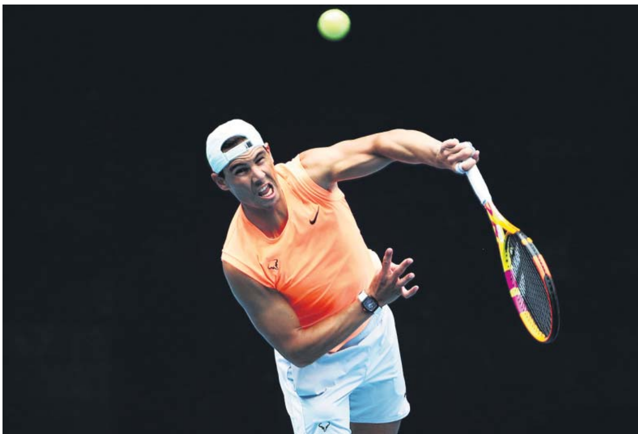
Rafa Nadal entrenando el servicio, cuyo movimiento le ocasiona los dolores de espalda al tenista de Manacor.