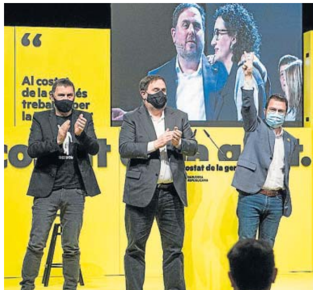
Otegi, Aragonès y Junqueras, ayer, en el mitin de ERC.