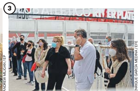
Latinoamérica avanza con mayor lentitud

La vacuna de AstraZeneca ofrece una protección limitada frente a la cepa sudafricana, según un estudio de la Universidad de Oxford. En la foto, un militar británico vacuna a un ciudadano.