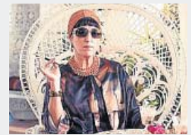
La actriz manda en la noche del Tánger de 1955

Rossy de Palma «En los rodajes me interesa la parte humana»