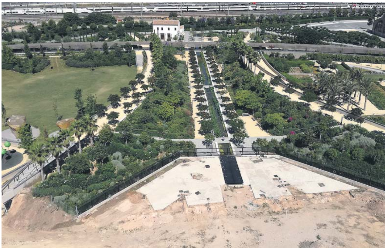
Zona del parque en la que se han retomado las obras. VALÈNCIA PARQUE CENTRAL

SE REINICIAN las obras pendientes de ejecutar en la parcela que ocupaba un concesionario