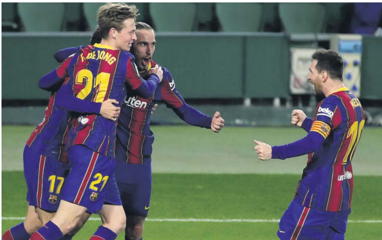
El argentino del Barça Leo Messi (d) celebra con sus compañeros el tercer gol ante el Real Betis.

★ Champions League ▲ Europa League ▼ Desciende a segunda