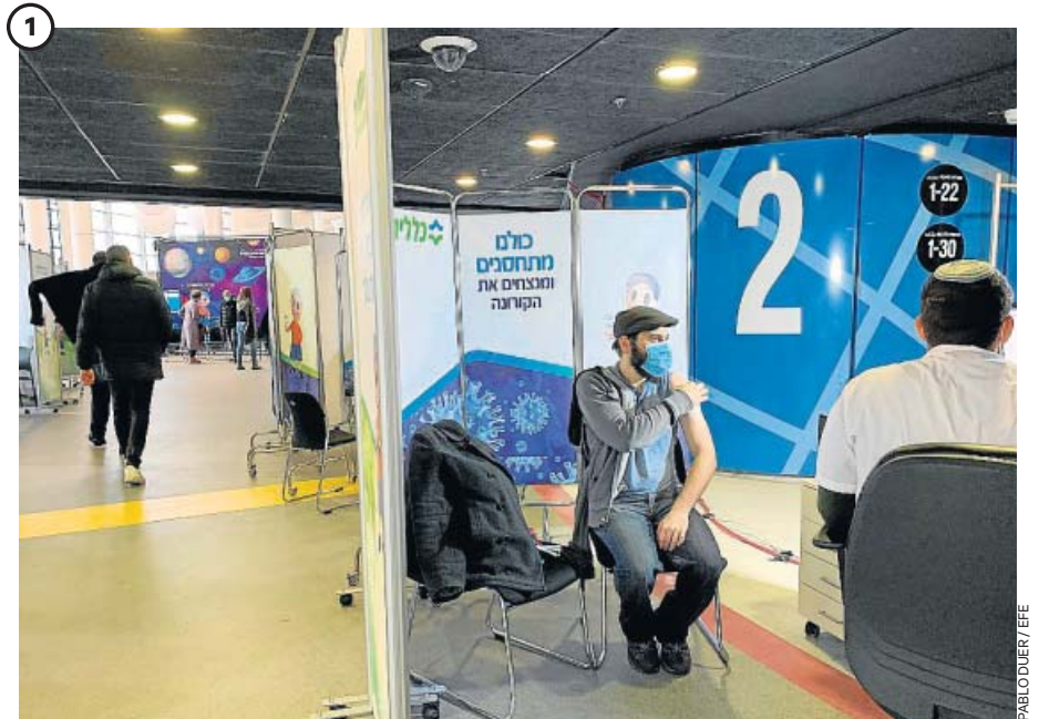
‘Vacunódromo’ en Israel, el laboratorio global de la vacuna contra la Covid-19

Un hombre es vacunado en Jerusalén. Con más del 30% de su población vacunada en tan solo un mes y medio, Israel está funcionando como un laboratorio global de la vacuna: las primeras cifras demuestran su efectividad, pero los expertos insisten en que aún falta información concluyente.