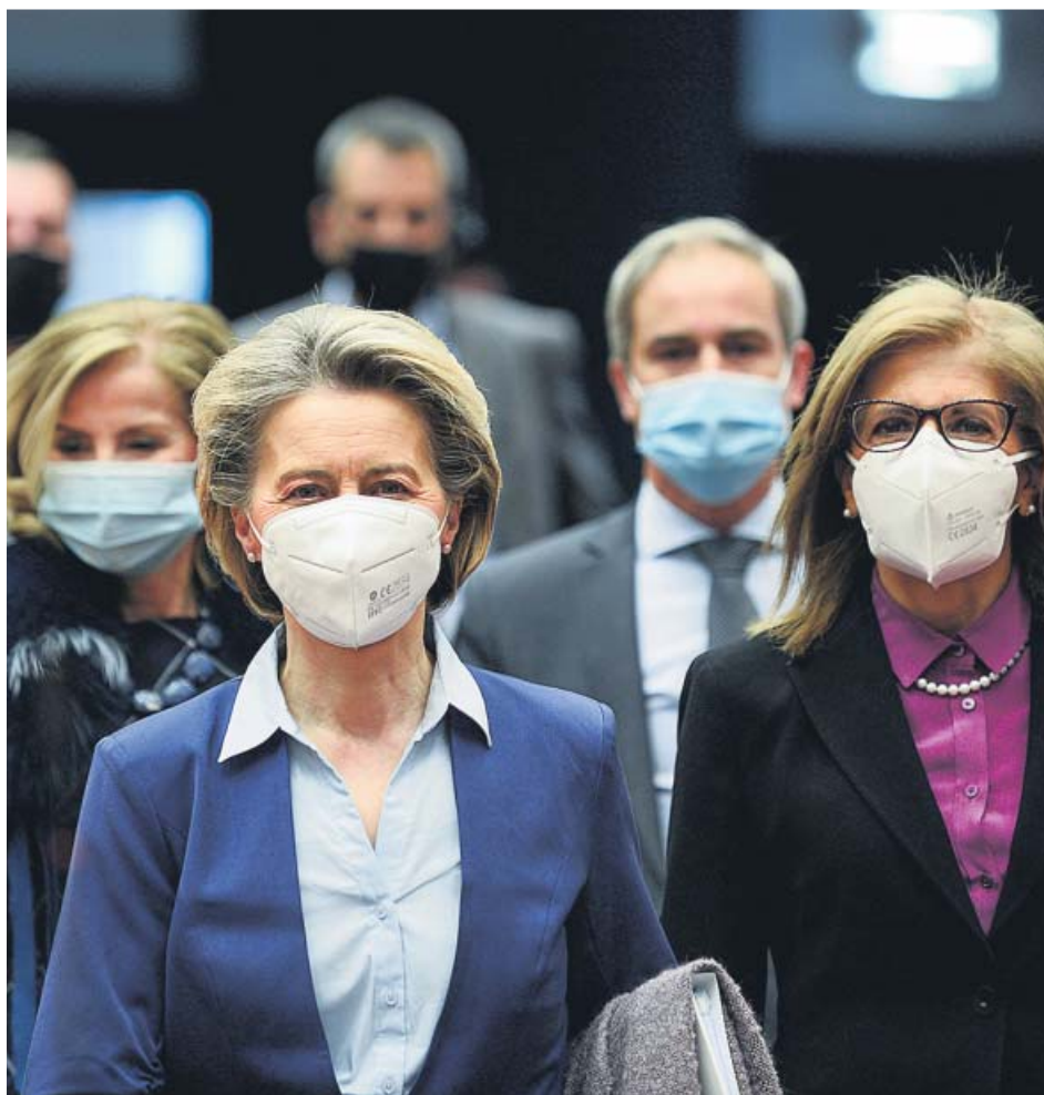
La presidenta de la Comisión Europea, Ursula von der Leyen, ayer en el Parlamento Europeo.

La científica jefa de la OMS, Soumya Swaminathan, considera que para los países que aún no han empezado a vacunar con estas dosis, el inicio de la vacunación supondría que los «beneficios superen con creces los riesgos», incluso en aquellos por los que circulan las variantes. En este sentido, resalta que las respuestas inmunitarias inducidas por la vacuna en las personas mayores están «bien documentadas» y transmiten «seguridad». ●