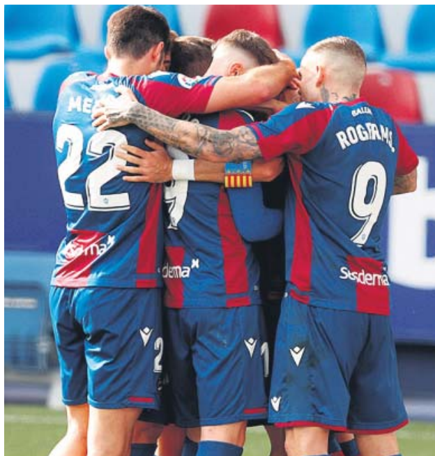
Los jugadores del Levante celebrando un gol ante el Granada.

El equipo valenciano lleva una trayectoria brillante en este 2021, pues solo ha perdido un partido entre Liga y Copa y fue en el primer encuentro del año ante el Villarreal en La Cerámica. El cami-