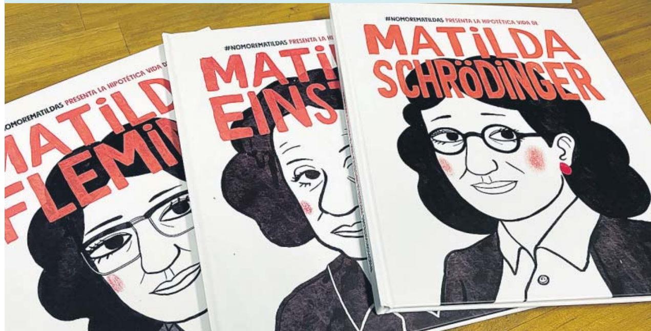
Los tres cuentos ilustrados lanzados por la campaña #NoMoreMatildas. NOMOREMATILDAS