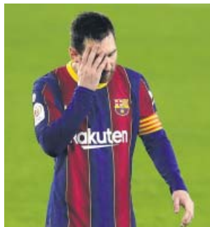
Messi se lamenta durante el partido del Pizjuán.

El central galo estaba con ganas de marcar y mostró sus impresionantes condiciones en una jugada plena de potencia. Salió con el balón jugado desde atrás, superó con pode-