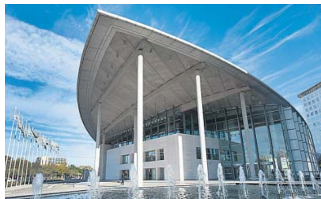
Entrada principal del Palacio de Congresos de València.