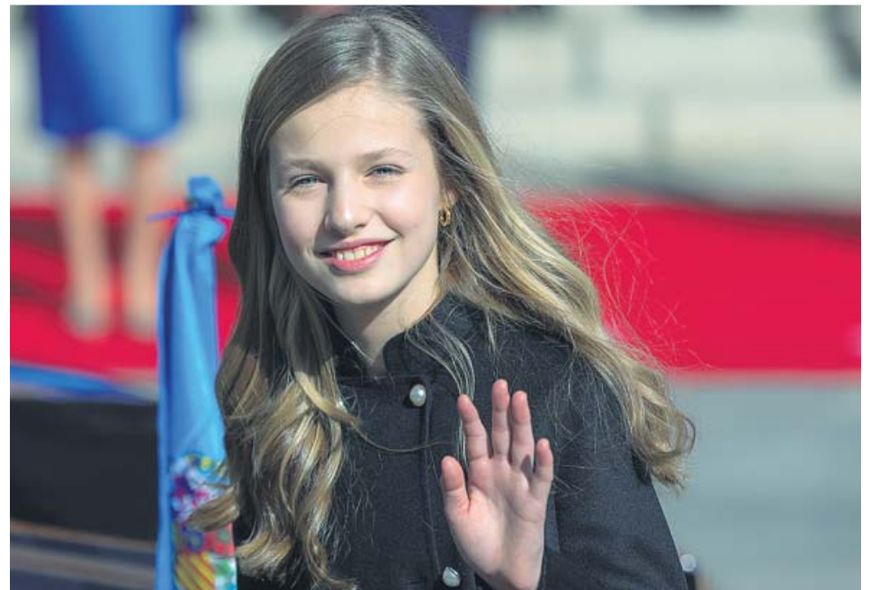
La princesa Leonor, de 15 años, en una imagen de archivo.

LEONOR compaginará su estancia en el Reino Unido con sus compromisos institucionales