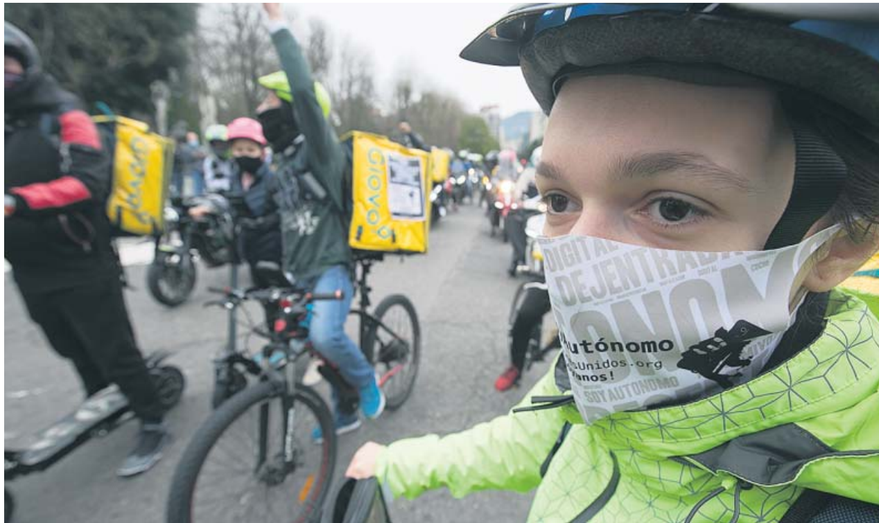
Repartidores de comida a domicilio, los llamados riders . EP

Trabajo y agentes sociales consensúan que la ley obligue a contratarlos. Los sindicatos exigen incluir a limpiadores o traductores