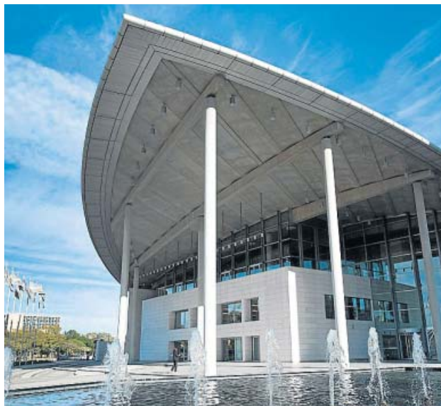
Palacio de Congresos de València.

El pasado 16 de diciembre el organismo recibió un correo electrónico del supuesto proveedor de este servicio de seguridad, anunciando el cambio de su cuenta bancaria. El correo adjuntaba una carta firmada por la empresa, con los datos correspondientes y el certificado de titularidad de la cuenta emitida por una enti-