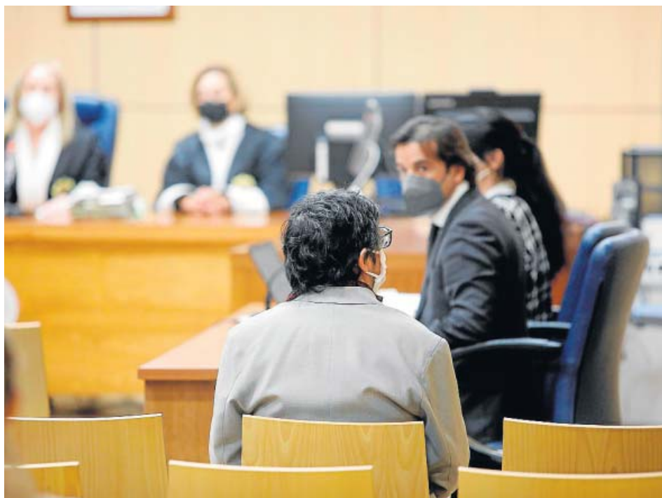
El acusado, ayer, en el juicio, repetido al estimarse un recurso de su defensa.

La Fiscalía ha reclamado que se aplique el subtipo agravado del delito continuado de abuso sexual a una menor al exmarido de la vicepresidenta Mónica Oltra por considerar que este educador actuó con prevalimiento respecto de una chica a la que tutelaba por las noches en un centro público. La Audiencia de València celebró ayer un nuevo juicio a Luis Eduardo R. por haber abusado supuestamente de una de las residentes de 14 años entre finales de 2016 y principios de 2017. ●