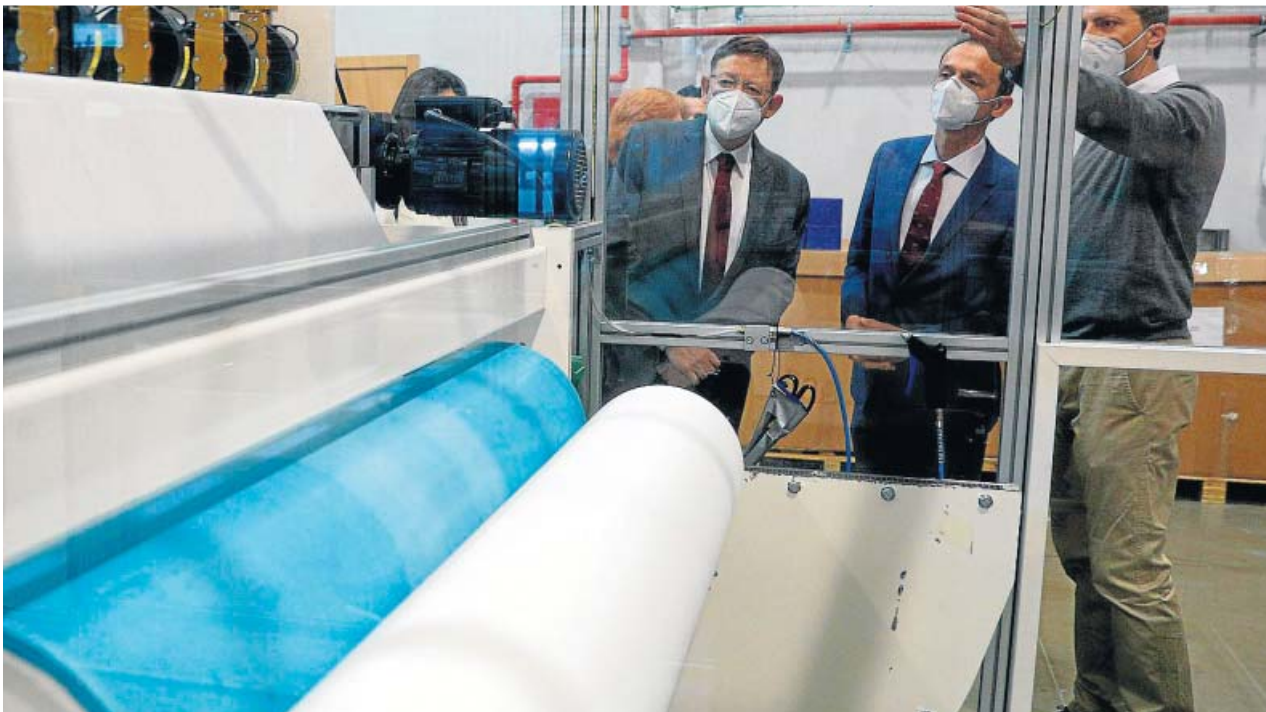
El ministro de Ciencia y el jefe del Consell, ayer, durante una visita a la empresa de material sanitario Bioinicia.