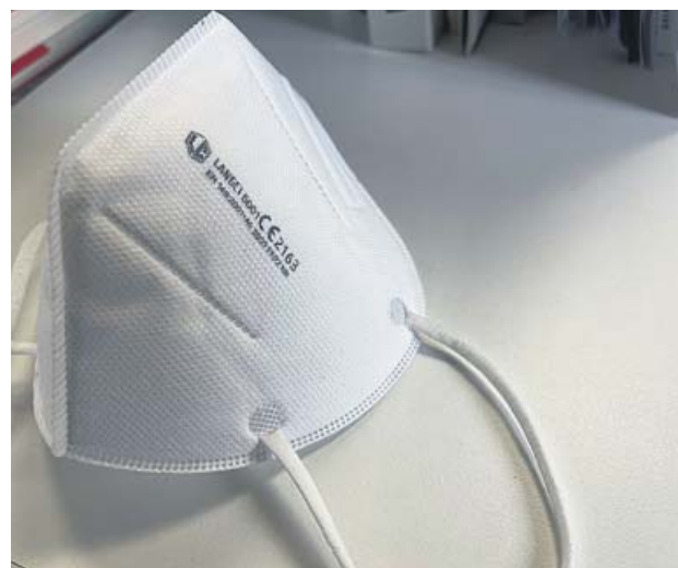
Un ejemplar de mascarilla FFP2.

Durante esta semana se ha iniciado la distribución a todos los centros educativos valencianos de las primeras 850.000 unidades. Este primer envío cubrirá 10 días lectivos. Una vez culmine el re-