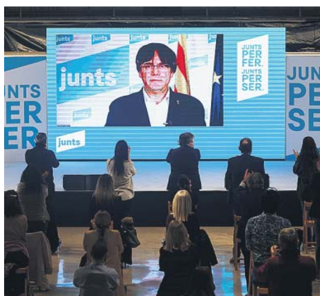
Carles Puigdemont, en un acto de campaña del 14-F.

«Un suplicatorio es una garantía de la independencia del Parlamento Europeo. No es un privilegio. La finalidad que tiene la inmunidad es proteger al Parlamento y a esos diputados frente a posibles procedimientos judiciales relacionados con su actividad como diputados», explicó el presidente de la Comisión de Asuntos Jurídicos, Adrián Vázquez, eurodiputado de Ciudadanos, a 20minutos an-