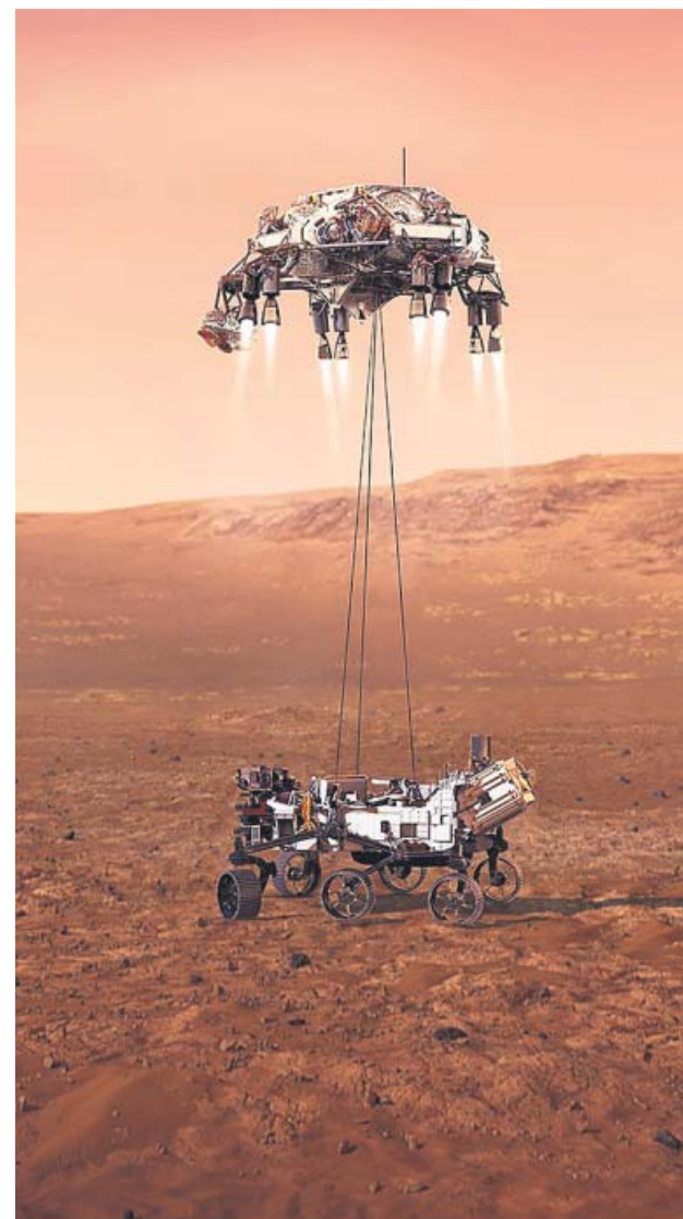
Recreación del aterrizaje del Perseverance en Marte.

Este nuevo aterrizaje estadounidense en el planeta vecino se produce apenas unos días después de que Emiratos Árabes y China consiguieran situar sus sondas Hope y Tianwen-1 en la órbita de Marte, donde se hallan actualmente. ●