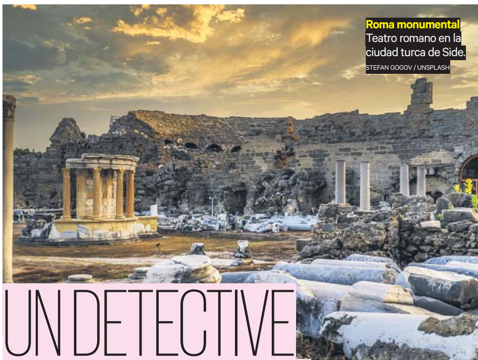
Roma monumental Teatro romano en la ciudad turca de Side.