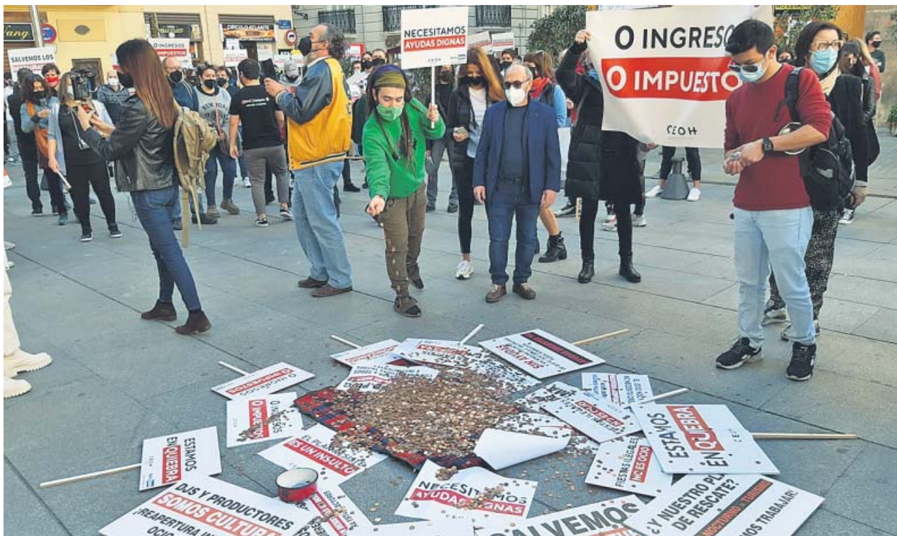
Una de las protestas del sector de la hostelería y el ocio nocturno que se han llevado a cabo contra las restricciones.

SE DESTINARÁN a 'pubs', discotecas y otras salas de fiesta como cafés teatro o cafés concierto y de forma directa XIMO PUIG dice que son «necesarias» y estudia que, a partir del 1 de marzo, se «flexibilicen» algunas restricciones