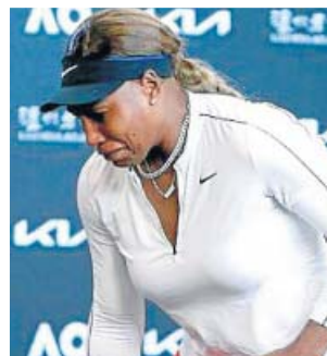
Serena Williams deja la rueda de prensa llorando.

cuenta con 31, después de cerrar un partido después de dos horas de duración. El rival de Djokovic saldrá del duelo que hoy disputen Tsitsipás y Medvedev. Y mientras, el cuadro femenino ya tiene final: la estadounidense Brady se medirá con la japonesa Osaka, que prolongó la maldición de Serena Williams, incapaz de sumar desde hace años su Grand Slam número 24, y que abandonó entre lágrimas la sala de prensa. ●