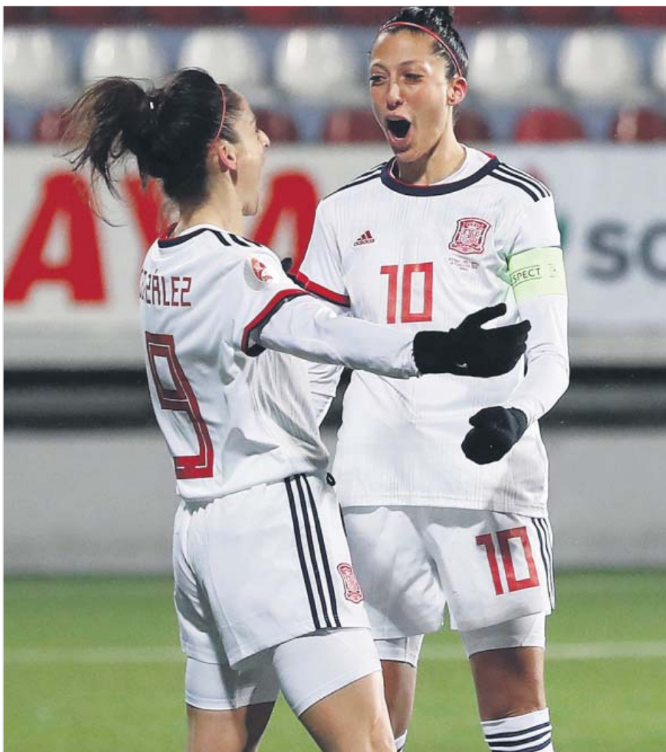
Hermoso celebra uno de los goles que marcó ayer.