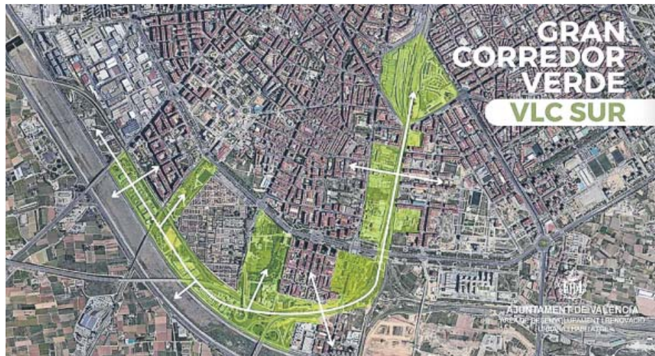
Superficie destinada al futuro corredor verde.