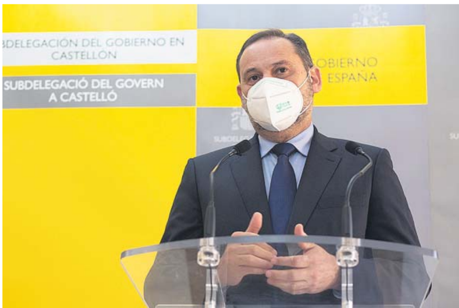
El ministro de Transportes, Movilidad y Agenda Urbana, José Luis Ábalos.