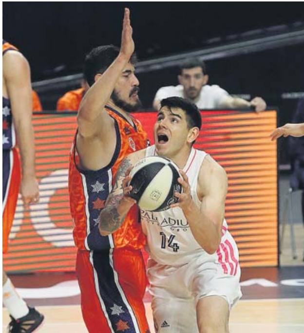
Partido de Copa entre Valencia Basket y Real Madrid.

LA DERROTA en los cuartos de la Copa del Rey aún duele en el cuadro taronja por cómo se produjo NECESITA GANAR el Valencia Basket para no descargarse de la lucha por los 'playoffs' de la Euroliga