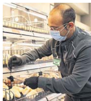
Empleado de la cadena Mercadona.

muy orgullosa por ello. «Han sabido garantizar la apertura todos los días de nuestros más de 1.600 supermercados en España y Portugal, que no habría sido posible sin el talento y el esfuerzo diario de todas y cada una de las trabajadoras y trabajadores que formamos la compañía y sin su compromiso para entregar los pedidos online en los momentos tan difíciles que estamos viviendo», ha señalado.