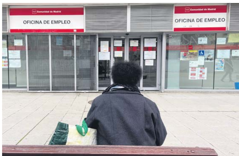
Una persona espera sentada frente a una oficina de empleo.

PP, Pablo Casado, tras conocer los datos.