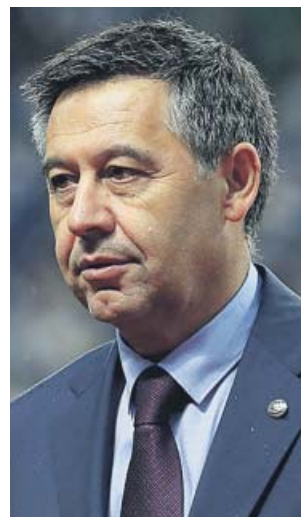
Bartomeu, en una fotografía de archivo.