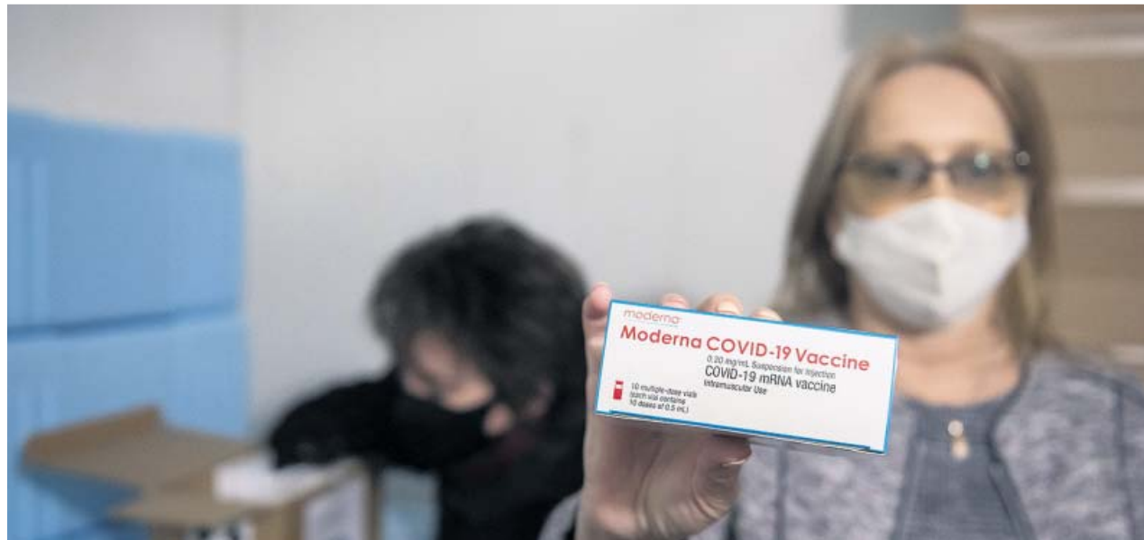
Una funcionaria del gobierno húngaro sujeta una caja con una dosis de la vacuna de Moderna, antes de ser administrada.

Austria no es el único país miembro que va a adoptar esta estrategia. Dinamarca, República Checa, Eslovaquia o Polonia van en el mismo camino y se unirían a Hungría, que ya apostó por la Sputnik V y la vacuna china de Sinopharm (que la ha recibido incluso el primer ministro Viktor Orbán). Eslovaquia, de hecho, ya ha firmado un contrato para dos millones de dosis de Sputnik. Austria y Dinamarca, por su parte, apuestan por refor-