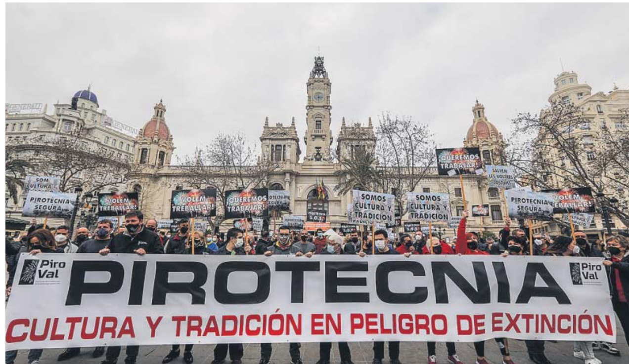
Empresarios y trabajadores pirotécnicos se manifestaron el lunes en València para denunciar la situación del sector.

El alcalde de València, Joan Ribó, hizo ayer un llamamiento a autónomos y empresas de hasta diez empleados que se han visto afectadas por el im-