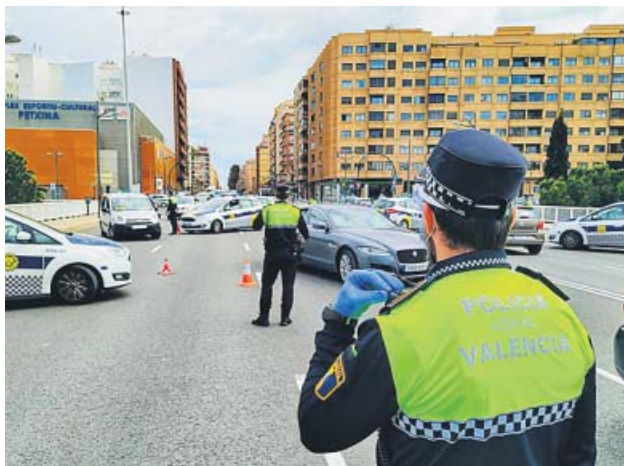
Un control policial en la Petxina.