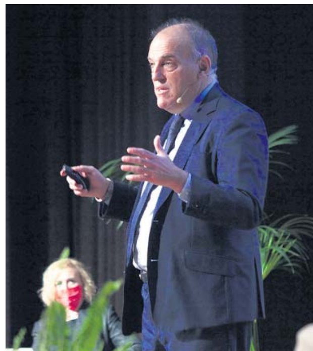
Javier Tebas, presidente de LaLiga.

Una grieta insalvable parece separar ya de forma irremediable a Lim y sus representantes en el club con el resto del mundo valencianista y de la ciudad, lo que ha provocado que en últimos