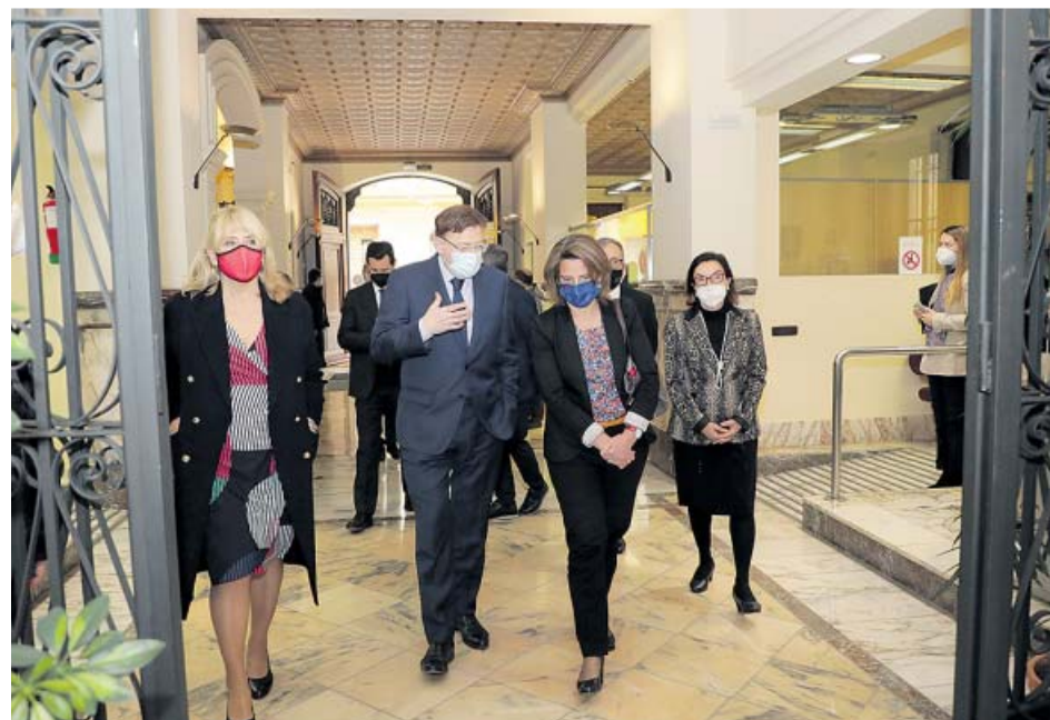
Ximo Puig y Teresa Ribera, ayer, en Castellón.

En el transcurso del acto, que contó con la asistencia de la vicepresidenta cuarta y ministra para la Transición Ecológica y el Reto Demográfico, Teresa Ribera, se dio a conocer la Estrategia Avant 20/30 que la Generalitat ha impulsado jun-