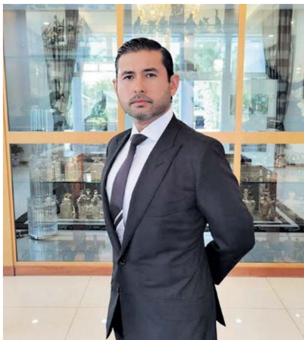
El príncipe de Johor, Tunku Ismail.

Mientras, la empresa Meriton Holding, propiedad de Peter Lim y que posee el paquete accionarial mayoritario del Valencia, sigue ganando adeptos en su contra y en los últimos días los principales dirigentes políticos de la ciudad y de la Comunitat se han manifestado abiertamente en