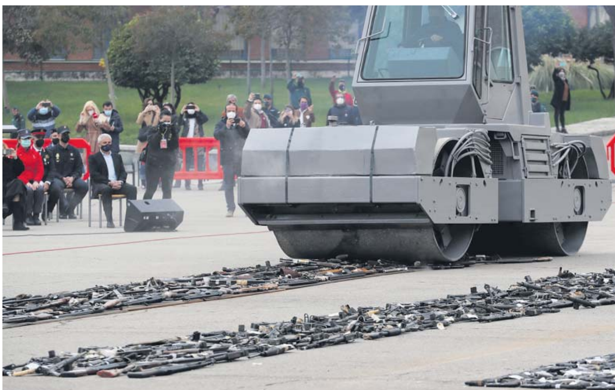
Instante en el que la apisonadora destruye las armas requisadas a ETA y los Grapo.

Tampoco el Colectivo de Víctimas del Terrorismo (Covite) quiso participar en lo que ha considerado un «acto propagandístico». «¿Cómo vamos a ir a un acto público en el que se destruyen las armas con las que han asesinado a nuestros familiares?»