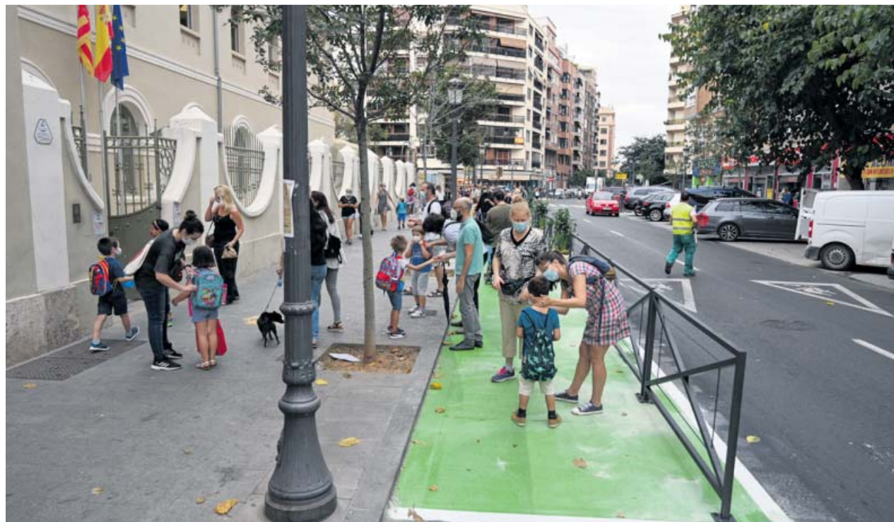
Padres y madres junto a sus hijos en la entrada de un colegio de València.

No obstante, finalmente el Consejo Escolar Municipal no ha dado luz verde a esta opción y ha acordado mantener los festivos escolares tal y como estaban planteados. En