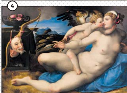
← 'Venus besada por Cupido' Obra de Hendrick van den Broeck a partir de un dibujo de Miguel Ángel. Es un óleo sobre tabla, de medidas 120 x 195 cm. De 1550-1570. Nápoles, Museo e Real Bosco di Capodimonte. Es uno de los préstamos más relevantes de la exposición.