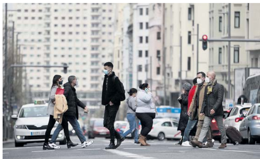
Varias personas cruzan una calle de Madrid con la mascarilla puesta.

didias restrictivas impuestas para prevenir el contagio masivo.