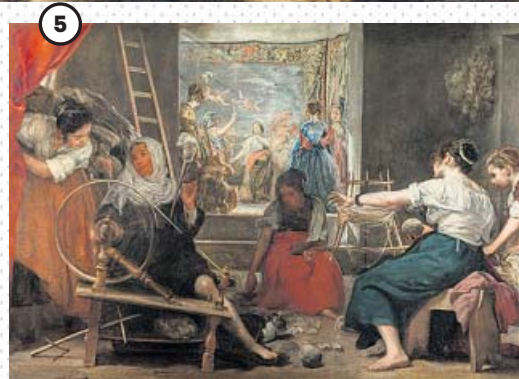
← 'La fábula de Aracne o Las hilanderas' Conocidísimo cuadro del pintor español Diego Velázquez. Es un óleo sobre lienzo, de medidas 170 x 250 cm (dimensiones originales, sin las adiciones del siglo xviii); actualmente 223 x 293,4 cm. De 1655-60. Madrid, Museo Nacional del Prado.